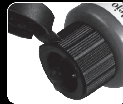
Cuentagotas / Eyedropper