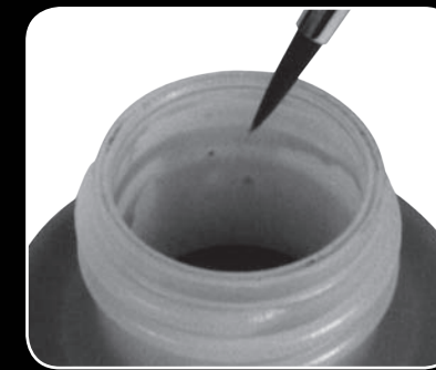
Boca ancha / Wide mouth