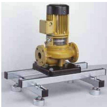
Schallentkoppelter Pumpenunterbau aus MPC-Systemschienen