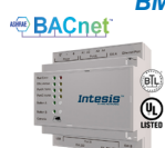
INBACMID (1) (CL99222)