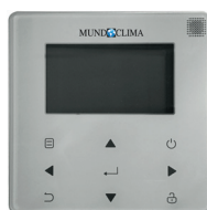
KJRH-120H/BMK0-E Bestellnr. CL09204 (enthalten)

Alle Geräte werden ab Werk mit einer kabelgebundenen Wandfernbedienung ausgeliefert, mit der das Gerät von zu Hause aus gesteuert werden kann. Diese Steuerung verfügt über ein WLAN-Modul, das die Fernsteuerung des Geräts ermöglicht, sowie über ein Modbus-Protokoll, um es in ein Managementsystem zu integrieren.