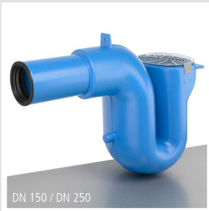
DN 150 / DN 250

3P Überlaufsiphon DN 150 / DN 200 / DN 250 mit Nagetiersperre