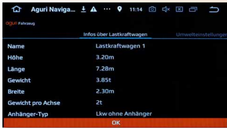
Eingabe der Fahrzeugparameter