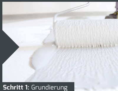
Schritt 1: Grundierung