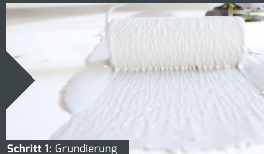
Schritt 1: Grundierung