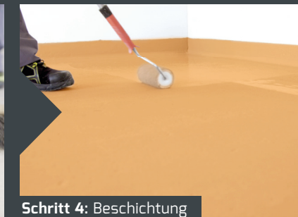
Schritt 4: Beschichtung