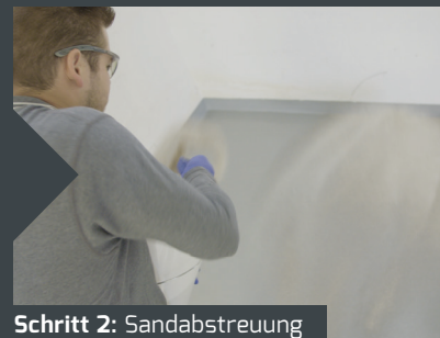
Schritt 2: Sandabstreuung