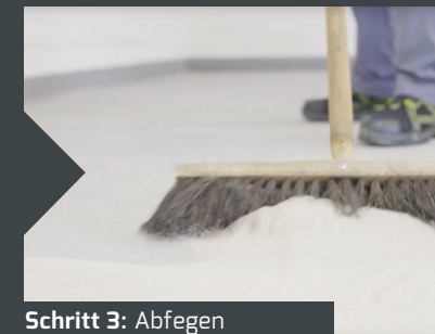
Schritt 3: Abfegen