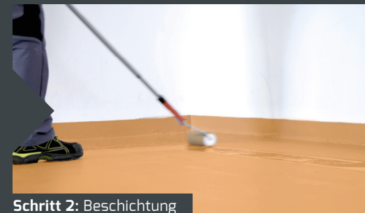
Schritt 2: Beschichtung