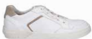
29802-353-097 | weiss-beige | 41 - 47