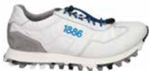
31701-TE353-095 | weiss-grau | 41 - 47