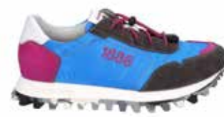
61701-TE281-786 | asphalt-blau | 41 - 47