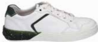
89802-353-092 | weiss-grün | 36 - 42