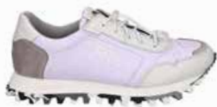
61701-TE353-077 | weiss-flieder | 41 - 47