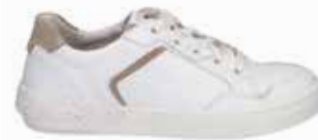
89802-353-097 | weiss-beige | 36 - 42