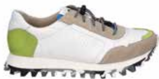
61701-TE281-257 | beige-hellgrün | 41 - 47