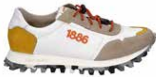
61701-TE281-258 | beige-gelb | 41 - 47