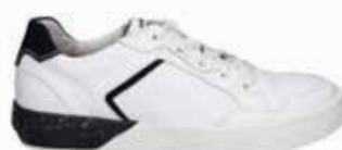
29802-353-093 | weiss-blau | 41 - 47