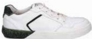
29802-353-092 | weiss-grün | 41 - 47