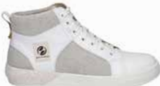
29801-TE281-001 | weiss-kombi | 41 - 47