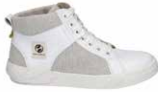
89801-TE353-001 | weiss-kombi | 36 - 42