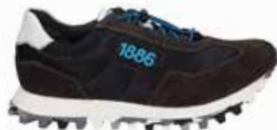
31701-TE281-156 | titan-weiss | 41 - 47