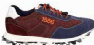
31701-TE281-508 | blau-bordeaux | 41 - 47