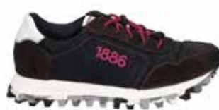
61701-TE281-156 | titan-weiss | 41 - 47