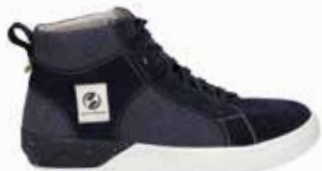
29801-TE281-531 | ocean-kombi | 41 - 47