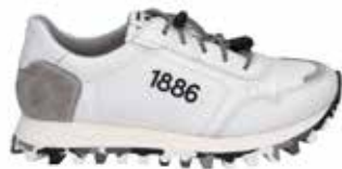
61701-TE353-095 | weiss-grau | 41 - 47