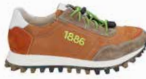
61701-TE281-267 | taupe-orange | 41 - 47