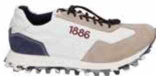
31701-TE281-255 | beige-blau | 41 - 47