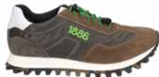
31701-TE281-268 | taupe-oliv | 41 - 47