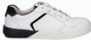
89802-353-093 | weiss-blau | 36 - 42