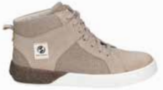
89801-TE281-201 | beige-kombi | 36 - 42