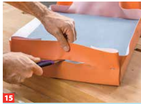
17 ... leicht um die Ecken biegen. Sie lassen sich ansetzen und beliebig kürzen; in die durchbohrten Kappen und am Ende ...