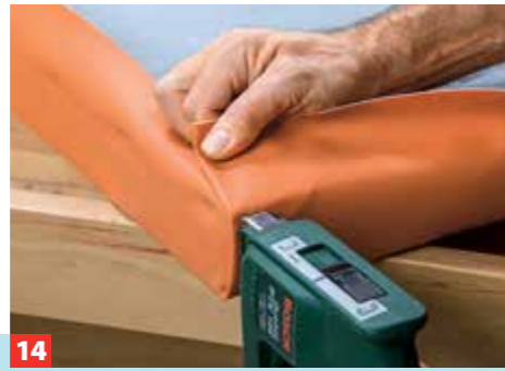
14 ... Elektrotacker in einer Flucht anheften, dann die Seiten einschlagen und ebenfalls faltenfrei und mit leichtem Zug anheften.