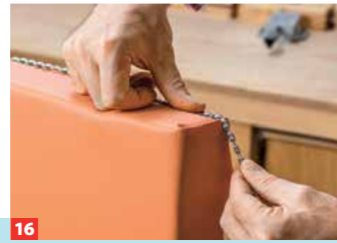
16 Ziernagelstangen mittig über die Heftklammern legen und mit einem Polsternagel am Anfang fixieren. Die Stangen können Sie ...