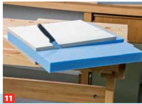
11 Die 5 cm starke Polsterschaummatte lässt sich sauber – ohne Druck – mit einem Brotmesser entlang einer Brettkante schneiden.