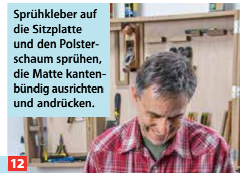
12 Sprühkleber auf die Sitzplatte und den Polsterschaum sprühen, die Matte kantenbündig ausrichten und andrücken.