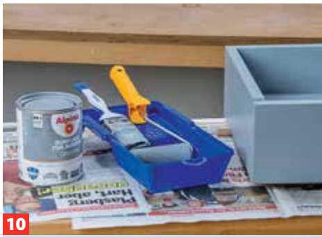
10 Nun lackieren Sie die Holzflächen. Beste Ergebnisse erzielen Sie mit zwei Anstrichen und einem Zwischenschliff.