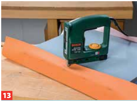
13 Breiten Sie nun das Kunstleder aus und schlagen es an zwei gegenüberliegenden Kanten hoch. Nah am Rand mit dem ...