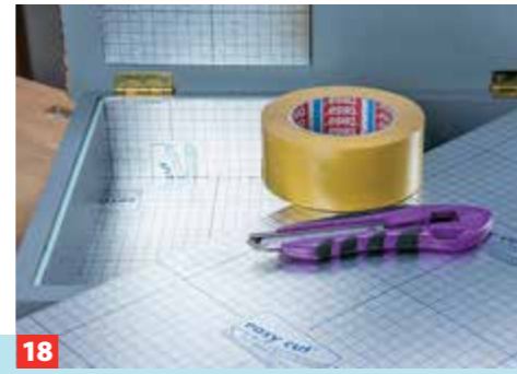
18 ... jeweils Polsternägel einschlagen. Bei Bedarf ein „Kühlfach“ mit isolierender, aluminierter Trittschalldämmung auskleiden.