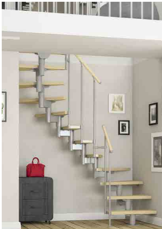
Die komfortable und moderne Mittelholmtreppe mit breiten und tiefen Stufen.