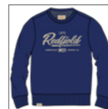
RF 189 dark denim ID: 20916