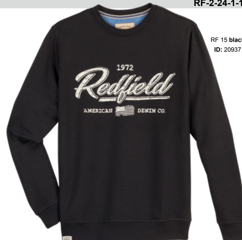
RF 15 black ID: 20937

Style description: Sweat Shirt O-Neck with center chest pigment print