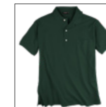
NOS RF 36 dusty green ID: 11415