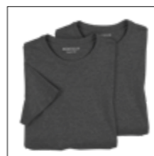
NOS RF 22 antra. mel. ID: 636