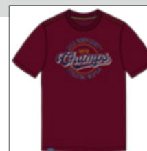
RF 76 barolo ID: 20975