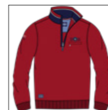
RF 229 hibiskus ID: 20820