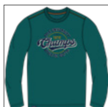
RF 855 cadmium green ID: 20961