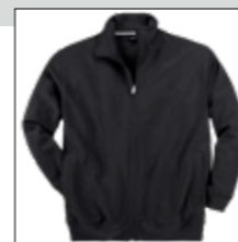
NOS RF 15 black ID: 2526