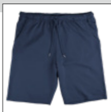
NOS RF 01 navy ID: 1969