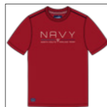
RF 229 hibiskus ID: 20859