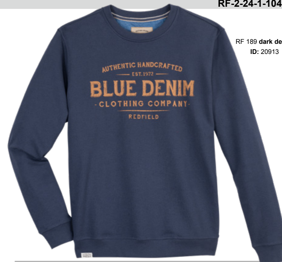
RF 189 dark denim ID: 20913

Style description: Sweat-Shirt O-Neck, center chest pigment print