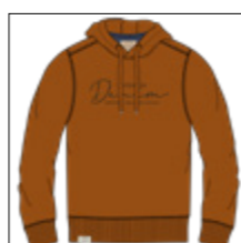
RF 25 dark pumpkin ID: 20944

Style description: Sweat Hoody with center chest print and embro