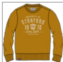
RF 19 rich yellow ID: 20924