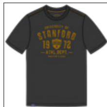
RF 15 black ID: 20982

Style description: T-Shirt 1/2 sleeve, O-Neck, center chest print