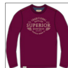
RF 17 dark grape ID: 20991