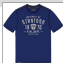
RF 189 dark denim ID: 20979