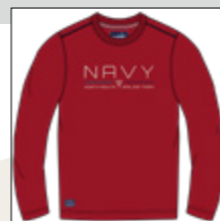
RF 229 hibiskus ID: 20841