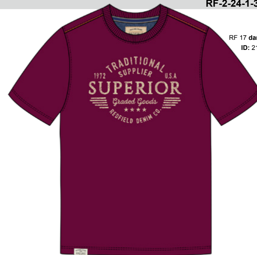
RF 17 dark grape ID: 21020

Style description: T-Shirt 1/2 sleeve, O-Neck, center chest print