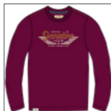
RF 17 dark grape ID: 20996