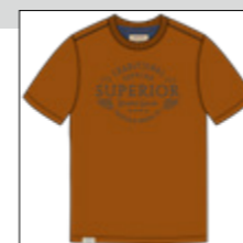
RF 25 dark pumpkin ID: 21022