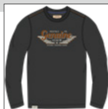
RF 15 black ID: 20994