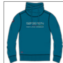
RF 219 pacific ID: 20822

Style description: Sweat turtle collar with center chest high density prints