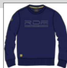
RF 547 night blue ID: 20882