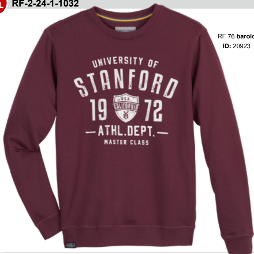
RF 76 barolo ID: 20923