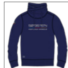
RF 547 night blue ID: 20821