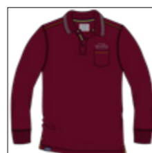
RF 76 barolo ID: 20938

Style description: Polo Pique long sleeve with chest pocket and left chest embro, collar with contrast tipping, halfmoon in self fabric Material: Pique 100% Cotton | einteilbare Größen: M-8XL, 10XL