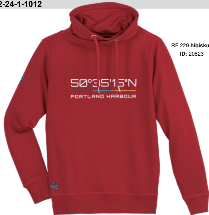
RF 229 hibiskus ID: 20823