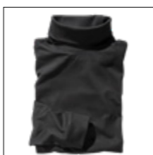
NOS RF 15 black ID: 354