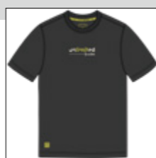
RF 15 black ID: 20894