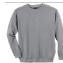
NOS RF 89 grey mel. ID: 3188