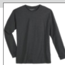
NOS RF 22 anthra. mel. ID: 4078

Style description: Longsleeve T-Shirt | Design: solid & melange Material: Jersey, 100% Cotton, anthra. mel. 80% Cotton 20% Polyester einteilbare Größen: M-8XL, 10XL