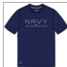
RF 547 night blue ID: 20794

Style description: T-Shirt 1/2 sleeve, O-Neck, high density center chest print