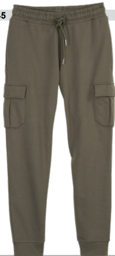
RF 27 khaki ID: 20803