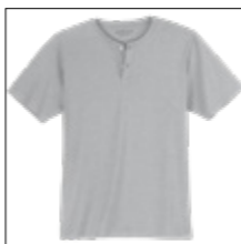
NOS RF 89 grey mel. ID: 4159