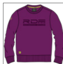
RF 679 light plum ID: 20884