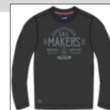
RF 15 black ID: 20846