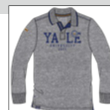
RF 89 grey mel. ID: 20951

Style description: Polo Pique long sleeve with chest pocket and left chest embro, collar with contrast tipping, halfmoon in self fabric Material: Pique 100% Cotton | einteilbare Größen: M-8XL, 10XL