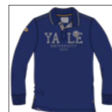
RF 189 dark denim ID: 20950