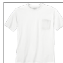
NOS RF 16 white ID: 10078