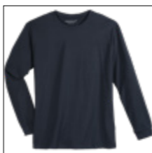
NOS RF 01 navy ID: 4079