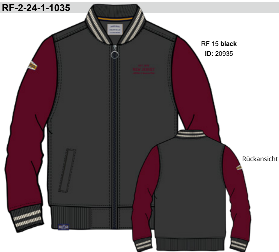
RF 15 black ID: 20935