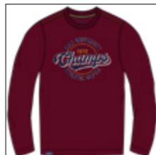
RF 76 barolo ID: 20958

Style description: T-Shirt long sleeve, O-Neck, center chest print