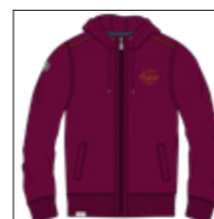
RF 17 dark grape ID: 20948