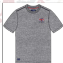
RF 89 grey mel. ID: 20867