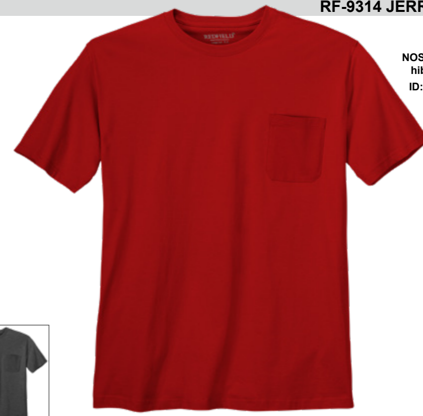
NOS RF 229 hibiskus ID: 10048

Style description: T-Shirt, O-Neck (chest pocket) | Design: solid Material: Jersey, 100% Cotton einteilbare Größen: M-8XL, 10XL