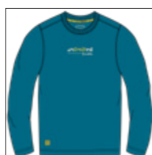
RF 219 pacific ID: 20900

Style description: T-Shirt long sleeve, O-Neck, high density center chest print