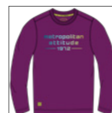
RF 679 light plum ID: 20905