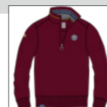
RF 76 barolo ID: 20920