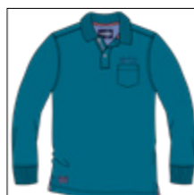
RF 219 pacific ID: 20826

Style description: Polo Pique long sleeve with chest pocket and left chest high density print, halfmoon in oxford fabric