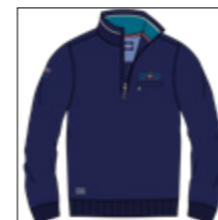
RF 547 night blue ID: 20789