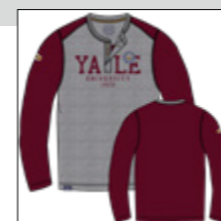
RF 76 barolo ID: 20972