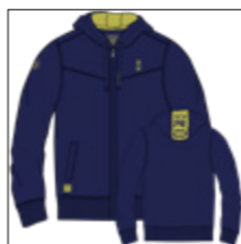
RF 547 night blue ID: 20869

Style description: Sweat Hoody Jacket with two side pocket, with high density print at left chest and right sleeve