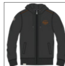
RF 15 black ID: 20947

Style description: Sweat Hoody Jacket with fully zipper front, two side pocket, left chest print and right sleeve badge