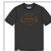
RF 15 black ID: 21019