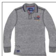
RF 89 grey mel. ID: 20830