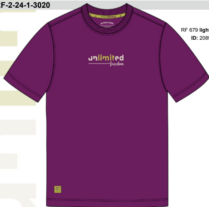
RF 679 light plum ID: 20895