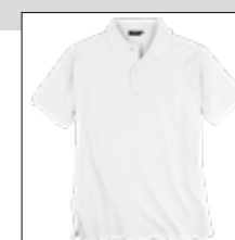
NOS RF 16 white ID: 553

Style description: Polo Pique Longsleeve (chest pocket) Design: solid & melange | Material: Pique, 100% Cotton, anthra. mel. 80% Cotton 20% Polyester, grey mel. 85% Cotton 15% Viscose einteilbare Größen: M-8XL, 10XL