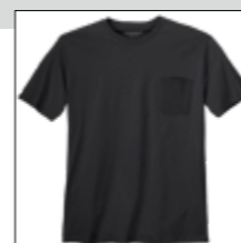
NOS RF 15 black ID: 10077

Style description: T-Shirt, O-Neck (chest pocket) | Design: solid Material: Jersey, 100% Cotton einteilbare Größen: M-8XL, 10XL