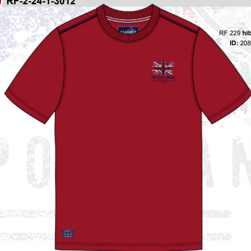
RF 229 hibiskus ID: 20868

Style description: T-Shirt 1/2 sleeve, O-Neck, left chest print