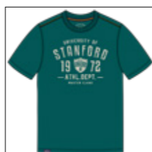
RF 855 cadmium green ID: 20981