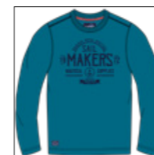
RF 219 pacific ID: 20844