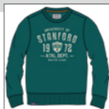
RF 855 cadmium green ID: 20925