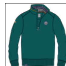
RF 855 cadmium green ID: 20922