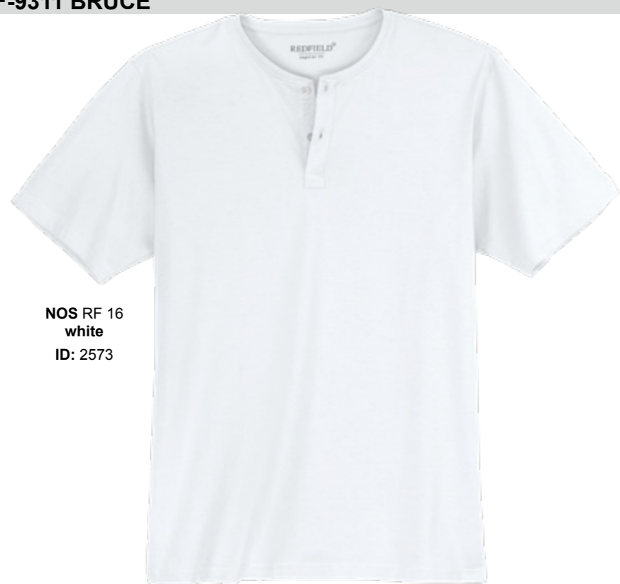
NOS RF 16 white ID: 2573

Style description: Serafino T-Shirt | Design: solid Material: Jersey, 100% Cotton, grey mel. 85% Cotton 15% Viscose einteilbare Größen: M-8XL, 10XL