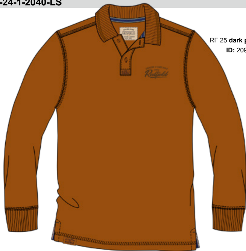
RF 25 dark pumpkin ID: 20967