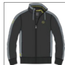
RF 15 black ID: 20872