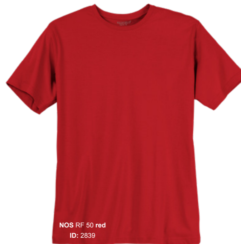
NOS RF 50 red ID: 2839

Style description: T-Shirt, O-Neck | Design: solid & melange Material: Jersey, 100% Cotton, antra. mel. 80% Cotton 20% Polyester einteilbare Größen: M-8XL, 10XL