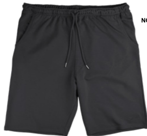
NOS RF 15 black ID: 1970