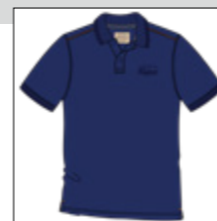
RF 189 dark denim ID: 20798