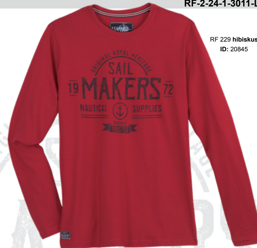
RF 229 hibiskus ID: 20845