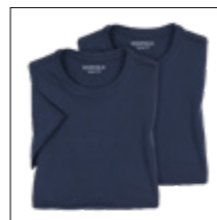
NOS RF 01 navy ID: 3744