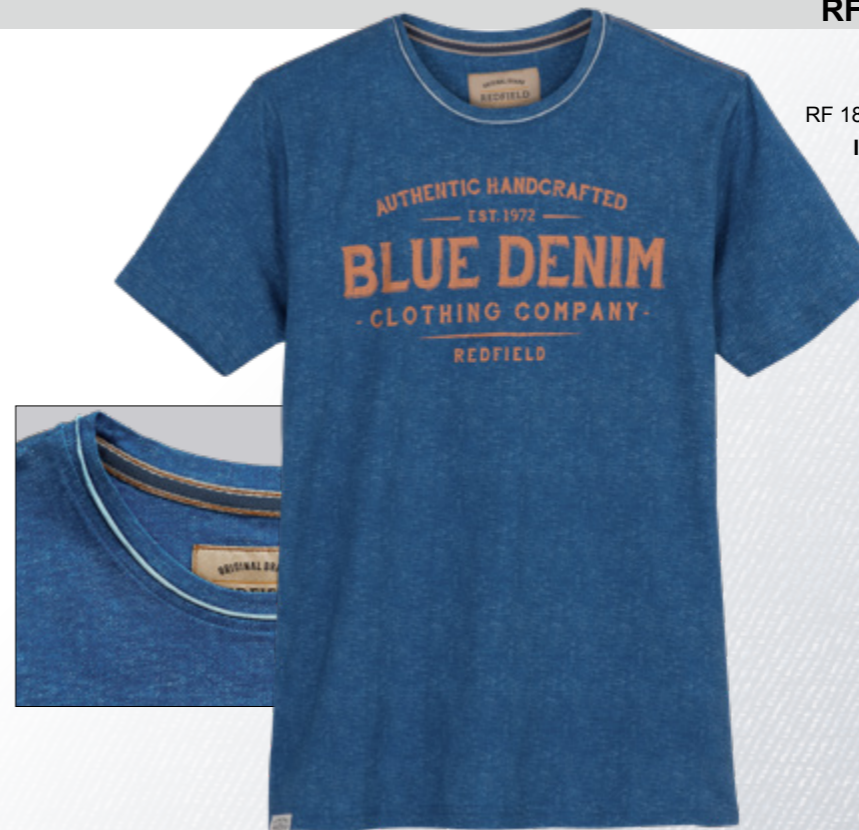
RF 189 dark denim ID: 21018

Style description: T-Shirt 1/2 sleeve, O-Neck, center chest print