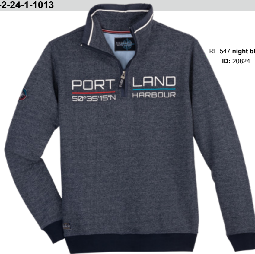
RF 547 night blue ID: 20824