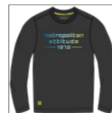
RF 15 black ID: 20903