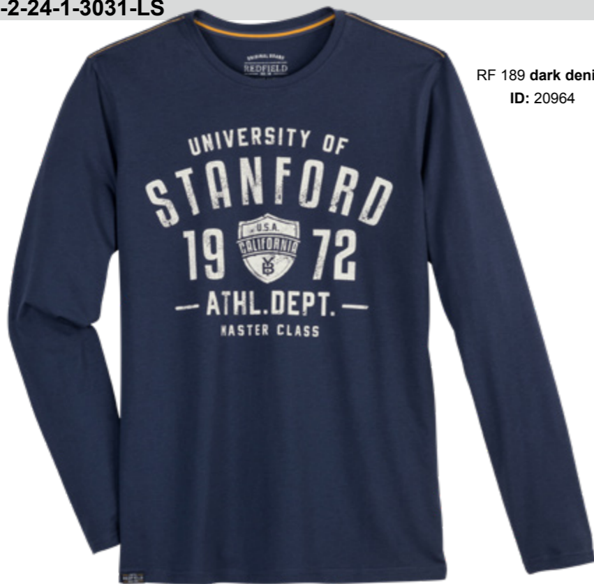
RF 189 dark denim ID: 20964