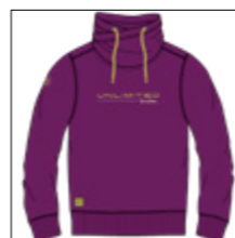
RF 679 light plum ID: 20880

Style description: Sweat turtle collar with center chest high density prints