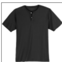
NOS RF 15 black ID: 2570