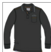
RF 15 black ID: 20941