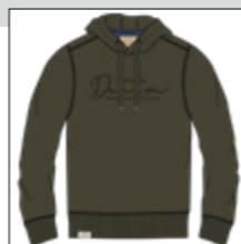
RF 27 khaki ID: 20942