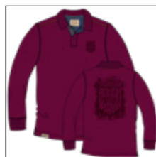
RF 17 dark grape ID: 20987