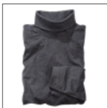
NOS RF 22 anthra. mel. ID: 3685

Style description: Turtleneck Longsleeve | Design: solid & melange Material: Heavy Jersey, 100% Cotton, anthra. mel. 80% Cotton 20% Polyester einteilbare Größen: M-8XL, 10XL