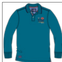
RF 219 pacific ID: 20829

Style description: Polo Pique long sleeve with contrast collar tipping, left chest high density print with embro and badge, halfmoon in oxford fabric