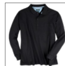
NOS RF 15 black ID: 1233

Style description: Polo Pique Longsleeve (chest pocket) Design: solid & melange | Material: Pique, 100% Cotton, anthra. mel. 80% Cotton 20% Polyester, grey mel. 85% Cotton 15% Viscose einteilbare Größen: M-8XL, 10XL