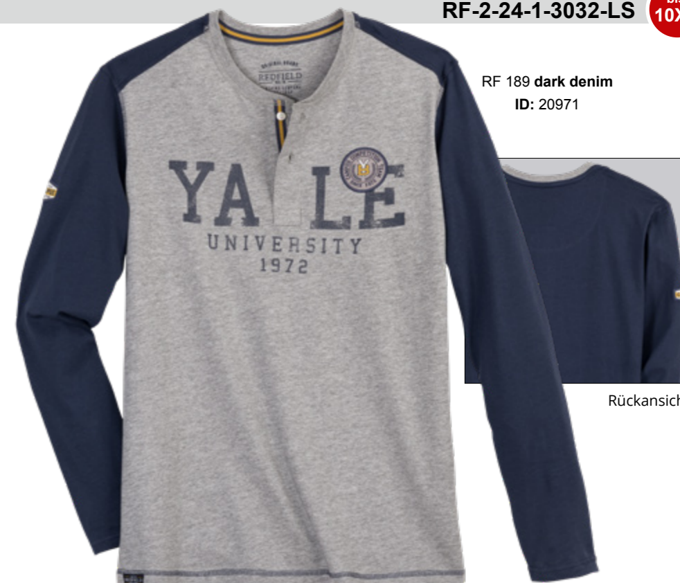
RF 189 dark denim ID: 20971