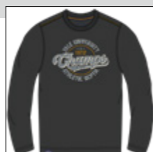
RF 15 black ID: 20962