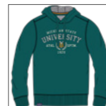
RF 855 cadmium green ID: 20918