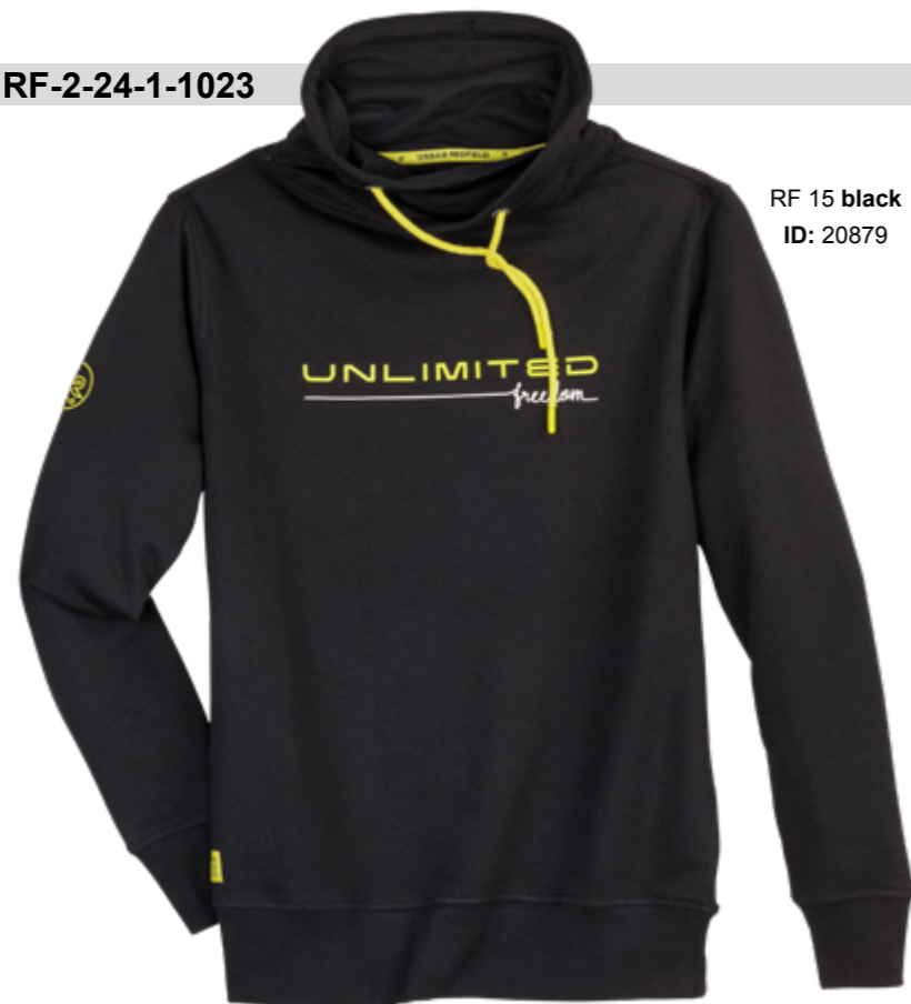
RF 15 black ID: 20879