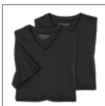
NOS RF 15 black ID: 4109