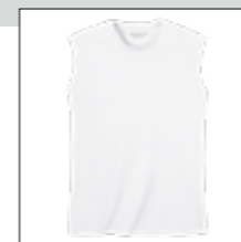
NOS RF 16 white ID: 2077