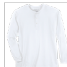
LOS RF 16 white ID: 8282