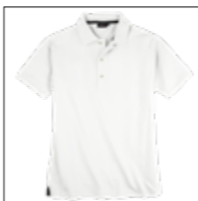
NOS RF 16 white ID: 10045