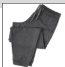
NOS RF 22 anthra. mel. ID: 6778