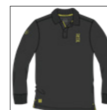
RF 15 black ID: 20887

Style description: Polo Pique long sleeve with left chest and right sleeve print in high density