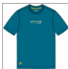
RF 219 pacific ID: 20896

Style description: T-Shirt 1/2 sleeve, O-Neck, high density center chest print