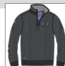
RF 716 iron mel. ID: 20819

Style description: Sweat-Jacket with Troyer collar, fully open zipper front and two side pockets, left chest high density print and right sleeve badge Material: Felpa fabric, 70% Cotton 30% Polyester, grey mel. 85% Cotton 15% Viscose einteilbare Größen: M-8XL, 10XL