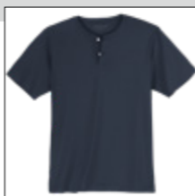
NOS RF 01 navy ID: 2574

Style description: Serafino T-Shirt | Design: solid Material: Jersey, 100% Cotton, grey mel. 85% Cotton 15% Viscose einteilbare Größen: M-8XL, 10XL