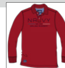
RF 229 hibiskus ID: 20836