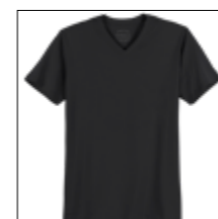
NOS RF 15 black ID: 2519

Style description: T-Shirt, V-Neck | Design: solid Material: Jersey, 100% Cotton einteilbare Größen: M-8XL, 10XL