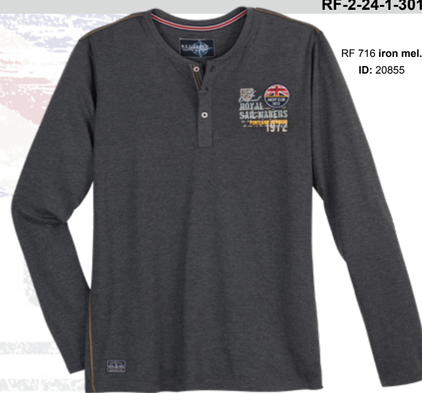
RF 716 iron mel. ID: 20855

Style description: T-Shirt long sleeve, serafino collar, left chest print and badge