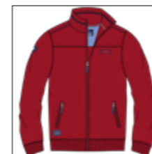
RF 229 hibiskus ID: 20811