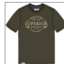
RF 27 khaki ID: 21021