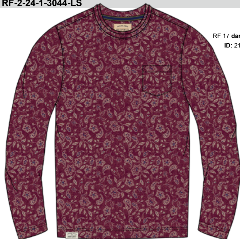
RF 17 dark grape ID: 21007