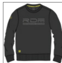
RF 15 black ID: 20883

Style description: Sweat-Shirt O-Neck, center chest transparent foilprint, high density print at right sleeve