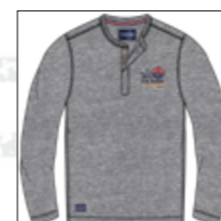
RF 89 grey mel. ID: 20856