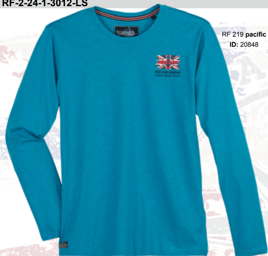
RF 219 pacific ID: 20848

Style description: T-Shirt long sleeve, O-Neck, left chest print