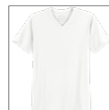
NOS RF 16 white ID: 2514