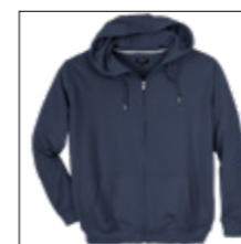
NOS RF 01 navy ID: 1423