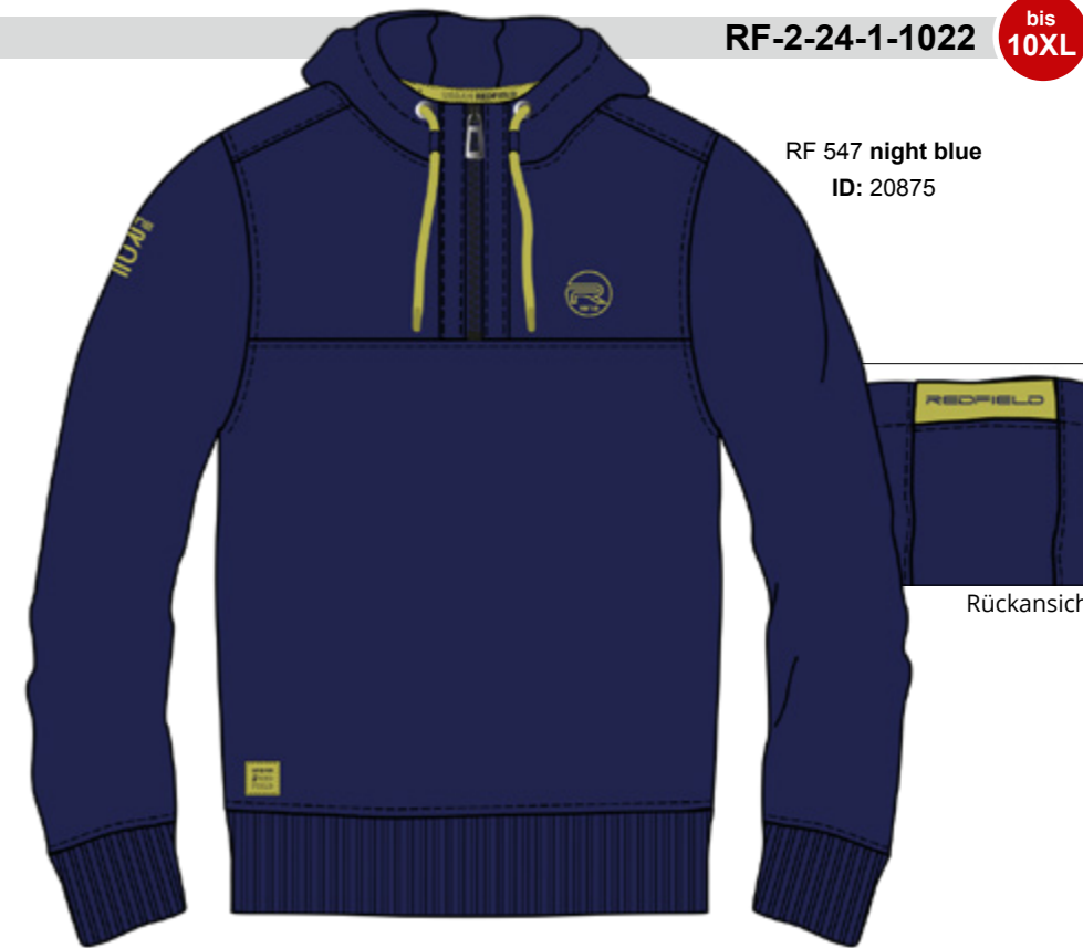
RF 547 night blue ID: 20875