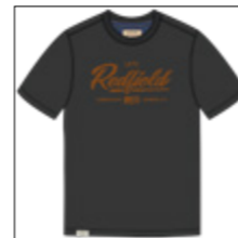
RF 15 black ID: 21011