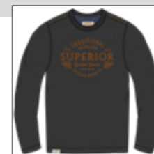
RF 15 black ID: 20990