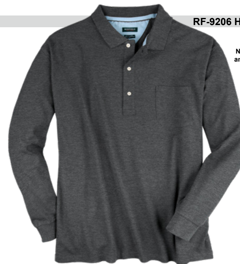
NOS RF 22 anthra. mel. ID: 2289