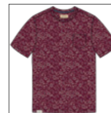
RF 17 dark grape ID: 21015