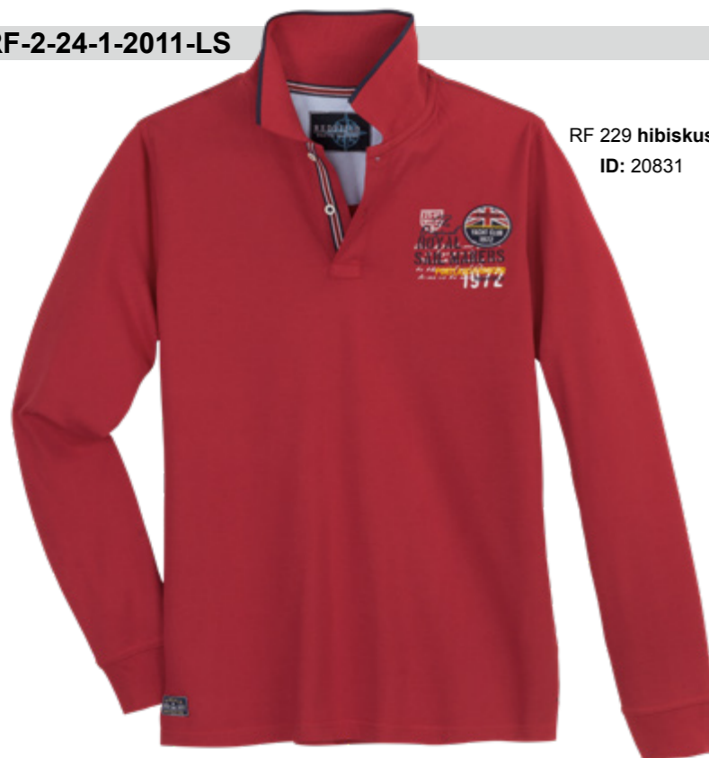
RF 229 hibiskus ID: 20831