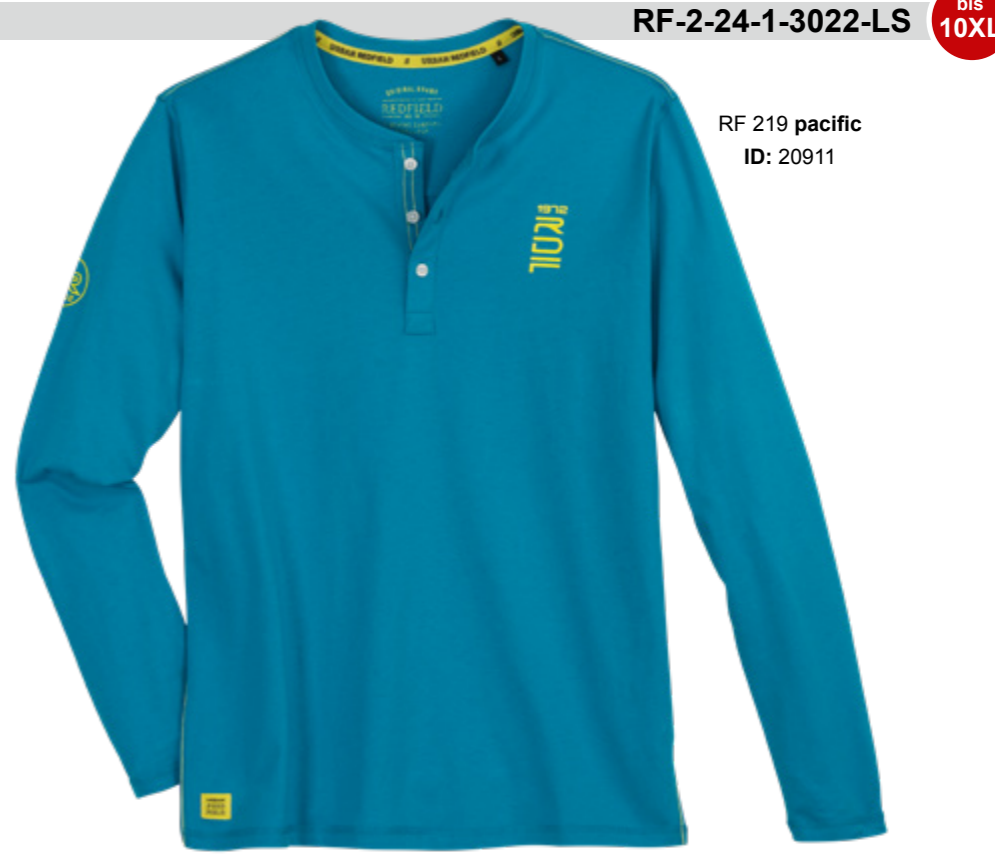
RF 219 pacific ID: 20911

Style description: T-Shirt long sleeve, serafino collar, left chest and right sleeve print