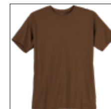
NOS RF 486 lavazza ID: 6364