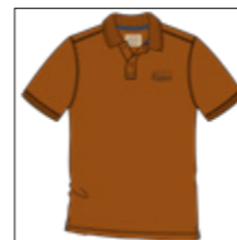
RF 25 dark pumpkin ID: 20797