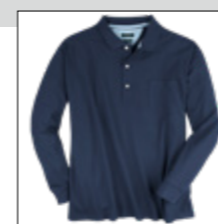
NOS RF 01 navy ID: 1232