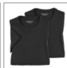
NOS RF 15 black ID: 573