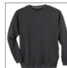
NOS RF 22 anthra. mel. ID: 374