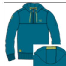
RF 219 pacific ID: 20877