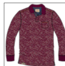
RF 17 dark grape ID: 20983