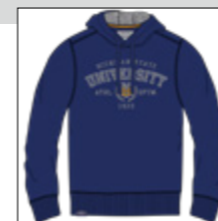
RF 189 dark denim ID: 20914