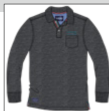
RF 716 iron mel. ID: 20827