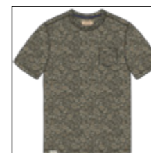
RF 27 khaki ID: 21016