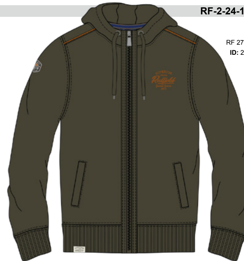
RF 27 khaki ID: 20949