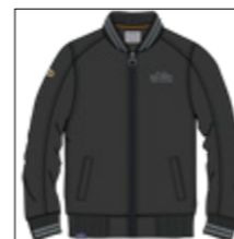
RF 15 black ID: 20929