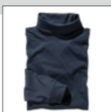
NOS RF 01 navy ID: 353