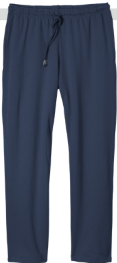
NOS RF 01 navy ID: 752