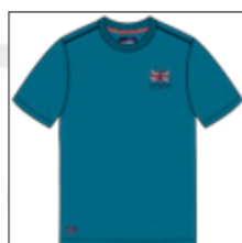
RF 219 pacific ID: 20866