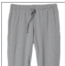
NOS RF 89 grey mel. ID: 753