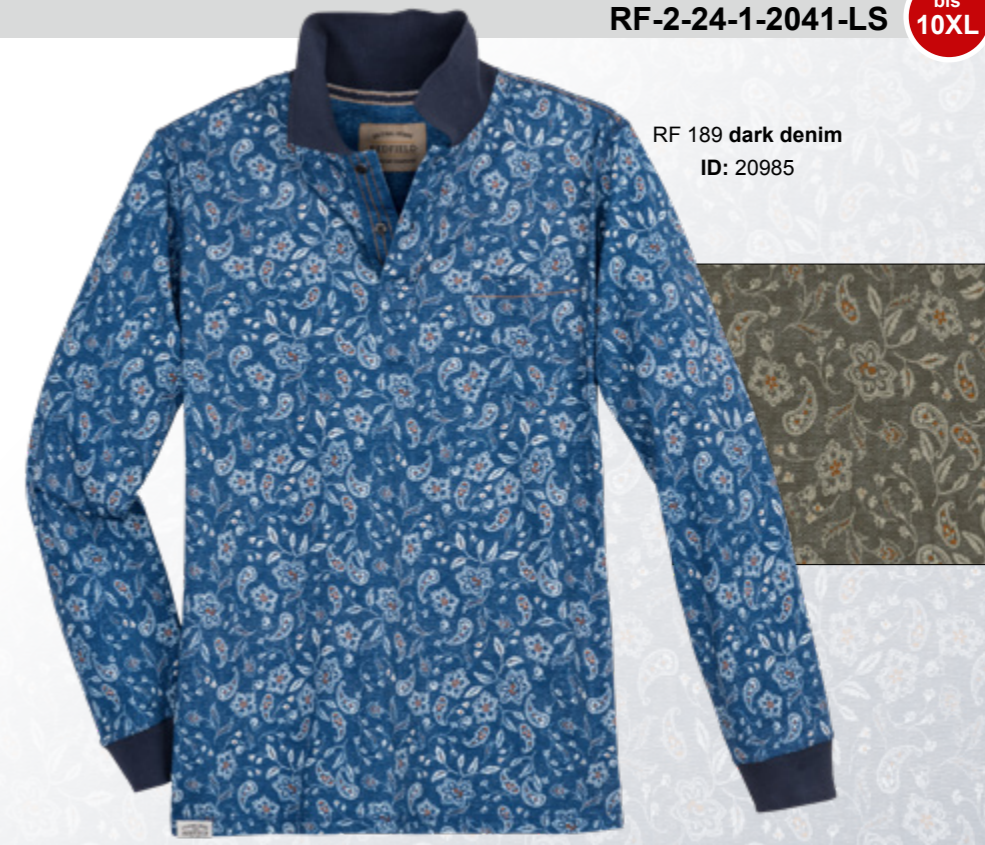
RF 189 dark denim ID: 20985