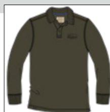
RF 27 khaki ID: 20965