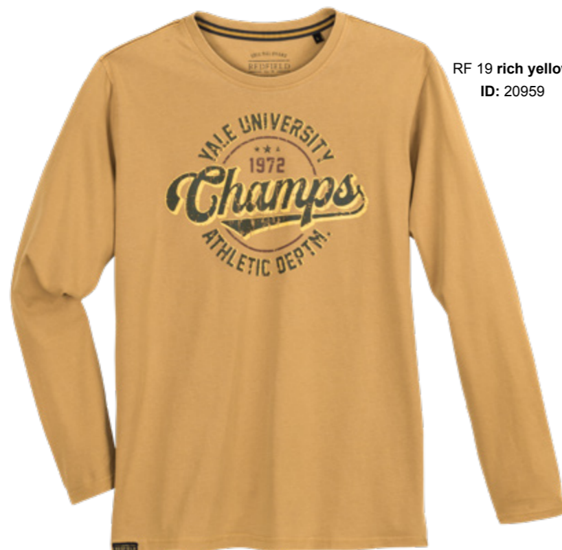
RF 19 rich yellow ID: 20959