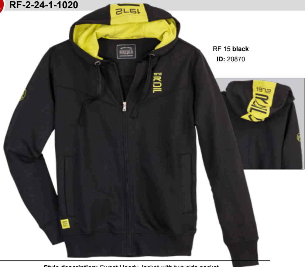
RF 15 black ID: 20870