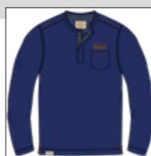
RF 189 dark denim ID: 21006