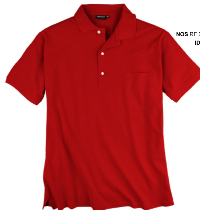
NOS RF 229 hibiscus ID: 313