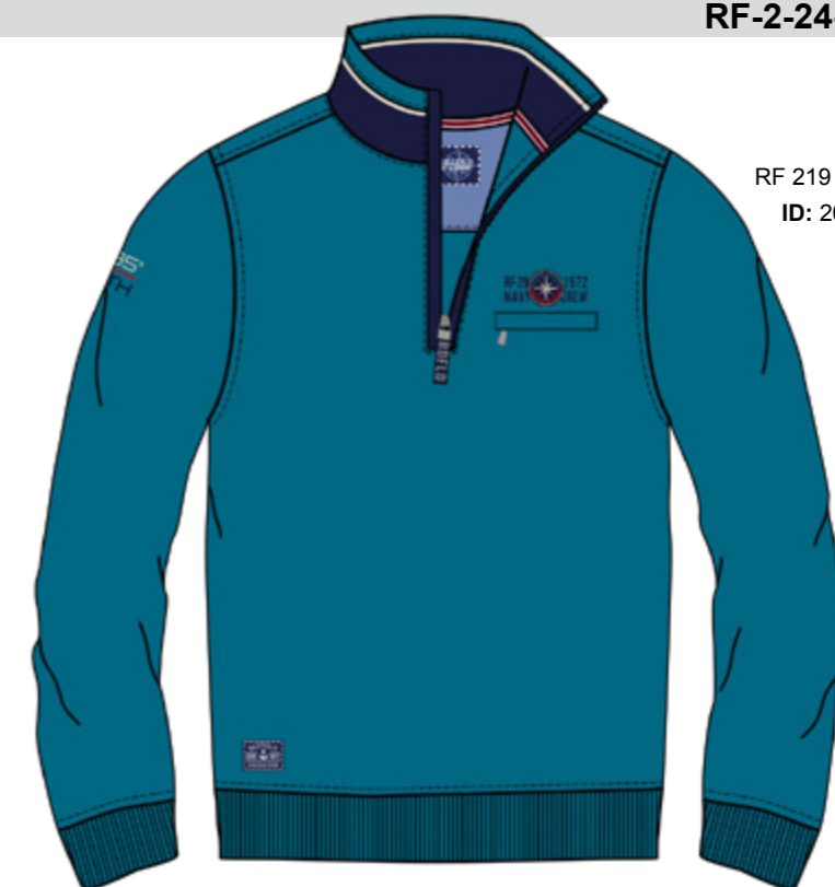
RF 219 pacific ID: 20818