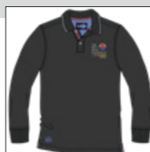
RF 15 black ID: 20832