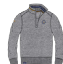
RF 89 grey mel. ID: 20921