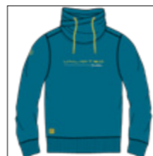
RF 219 pacific ID: 20881