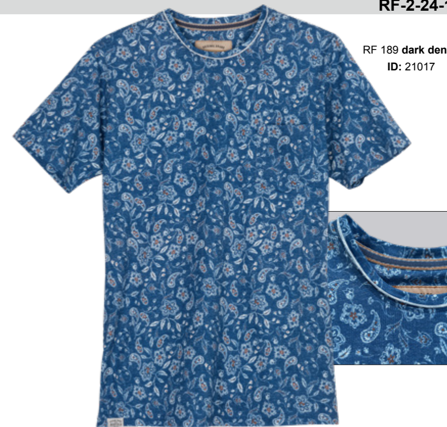
RF 189 dark denim ID: 21017

Style description: T-Shirt 1/2 sleeve, O-Neck, left chest pocket