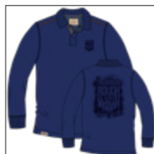
RF 189 dark denim ID: 20989

Style description: Polo Pique long sleeve with left chest print and big backprint