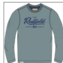
RF 23 winter sky ID: 21002