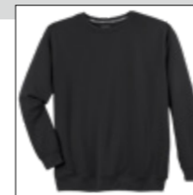
NOS RF 15 black ID: 377