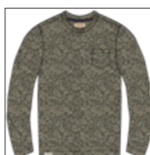
RF 27 khaki ID: 21009

Style description: T-Shirt long sleeve, O-Neck, left chest pocket