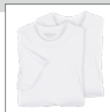
NOS RF 16 white ID: 572