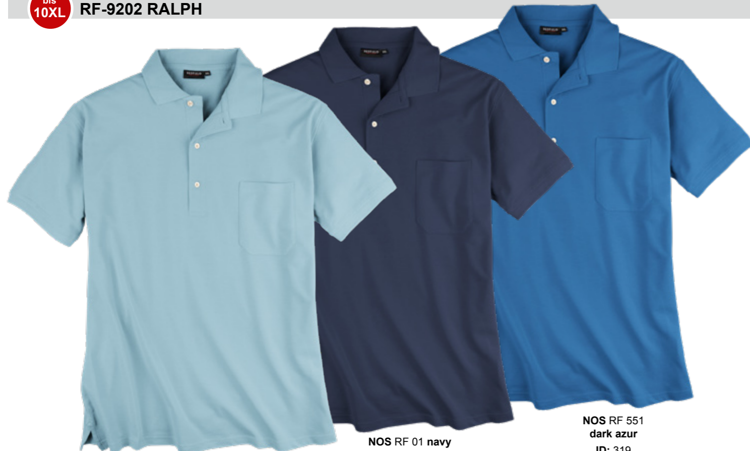
NOS RF 273 ice blue ID: 482