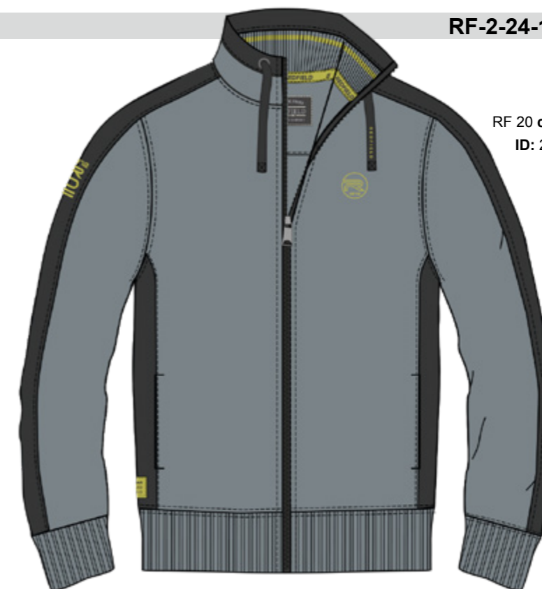
RF 20 cool grey ID: 20874

Style description: Sweat-Jacket with Troyer collar, fully open zipper front, two side pockets, left chest print and right sleeve badge, contrast insert over shoulder, sleeve and side seam