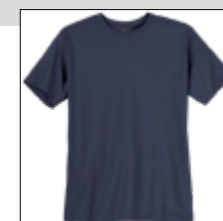
NOS RF 01 navy ID: 738

Style description: T-Shirt, O-Neck | Design: solid & melange Material: Jersey, 100% Cotton, antra. mel. 80% Cotton 20% Polyester einteilbare Größen: M-8XL, 10XL