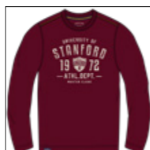
RF 76 barolo ID: 20966