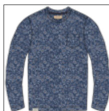
RF 189 dark denim ID: 21010