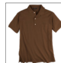
NOS RF 486 lavazza ID: 499