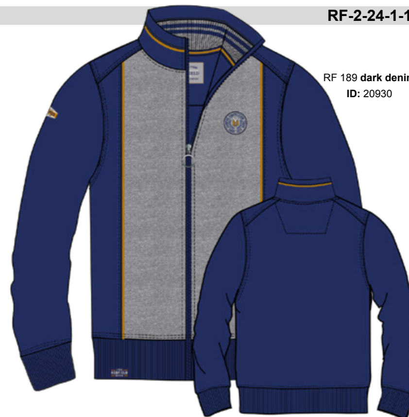
RF 189 dark denim ID: 20930