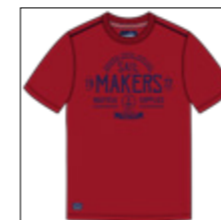
RF 229 hibiskus ID: 20863

Style description: T-Shirt 1/2 sleeve, O-Neck, center chest print