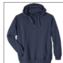
NOS RF 01 navy ID: 6774