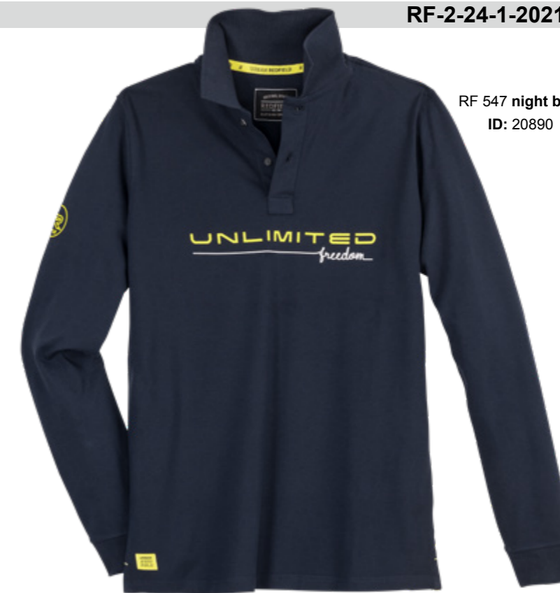
RF 547 night blue ID: 20890