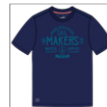
RF 547 night blue ID: 20861