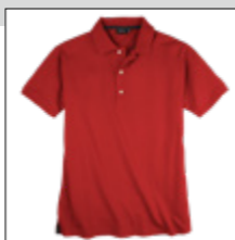
NOS RF 229 hibiskus ID: 10046

Style description: Polo Pique 1/2 sleeve | Design: solid Material: Pique, 95% Cotton 5% Elasthan einteilbare Größen: M-8XL, 10XL