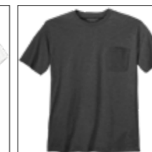
LOS RF 22 anthra. mel. ID: 10416