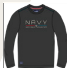
RF 15 black ID: 20842