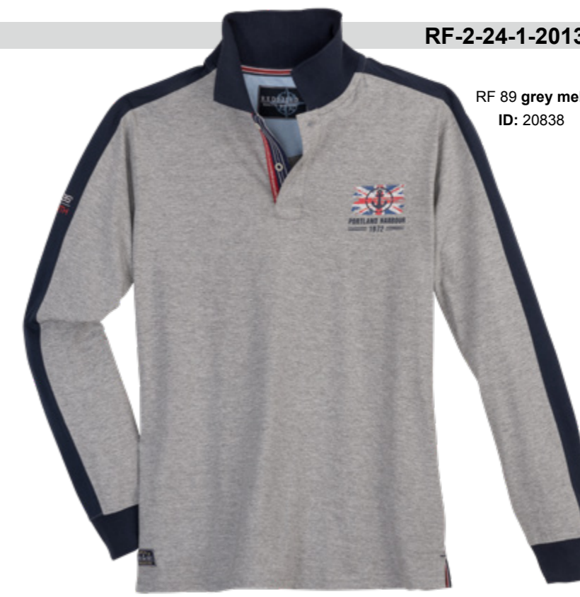
RF 89 grey mel. ID: 20838