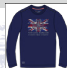
RF 547 night blue ID: 20851