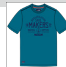
RF 219 pacific ID: 20862