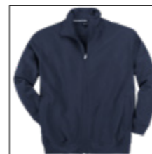
NOS RF 01 navy ID: 2525