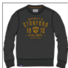
RF 15 black ID: 20926

Style description: Sweat-Shirt O-Neck, center chest print