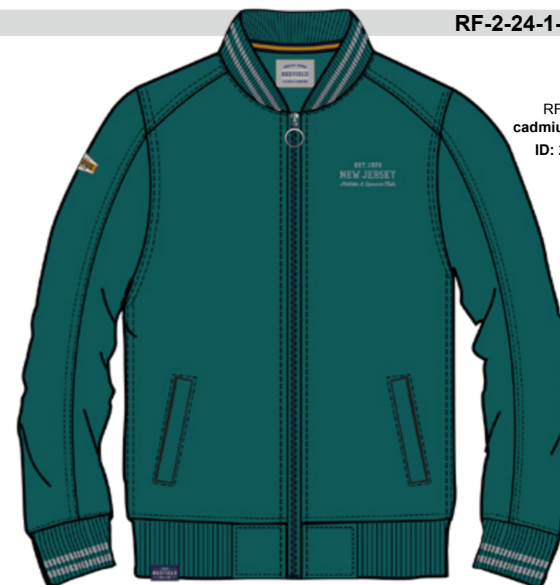
RF 855 cadmium green ID: 20928