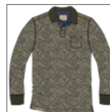
RF 27 khaki ID: 20984

Style description: Polo Jersey long sleeve with left chest pocket