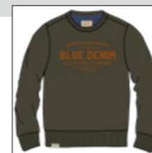
RF 27 khaki ID: 20910