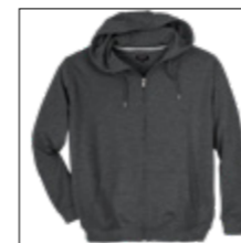
NOS RF 22 anthra. mel. ID: 3276