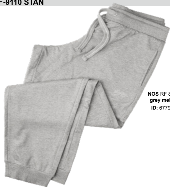
NOS RF 89 grey mel. ID: 6779