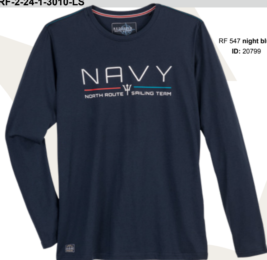
RF 547 night blue ID: 20799