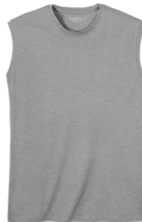
NOS RF 89 grey mel. ID: 2080