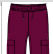
RF 17 dark grape ID: 20802