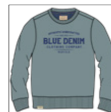
RF 23 winter sky ID: 20904