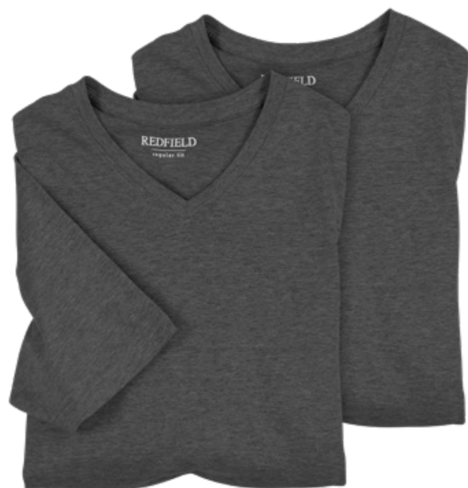
NOS RF 22 anthra. mel. ID: 11078