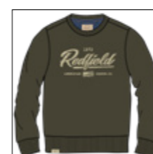
RF 27 khaki ID: 20933