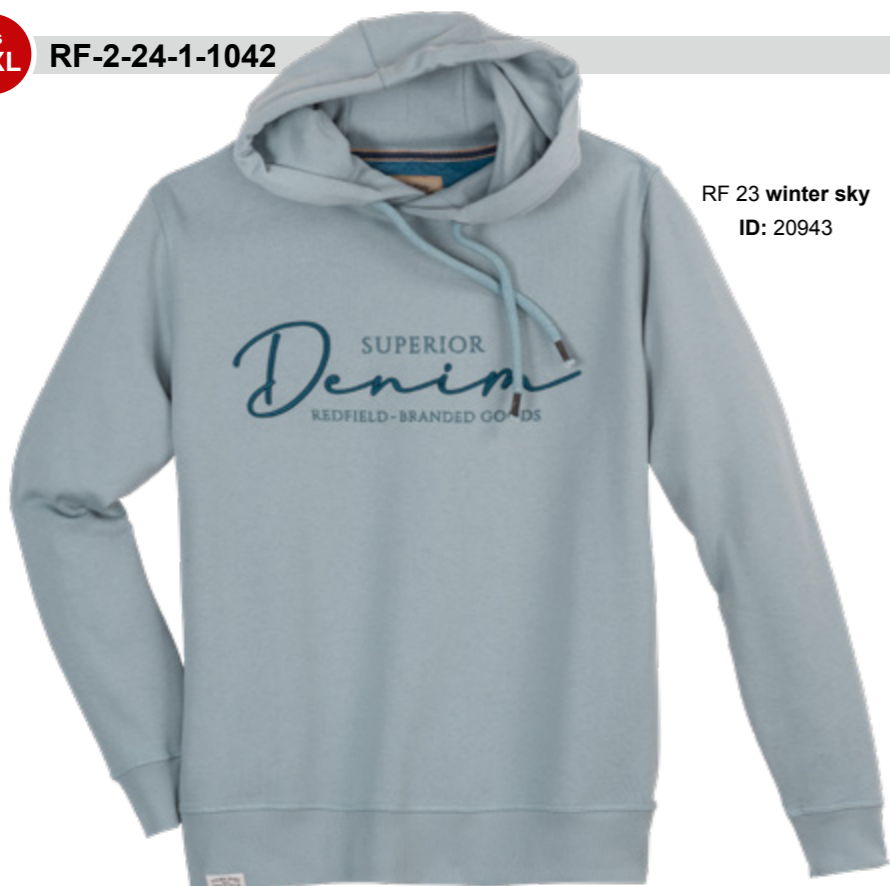
RF 23 winter sky ID: 20943