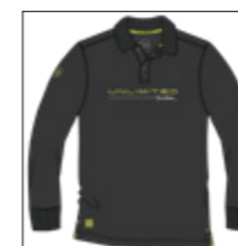
RF 15 black ID: 20891