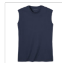
NOS RF 01 navy ID: 2072