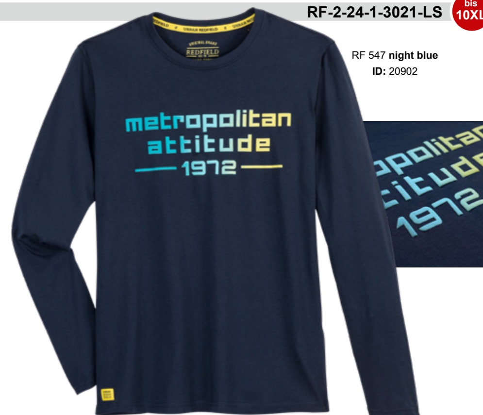
RF 547 night blue ID: 20902

Style description: T-Shirt long sleeve, O-Neck, high density center chest print