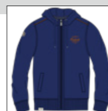
RF 189 dark denim ID: 20956