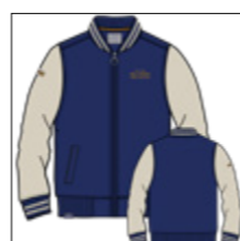
RF 189 dark denim ID: 20934

Style description: Sweat blouson Jacket with contrast sleeve, contrast tipping at collar and cuffs, two side pockets, left chest embro Material: Felpa fabric, 70% Cotton 30% Polyester | einteilbare Größen: M-8XL, 10XL