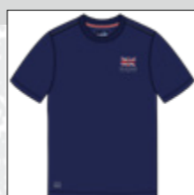
RF 547 night blue ID: 20865