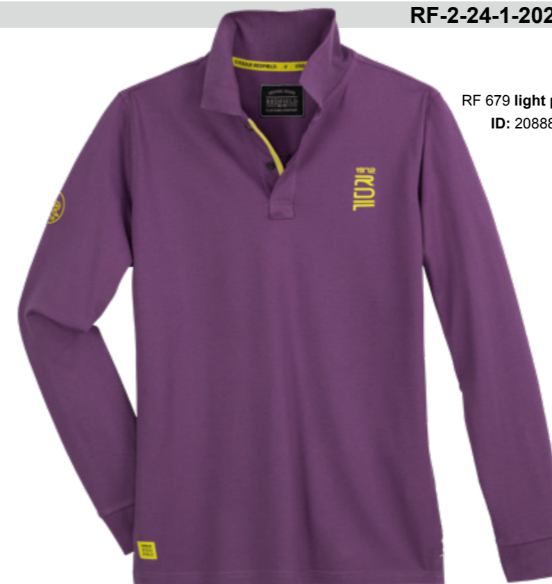
RF 679 light plum ID: 20888