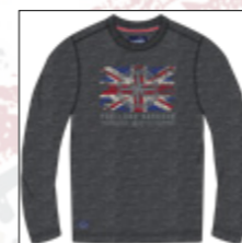
RF 716 iron mel. ID: 20852