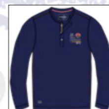
RF 547 night blue ID: 20854