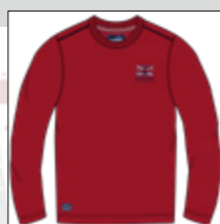
RF 229 hibiskus ID: 20850