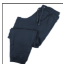
NOS RF 01 navy ID: 6940

Style description: Jogging Pants with ankle cuffs | Design: solid & melange Material: Felpa fabric, 70% Cotton 30% Polyester, anthra. mel. 80% Cotton 20% Polyester, grey mel. 85% Cotton 15% Viscose einteilbare Größen: M-8XL, 10XL