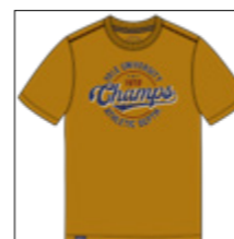
RF 19 rich yellow ID: 20976