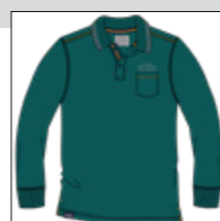
RF 855 cadmium green ID: 20940