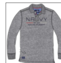
RF 89 grey mel. ID: 20835