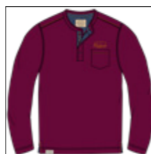
RF 17 dark grape ID: 21004