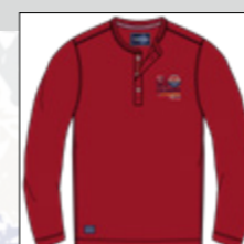
RF 229 hibiskus ID: 20857