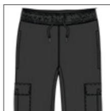
RF 15 black ID: 20801

Style description: Joggingpants with two Cargopockets and two side pockets