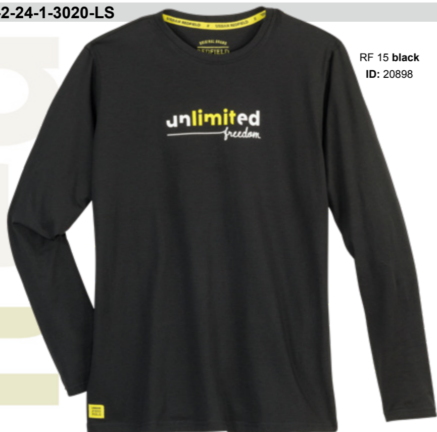
RF 15 black ID: 20898