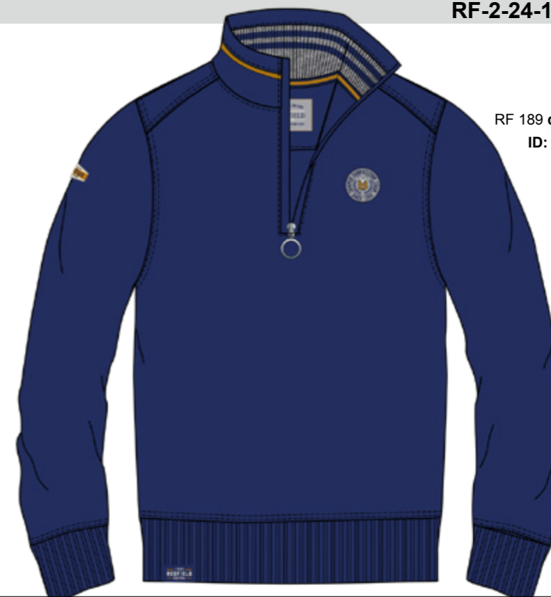
RF 189 dark denim ID: 20919

Style description: Troyer Sweat Shirt with left chest badge, right sleeve badge Material: Felpa fabric, 70% Cotton 30% Polyester, grey mel. 85% Cotton 15% Viscose einteilbare Größen: M-8XL, 10XL