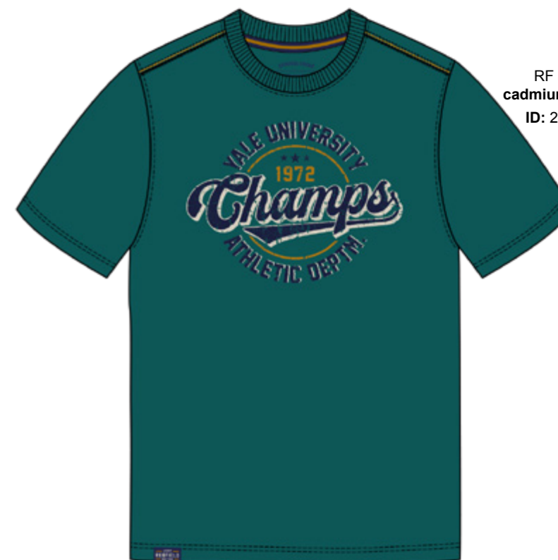
RF 855 cadmium green ID: 20977

Style description: T-Shirt 1/2 sleeve, O-Neck, center chest print