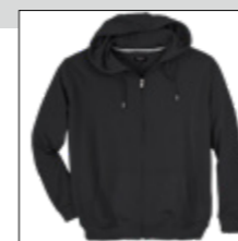
NOS RF 15 black ID: 710

Style description: Sweatshirt | Design: solid & melange Material: Felpa fabric, 70% Cotton 30% Polyester, anthra. mel. 80% Cotton 20% Polyester, grey mel. 85% Cotton 15% Viscose einteilbare Größen: M-8XL, 10XL