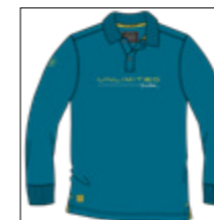
RF 219 pacific ID: 20892

Style description: Polo Pique long sleeve with center chest and right sleeve print in high density