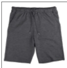
NOS RF 22 anthra. mel. ID: 5092

Style description: Felpa Shorts | Design: solid & melange