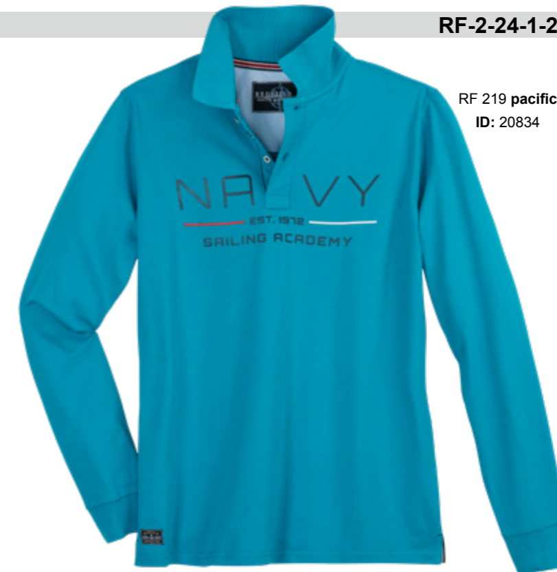
RF 219 pacific ID: 20834