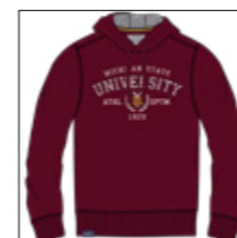
RF 76 barolo ID: 20915