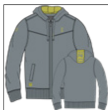
RF 20 cool grey ID: 20871