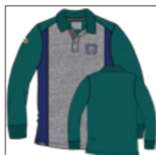
RF 855 cadmium green ID: 20957