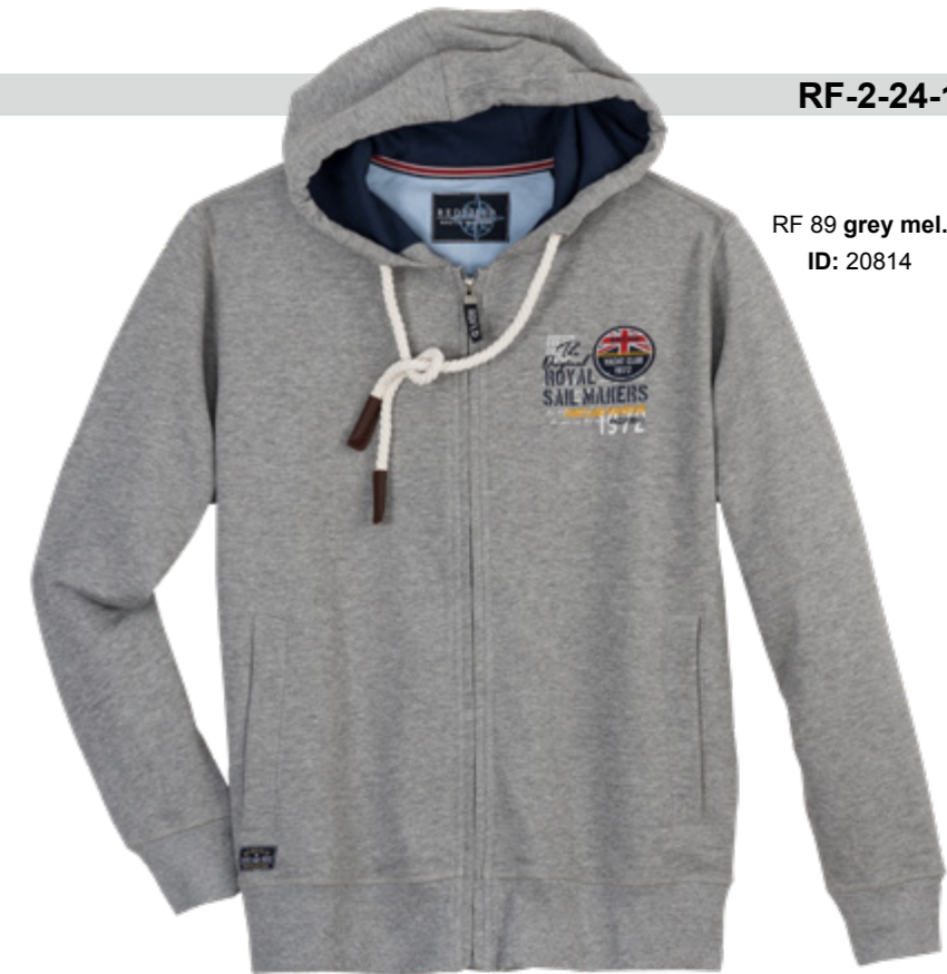
RF 89 grey mel. ID: 20814

Style description: Sweat Hoody Jacket with two side pocket, left chest badge, embro and print