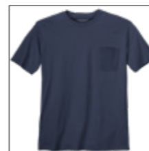
NOS RF 01 navy ID: 10047