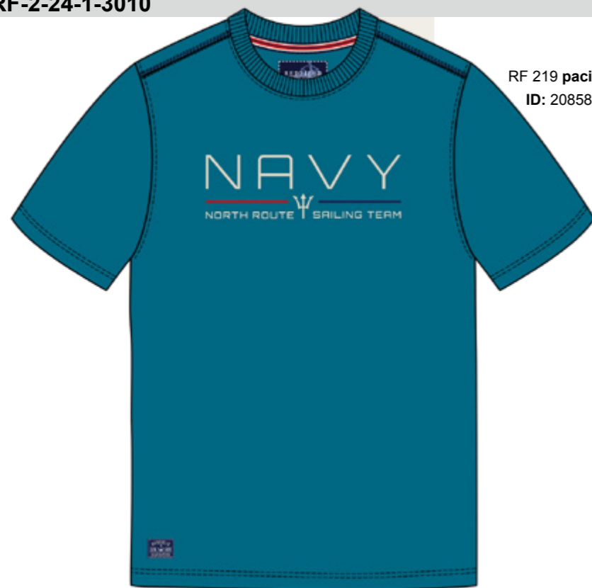
RF 219 pacific ID: 20858