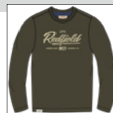
RF 27 khaki ID: 21001