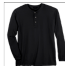
NOS RF 15 black ID: 8280