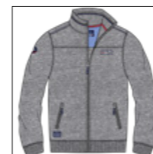
RF 89 grey mel. ID: 20810