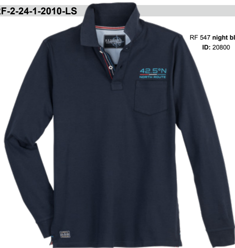
RF 547 night blue ID: 20800