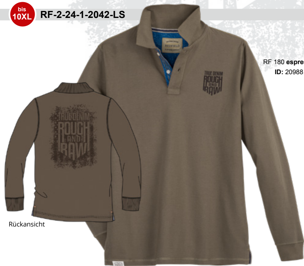
RF 180 espresso ID: 20988