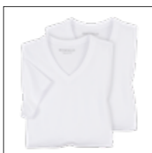
NOS RF 16 white ID: 4110

Style description: T-Shirt, V-Neck (double pack) | Design: solid & melange Material: Jersey, 100% Cotton, anthra. mel. 80% Cotton 20% Polyester, grey mel. 85% Cotton 15% Viscose einteilbare Größen: M-8XL, 10XL