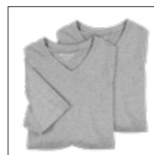
NOS RF 89 grey mel. ID: 8941