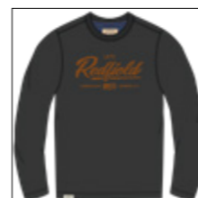
RF 15 black ID: 20999