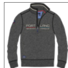
RF 716 iron mel. ID: 20825

Style description: Troyer Sweat Shirt with center chest print, right sleeve badge