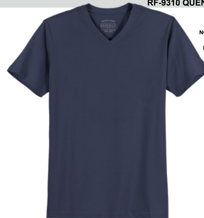
NOS RF 01 navy ID: 2518