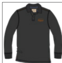
RF 15 black ID: 20963

Style description: Polo Pique long sleeve with left chest print