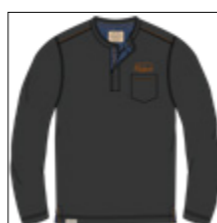
RF 15 black ID: 21003

Style description: T-Shirt long sleeve, serafino collar, left chest pocket and print