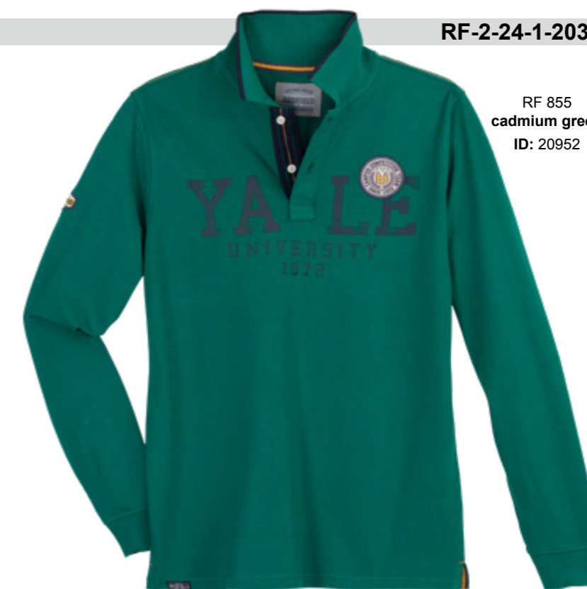
RF 855 cadmium green ID: 20952

Style description: Polo Pique long sleeve, collar contrast tipping with center chest print, left chest and sleeve badge Material: Pique 100% Cotton, grey mel. 85% Cotton 15% Viscose einteilbare Größen: M-8XL, 10XL