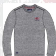
RF 89 grey mel. ID: 20849