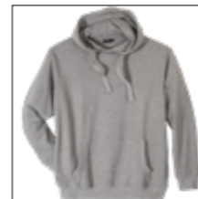
LOS RF 89 grey mel. ID: 6764

Style description: Sweat Hoody | Design: solid & melange