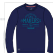
RF 547 night blue ID: 20843

Style description: T-Shirt long sleeve, O-Neck, center chest print