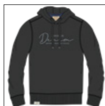
RF 15 black ID: 20939