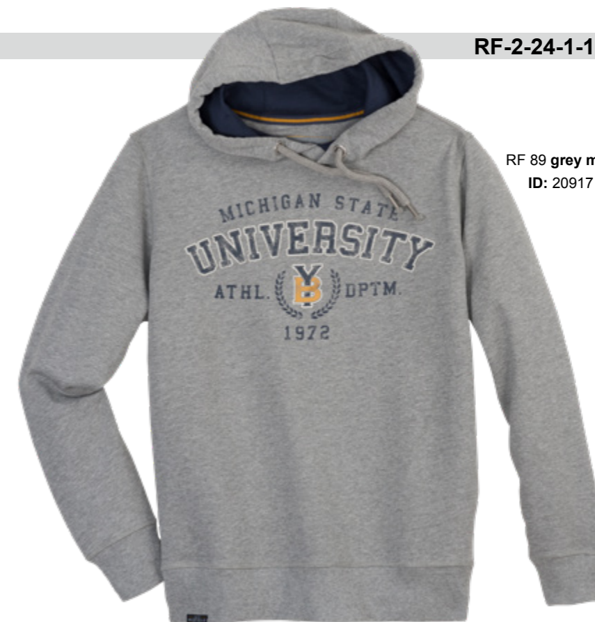
RF 89 grey mel. ID: 20917

Style description: Sweat Hoody with center chest print Material: Felpa fabric, 70% Cotton 30% Polyester, grey mel. 85% Cotton 15% Viscose einteilbare Größen: M-8XL, 10XL