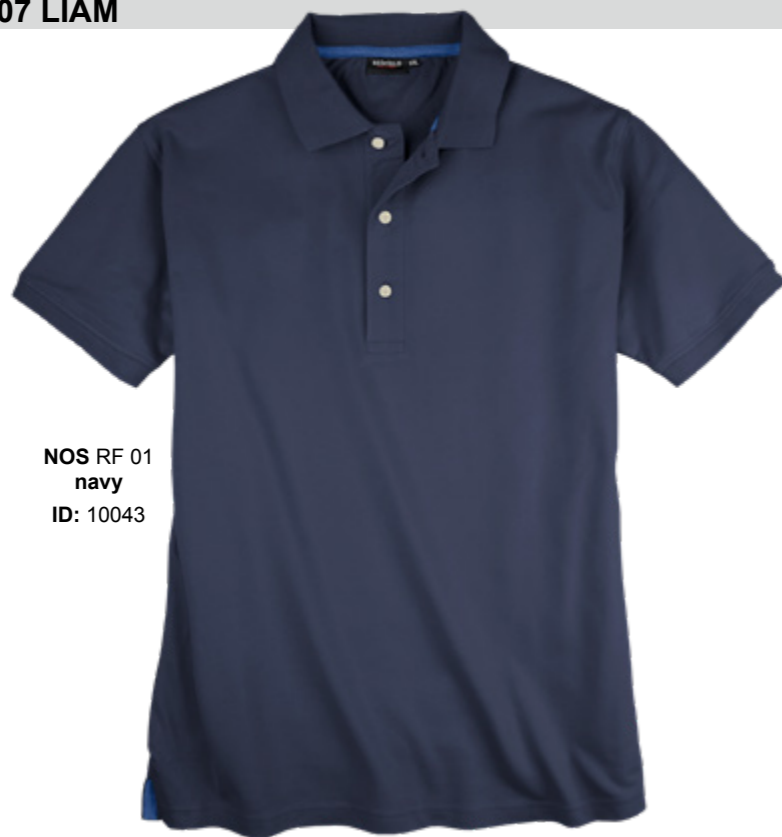
NOS RF 01 navy ID: 10043

Style description: Polo Pique 1/2 sleeve | Design: solid Material: Pique, 95% Cotton 5% Elasthan einteilbare Größen: M-8XL, 10XL