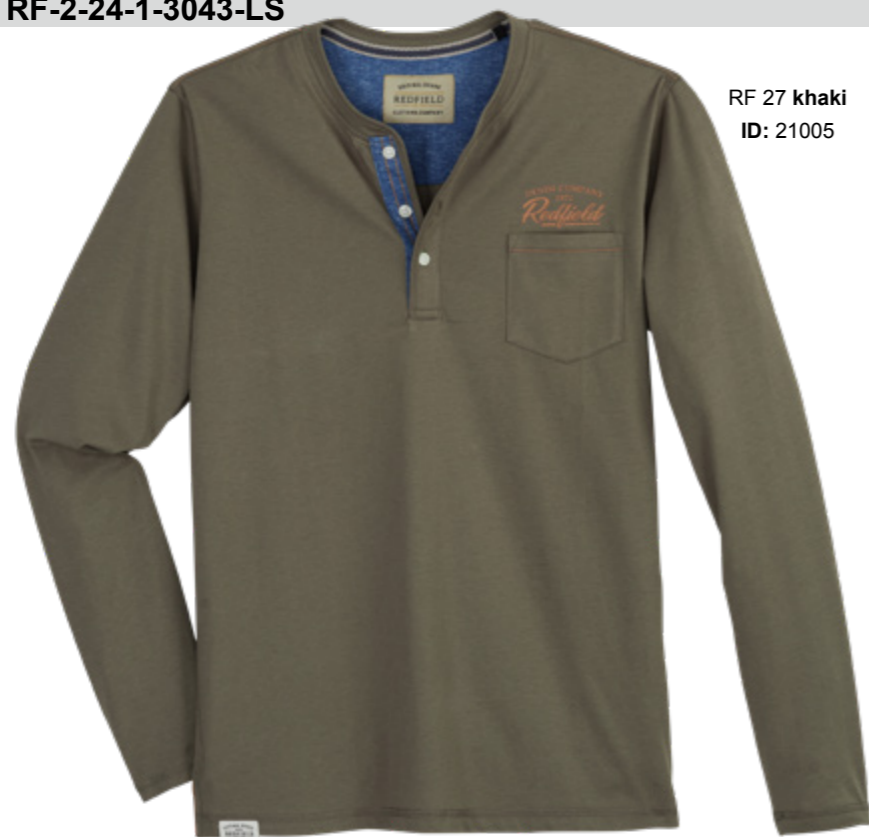
RF 27 khaki ID: 21005