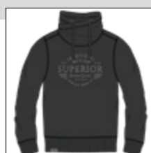
RF 15 black ID: 20945