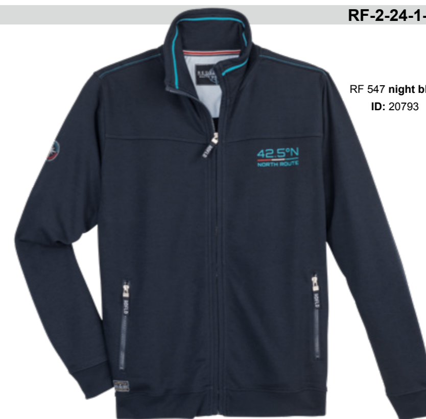
RF 547 night blue ID: 20793