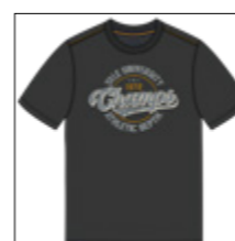
RF 15 black ID: 20978