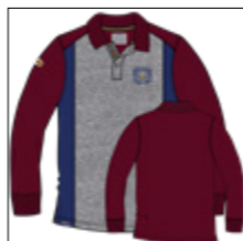
RF 76 barolo ID: 20955

Style description: Polo Jersey long sleeve with left chest print and badge, front insert in two contrast color, halfmoon in self fabric, right sleeve badge