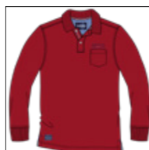
RF 229 hibiskus ID: 20828