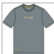
RF 20 cool grey ID: 20897