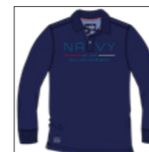
RF 547 night blue ID: 20833

Style description: Polo Pique long sleeve with center chest 4 color high density print, halfmoon in oxford fabric