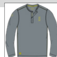
RF 20 cool grey ID: 20912