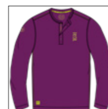
RF 679 light plum ID: 20909