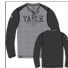
RF 15 black ID: 20974