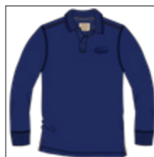
RF 189 dark denim ID: 20970