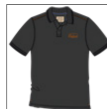
RF 15 black ID: 20795

Style description: Polo Pique 1/2 sleeve with left chest print