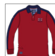
RF 229 hibiskus ID: 20839

Style description: Polo Jersey long sleeve with left chest high density and pigment print, collar, sleeve and houlder insert in contrast color, halfmoon and button placket in oxford fabric