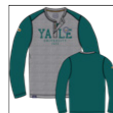
RF 855 cadmium green ID: 20973