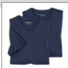
NOS RF 01 navy ID: 4108