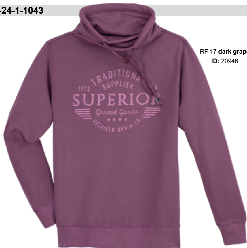
RF 17 dark grape ID: 20946