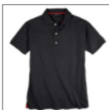
NOS RF 15 black ID: 10044