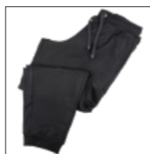
NOS RF 15 black ID: 6937