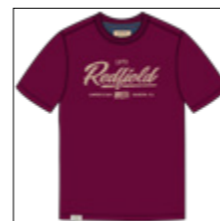
RF 17 dark grape ID: 21012