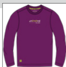
RF 679 light plum ID: 20899