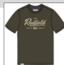
RF 27 khaki ID: 21013

Style description: T-Shirt long sleeve, O-Neck, center chest print Material: 100% Cotton single jersey einteilbare Größen: M-8XL, 10XL