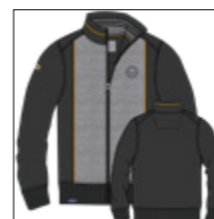
RF 15 black ID: 20932