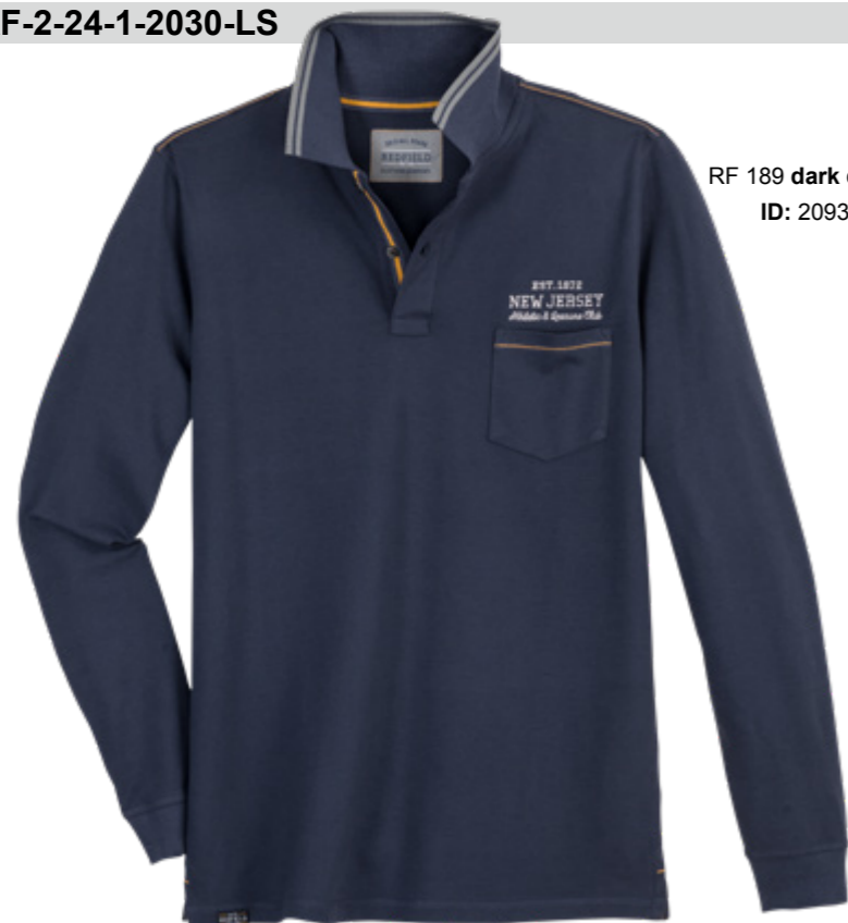
RF 189 dark denim ID: 20936