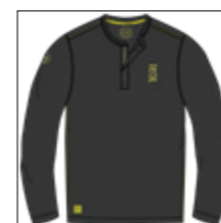
RF 15 black ID: 20907