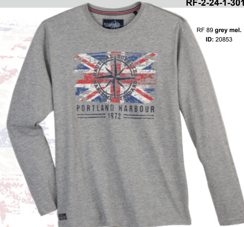
RF 89 grey mel. ID: 20853

Style description: T-Shirt long sleeve, O-Neck, center chest print