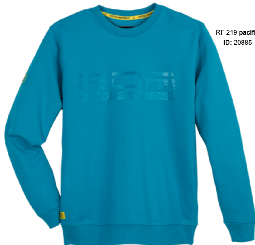
RF 219 pacific ID: 20885