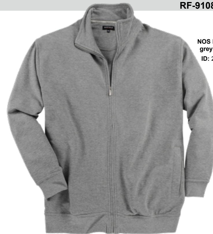
NOS RF 89 grey mel. ID: 2527