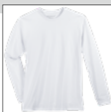
NOS RF 16 white ID: 4080