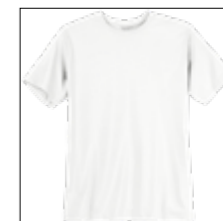
NOS RF 16 white ID: 740