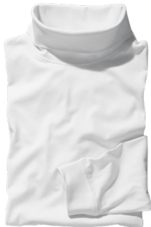
NOS RF 16 white ID: 3683