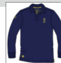
RF 547 night blue ID: 20886