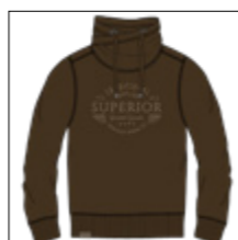
RF 180 espresso ID: 20960

Style description: Sweat turtle collar with center chest pigment prints