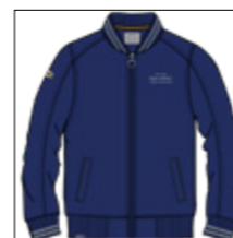
RF 189 dark denim ID: 20927

Style description: Sweat blouson Jacket, left chest embro, right sleeve badge, two side pocket