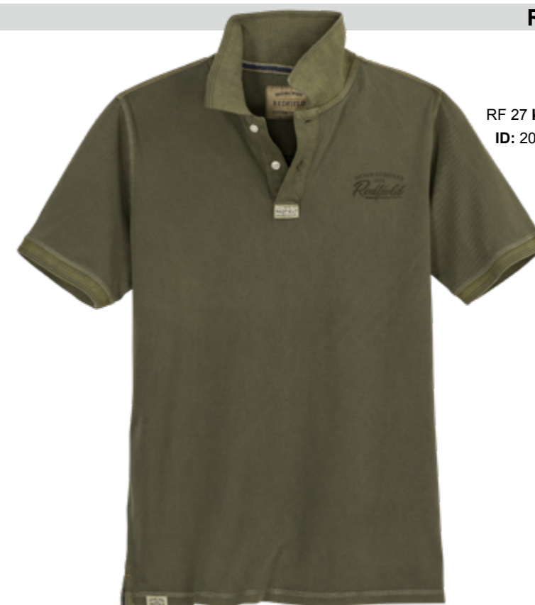
RF 27 khaki ID: 20796