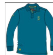
RF 219 pacific ID: 20889