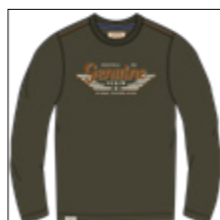
RF 27 khaki ID: 20997

Style description: T-Shirt long sleeve, O-Neck, center chest print Material: 100% Cotton single jersey, pigment garment dyed and garment washed einteilbare Größen: M-8XL