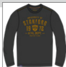
RF 15 black ID: 20969