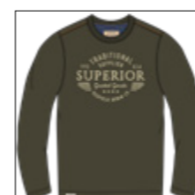
RF 27 khaki ID: 20992