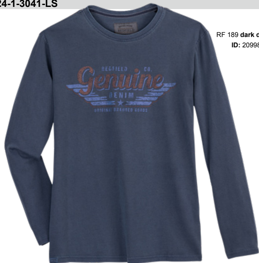
RF 189 dark denim ID: 20998