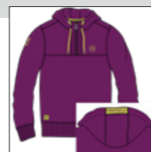
RF 679 light plum ID: 20876