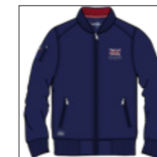
RF 547 night blue ID: 20815

Style description: Sweat blouson Jacket,