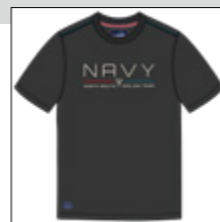
RF 15 black ID: 20860