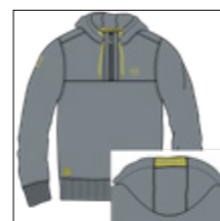
RF 20 cool grey ID: 20878