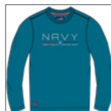
RF 219 pacific ID: 20840

Style description: T-Shirt long sleeve, O-Neck, high density center chest print