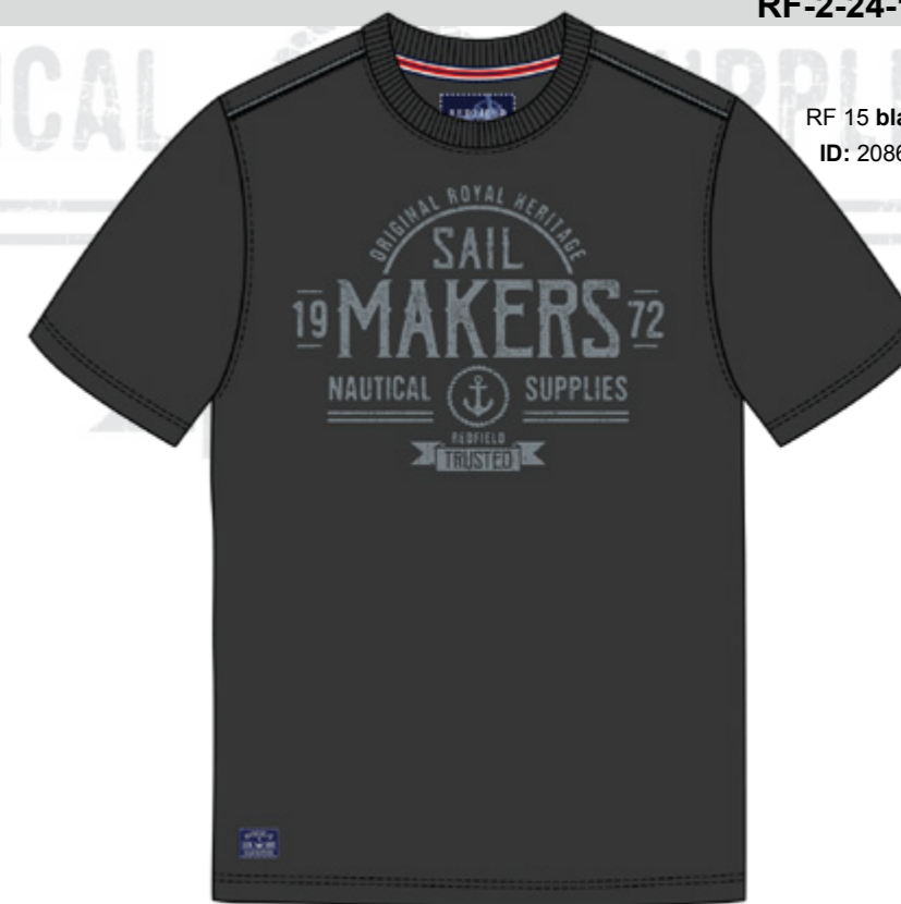
RF 15 black ID: 20864