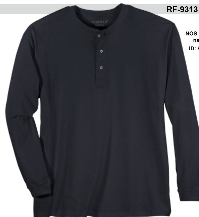
NOS RF 01 navy ID: 8281

Style description: Longsleeve Serafino T-Shirt | Design: solid & melange Material: Jersey, 100% Cotton, anthra. mel. 80% Cotton 20% Polyester einteilbare Größen: M-8XL, 10XL