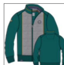
RF 855 cadmium green ID: 20931