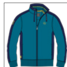
RF 219 pacific ID: 20873