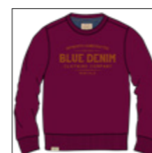
RF 17 dark grape ID: 20908