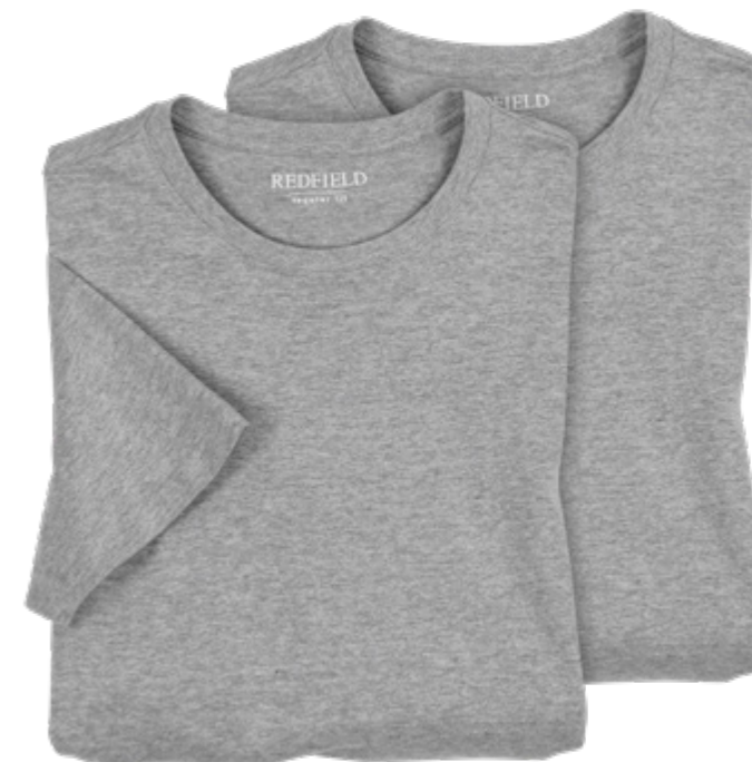
NOS RF 89 grey mel. ID: 574

Style description: T-Shirt, O-Neck (double pack) | Design: solid & melange Material: Jersey, 100% Cotton, antra. mel. 80% Cotton 20% Polyester, grey mel. 85% Cotton 15% Viscose einteilbare Größen: M-8XL, 10XL