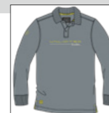
RF 20 cool grey ID: 20893