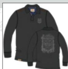
RF 15 black ID: 20986