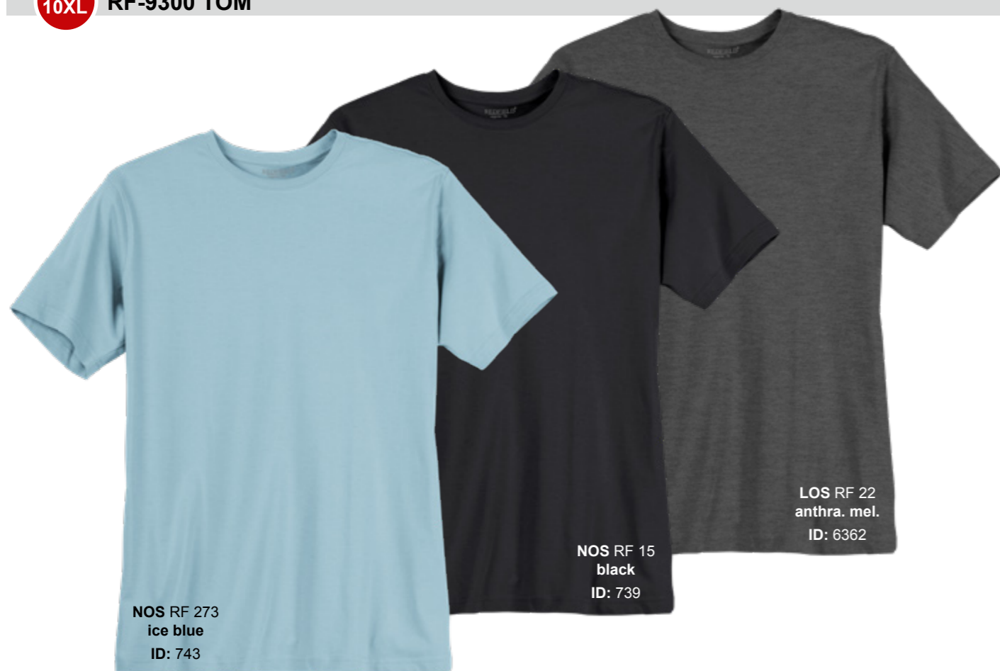
NOS RF 273 ice blue ID: 743