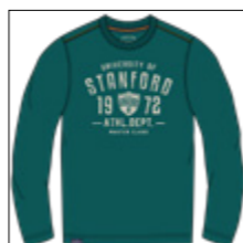
RF 855 cadmium green ID: 20968

Style description: T-Shirt long sleeve, O-Neck, center chest print