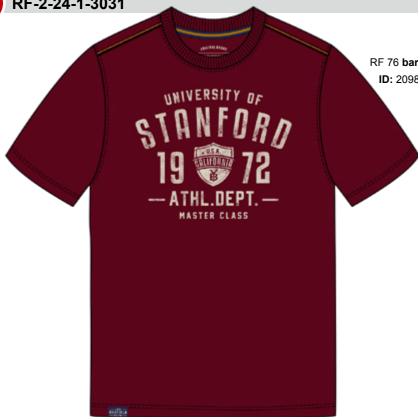
RF 76 barolo ID: 20980