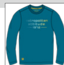
RF 219 pacific ID: 20906