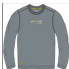
RF 20 cool grey ID: 20901