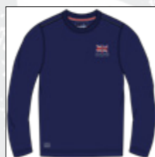
RF 547 night blue ID: 20847