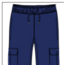
RF 189 dark denim ID: 20804