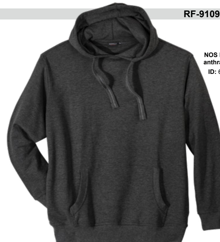
NOS RF 22 anthra mel. ID: 6765