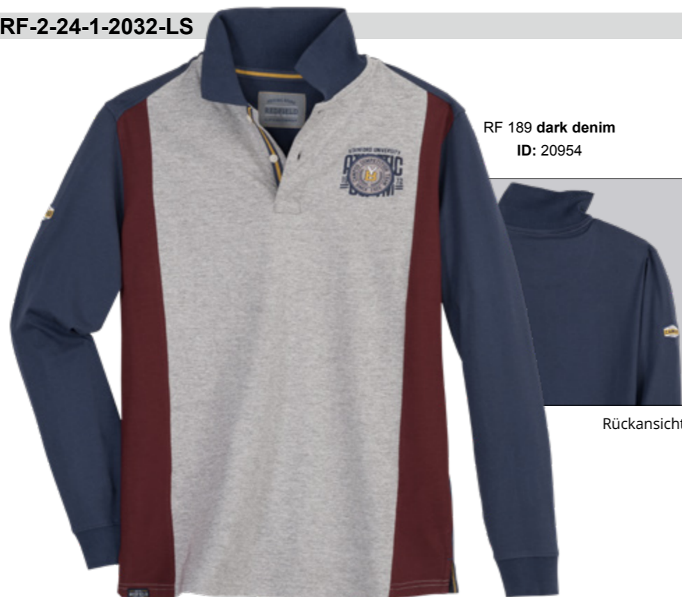
RF 189 dark denim ID: 20954