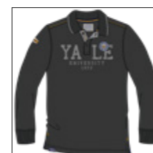
RF 15 black ID: 20953