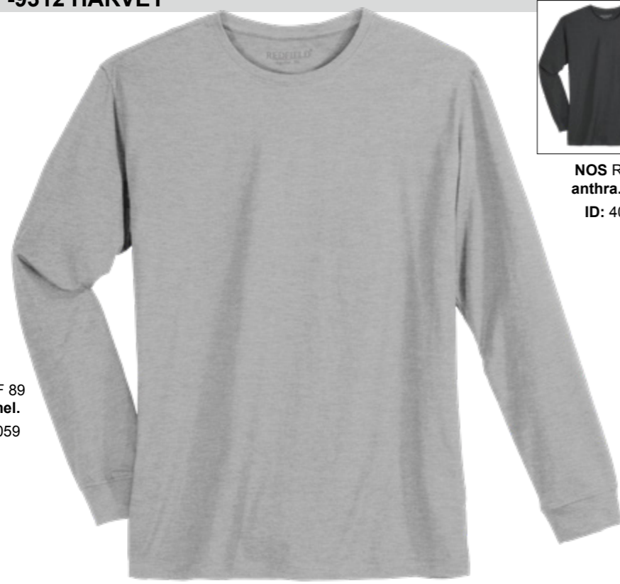
LOS RF 89 grey mel. ID: 21059

Style description: Longsleeve T-Shirt | Design: solid & melange Material: Jersey, 100% Cotton, anthra. mel. 80% Cotton 20% Polyester einteilbare Größen: M-8XL, 10XL