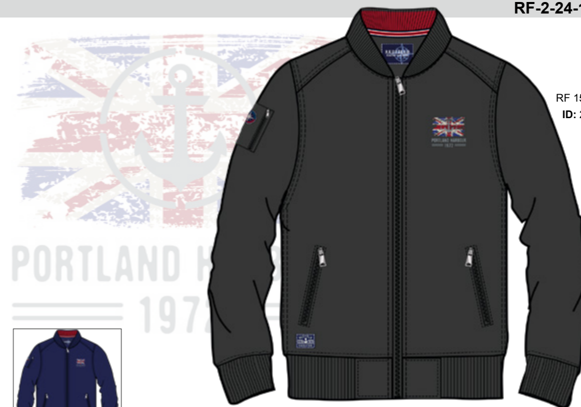
RF 15 black ID: 20817