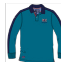
RF 219 pacific ID: 20837