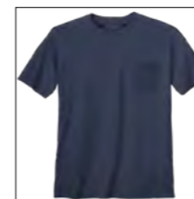
NOS RF 01 navy ID: 10047