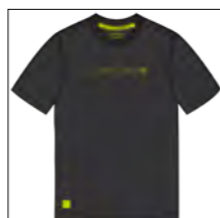
RF 15 black ID: 19742

Style description: T-Shirt 1/2 sleeve, O-Neck, single color center chest high density print