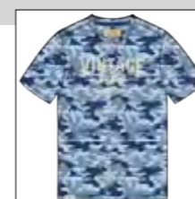
RF 189 dark denim ID: 19958