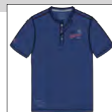
RF 189 dark denim ID: 19890