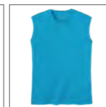
RF 333 gitane blue ID: 19693