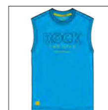
RF 333 gitane blue ID: 19847