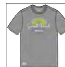
RF 759 dove grey ID: 19881