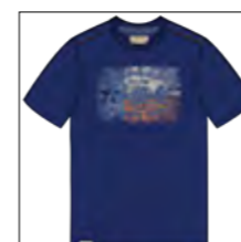
RF 189 dark denim ID: 19946