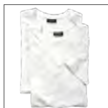
NOS RF 16 white ID: 4110

Style description: T-Shirt, V-Neck (double pack) | Design: solid & melange Material: Jersey, 100% Cotton, anthra. mel. 80% Cotton 20% Polyester, grey mel. 85% Cotton 15% Viscose einteilbare Größen: M-8XL, 10XL