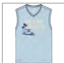
RF 273 ice blue ID: 19912

Style description: T-Shirt sleeveless, V-Neck, two color center chest print