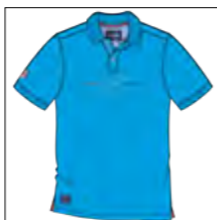
RF 333 gitane blue ID: 19762