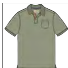
RF 29 oliv ID: 19914