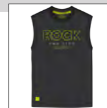
RF 15 black ID: 19845