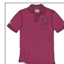
RF 13 summer grape ID: 19876