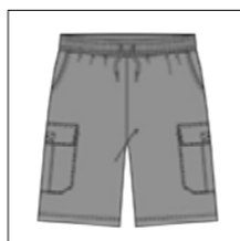
RF 759 dove grey ID: 19926

Style description: Cargo Sweat Shorts with draw string waistband