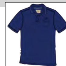
RF 189 dark denim ID: 19869