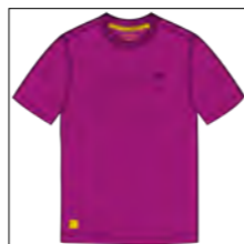
RF 279 lila ID: 19745