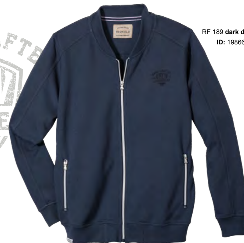
RF 189 dark denim ID: 19866

Style description: Sweat-Jacket with two zipper side pockets and left chest print