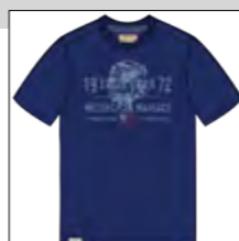
RF 189 dark denim ID: 19929