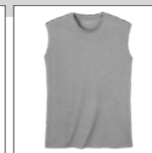
NOS RF 89 grey mel. ID: 2080