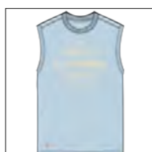
RF 273 ice blue ID: 19915

Style description: T-Shirt sleeveless, O-Neck, center chest print