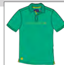
RF 11 pool green ID: 19729