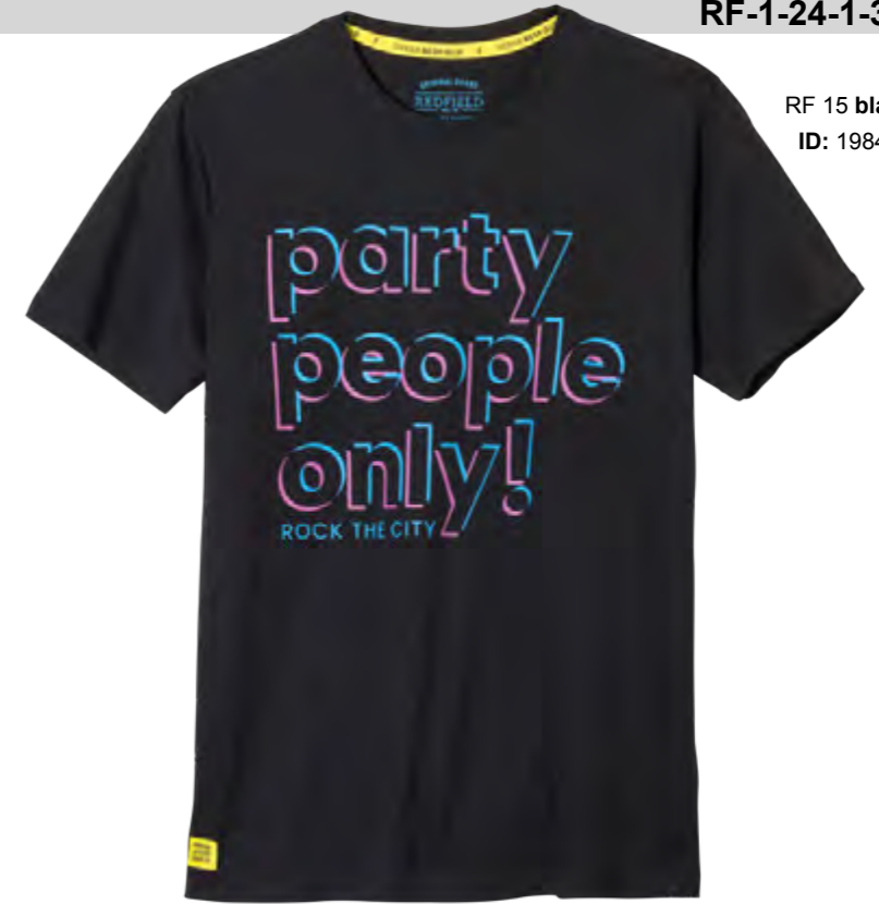
RF 15 black ID: 19842

Style description: T-Shirt 1/2 sleeve, O-Neck, two color center chest print