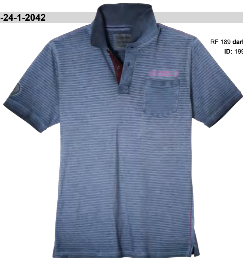
RF 189 dark denim ID: 19913