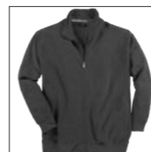
NOS RF 22 anthra. mel. ID: 5204

Style description: Troyer Sweat Jacket | Design: solid & melange