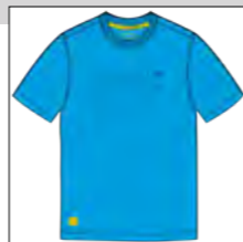
RF 333 gitane blue ID: 19744