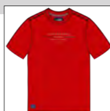
RF 631 paprika ID: 19789