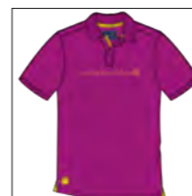
RF 279 illa ID: 19731