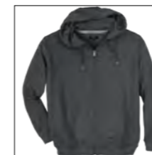
NOS RF 22 anthra. mel. ID: 3276