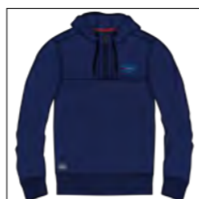
RF 547 night blue ID: 19753

Style description: Sweat Hoody with zipper and left chest high density prints