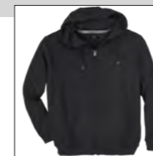
NOS RF 15 black ID: 710

Style description: Sweatshirt | Design: solid & melange Material: Felpa fabric, 70% Cotton 30% Polyester, anthra. mel. 80% Cotton 20% Polyester, grey mel. 85% Cotton 15% Viscose einteilbare Größen: M-8XL, 10XL