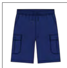
RF 189 dark denim ID: 19921