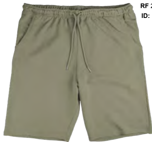
RF 29 oliv ID: 19678