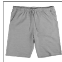
NOS RF 89 grey mel. ID: 1971