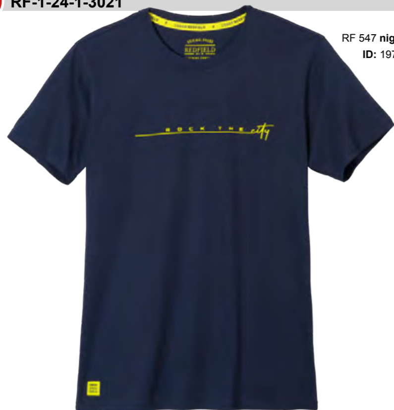
RF 547 night blue ID: 19743