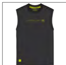
RF 15 black ID: 19851

Style description: T-Shirt sleeveless, O-Neck, single color center chest high density print