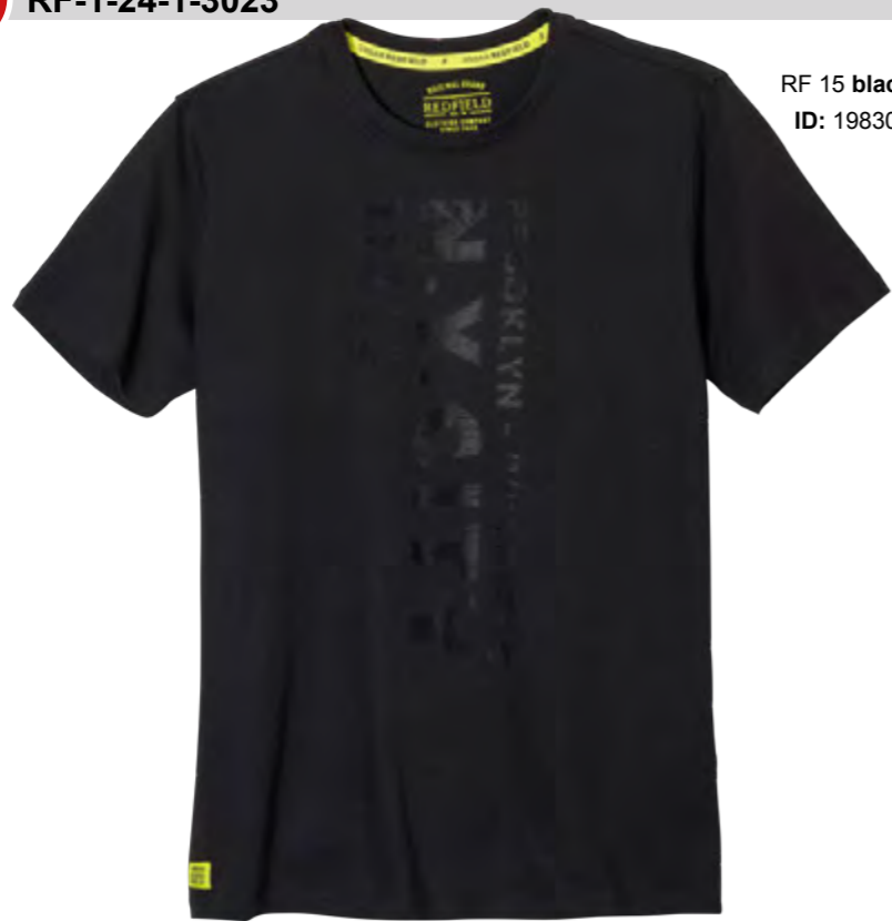
RF 15 black ID: 19830