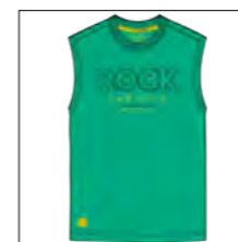
RF 11 pool green ID: 19846