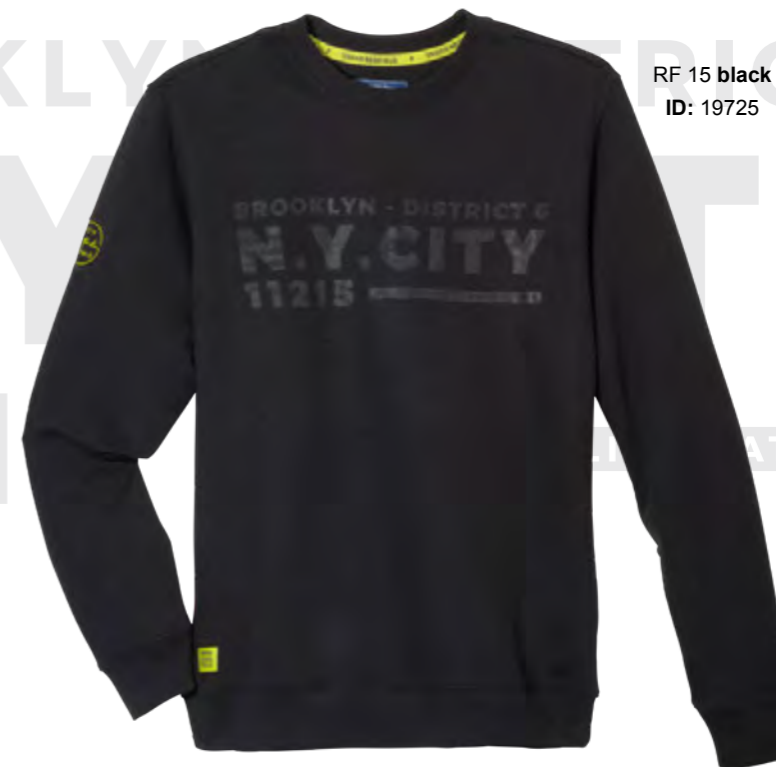
RF 15 black ID: 19725

BROOKLYN - DISTRICT 6 N.Y.CITY 11215 ATTITUDE