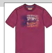
RF 13 summer grape ID: 19949