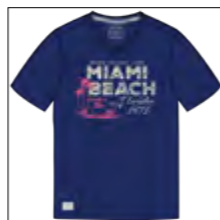
RF 189 dark denim ID: 19883