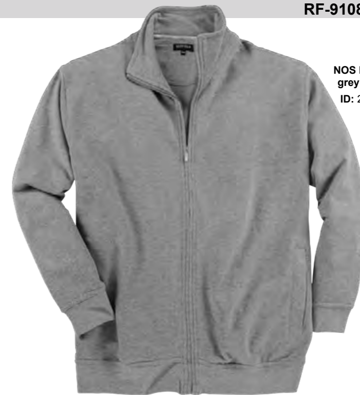
NOS RF 89 grey mel. ID: 2527