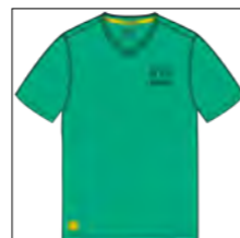
RF 11 pool green ID: 19839

Style description: T-Shirt 1/2 sleeve, V-Neck, single color left chest print