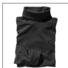
NOS RF 15 black ID: 354