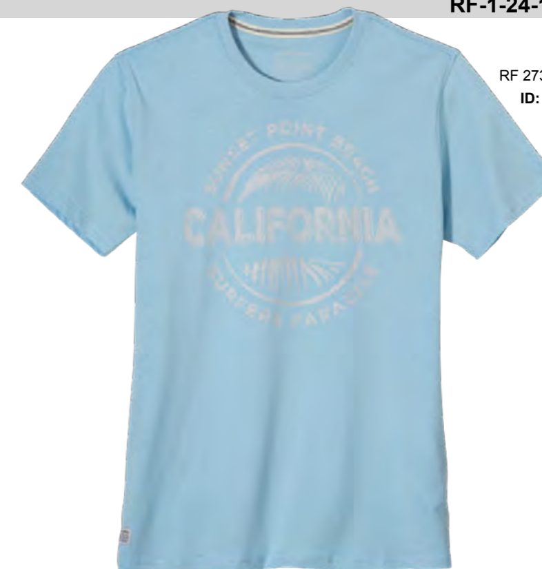
RF 273 ice blue ID: 19902