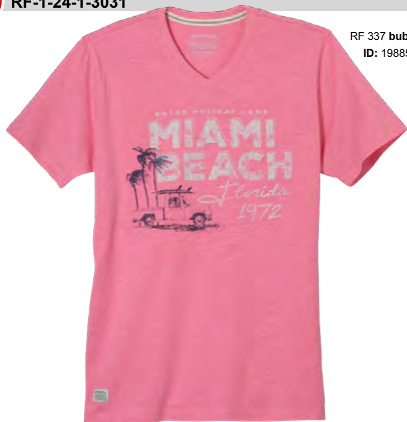
RF 337 bubble ID: 19885