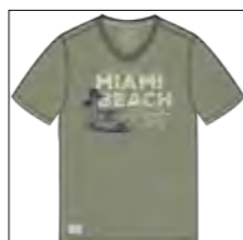
RF 29 oliv ID: 19884

Style description: T-Shirt 1/2 sleeve, V-Neck, two color center chest print