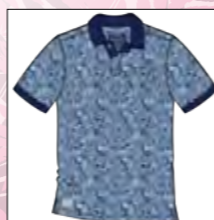
RF 189 dark denim ID: 19849

Style description: Polo jersey with digital all-over flowerprint, left chest pocket and right sleeve badge Material: Single Jersey, 100% Cotton einteilbare Größen: M-8XL, 10XL