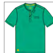
RF 11 pool green ID: 19747