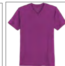
RF 279 lila ID: 19696