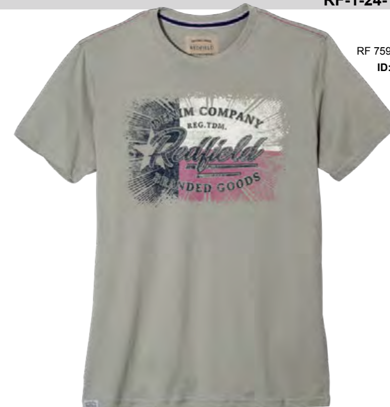
RF 759 dove grey ID: 19948

Style description: T-Shirt 1/2 sleeve, O-Neck, 3 color front print