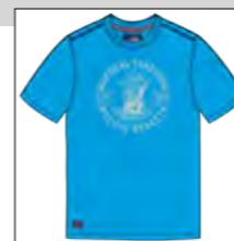
RF 333 gitane blue ID: 19768