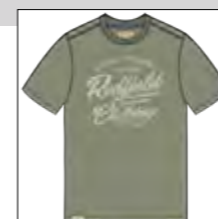
RF 29 oliv ID: 19939

Style description: T-Shirt 1/2 sleeve, O-Neck, 3 color front print Material: Single Jersey, 100% Cotton einteilbare Größen: M-8XL, 10XL