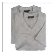
NOS RF 89 grey mel. ID: 8941