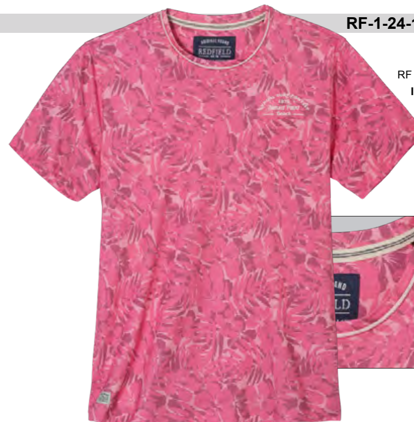
RF 337 bubble ID: 19889

Style description: T-Shirt 1/2 sleeve, O-Neck with rolling edges,