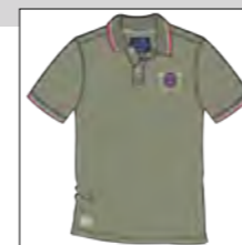
RF 29 oliv ID: 19826