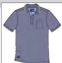
RF 547 night blue ID: 19765

Style description: Polo Pique 1/2 sleeve with chest pocket and left chest embro, collar and cuff tipping, halfmoon and button placket in oxford fabric