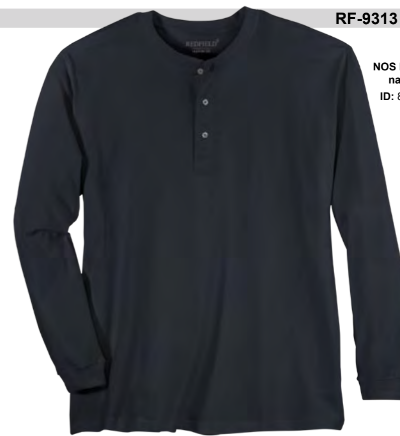
NOS RF 01 navy ID: 8281

Style description: Longsleeve Serafino T-Shirt | Design: solid & melange Material: Jersey, 100% Cotton, anthra. mel. 80% Cotton 20% Polyester einteilbare Größen: M-8XL, 10XL