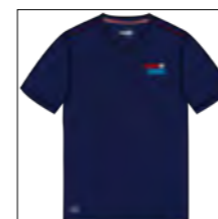
RF 547 night blue ID: 19778