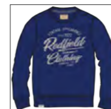
RF 189 dark denim ID: 19863