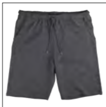
NOS RF 22 anthra. mel. ID: 5092

Style description: Felpa Shorts | Design: solid & melange