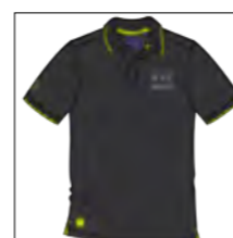
RF 15 black ID: 19732