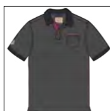
RF 15 black ID: 19919

Style description: Polo jersey with left chest embro and pocket, right sleeve badge Material: Jersey structure stripe, garment cold dyed & garment washed, 100% Cotton einteilbare Größen: M-8XL