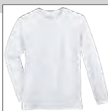
NOS RF 16 white ID: 4080

Style description: Longsleeve T-Shirt | Design: solid & melange Material: Jersey, 100% Cotton, anthra. mel. 80% Cotton 20% Polyester einteilbare Größen: M-8XL, 10XL