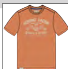
RF 12 light rosewood ID: 19942