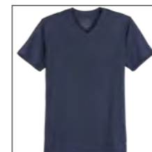
NOS RF 01 navy ID: 2518