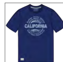
RF 189 dark denim ID: 19900