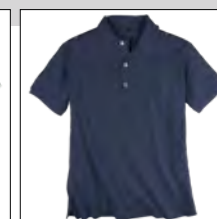
NOS RF 01 navy ID: 320