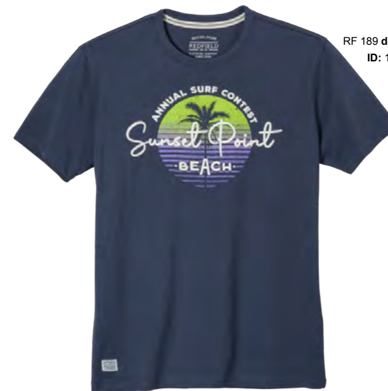
RF 189 dark denim ID: 19879

Style description: T-Shirt 1/2 sleeve, O-Neck, 3 color center chest print Material: Single Jersey, 100% Cotton einteilbare Größen: M-8XL, 10XL