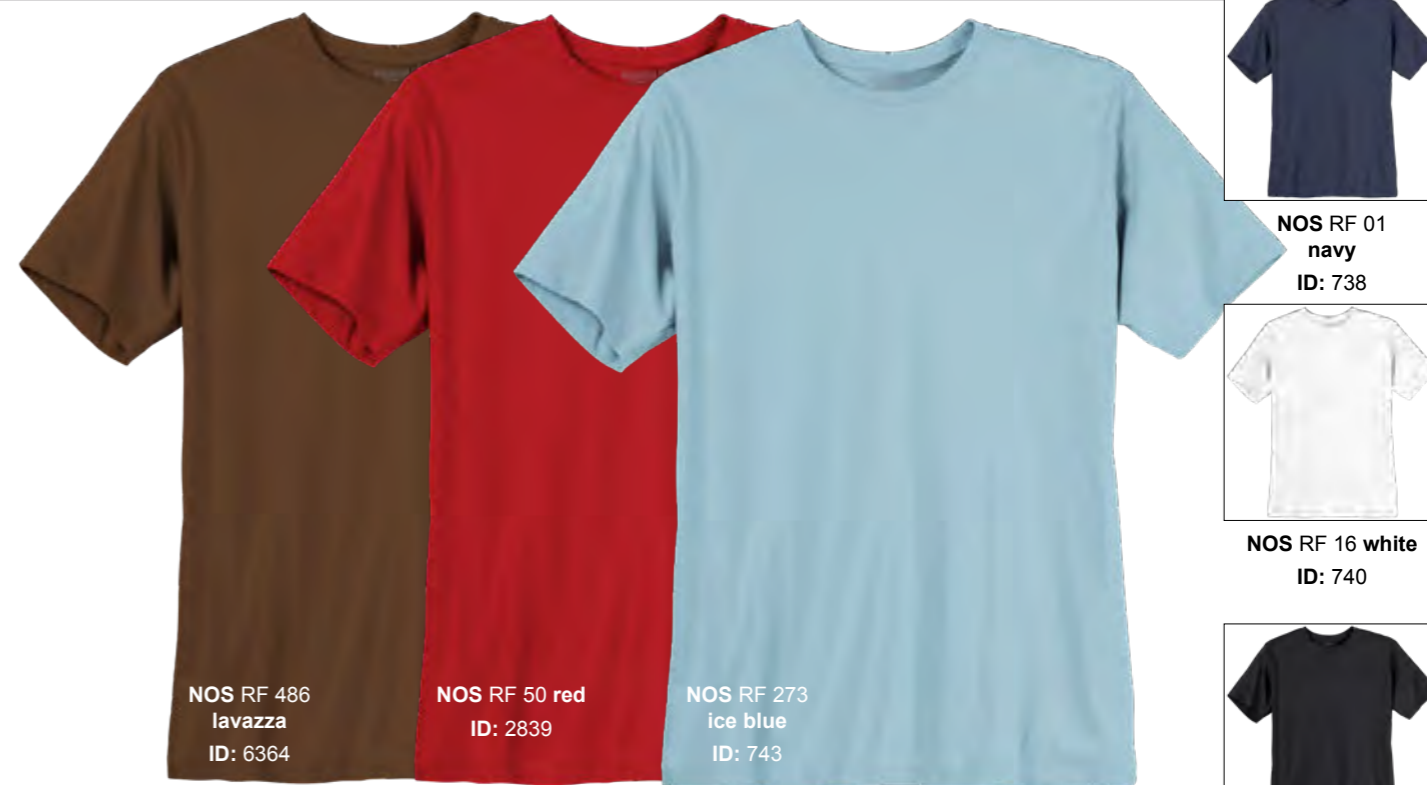
NOS RF 486 lavazza ID: 6364