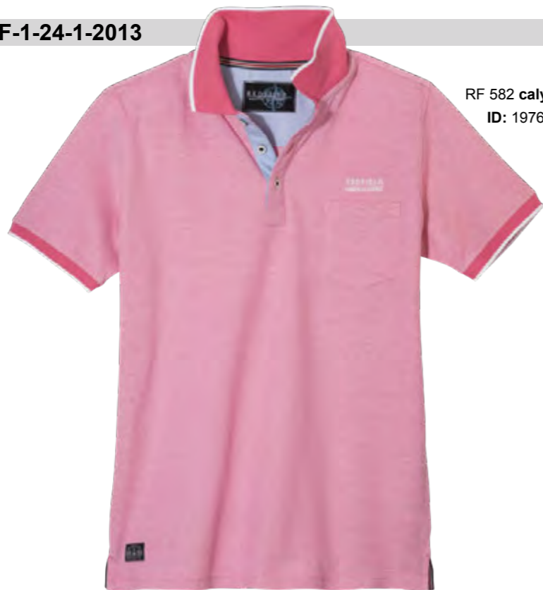
RF 582 calypso ID: 19766