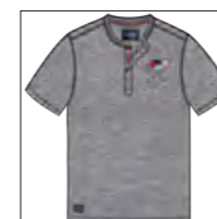
RF 89 grey mel. ID: 19783

Style description: T-Shirt 1/2 sleeve, serafino collar, 3 color left chest print with embro and badge Material: Single Jersey, 100% Cotton; grey mel. 85% Cotton 15% Viscose einteilbare Größen: M-8XL, 10XL