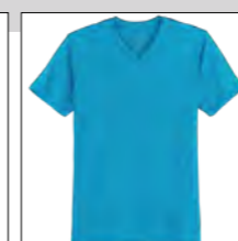
RF 333 gitane blue ID: 19697