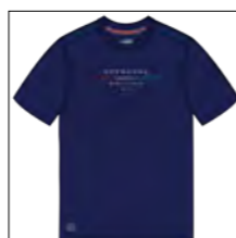
RF 547 night blue ID: 19788