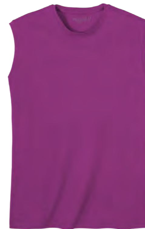
RF 279 lila ID: 19692

Style description: Muscleshirt | Design: solid & melange Material: Jersey, 100% Cotton, grey mel. 85% Cotton 15% Viscose einteilbare Größen: M-8XL, 10XL