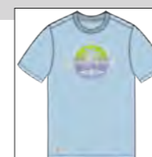
RF 273 ice blue ID: 19880