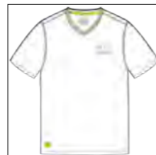
RF 16 white ID: 19838