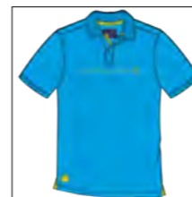
RF 333 gitane blue ID: 19730