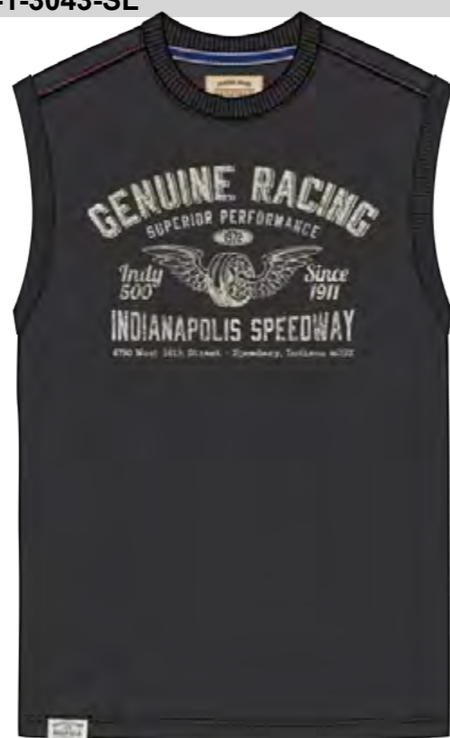
RF 15 black ID: 19928