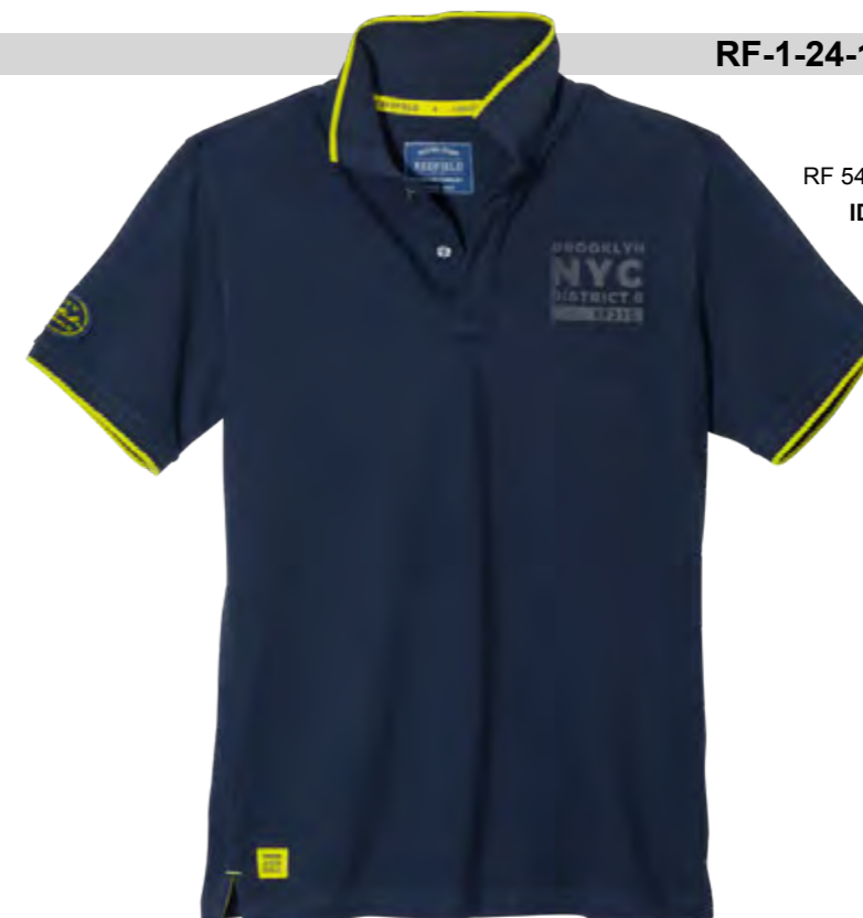
RF 547 night blue ID: 19735

Style description: Polo Pique 1/2 sleeve with left chest print, collar and cuff ribs with contrast tipping, right sleeve badge