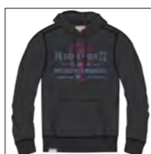
RF 15 black ID: 19862

Style description: Sweat Hoody, with color center chest print,