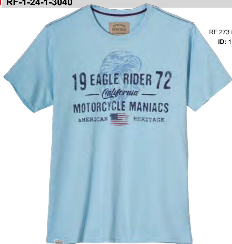
RF 273 ice blue ID: 19930