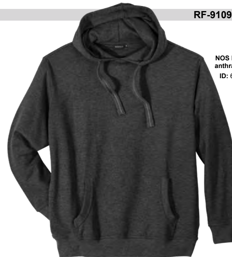
NOS RF 22 anthra mel. ID: 6765