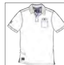
RF 16 white ID: 19757