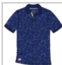
RF 189 dark denim ID: 19856