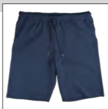
NOS RF 01 navy ID: 1969