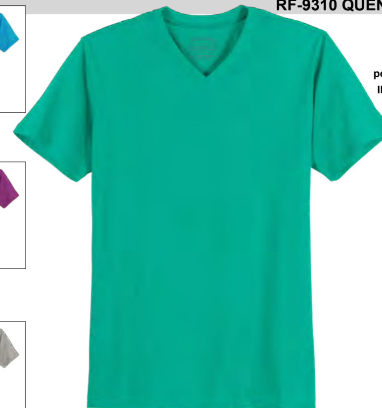
RF 11 pool green ID: 19698

Style description: T-Shirt, V-Neck | Design: solid Material: Jersey, 100% Cotton einteilbare Größen: M-8XL, 10XL