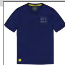
RF 547 night blue ID: 19840