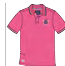
RF 337 bubble ID: 19827