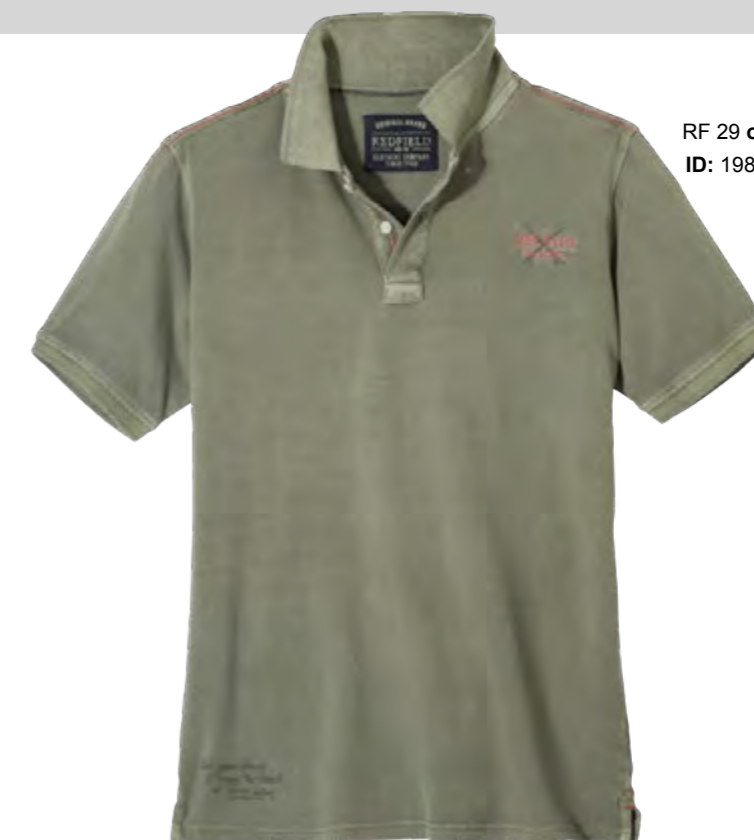
RF 29 oliv ID: 19833

Style description: Polo Pique 1/2 sleeve with left chest print and embro