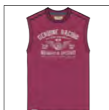
RF 13 summer grape ID: 19924

Style description: T-Shirt sleeveless, O-Neck, single color front print