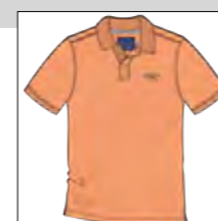
RF 862 light melba ID: 19848