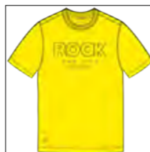
RF 595 sundance ID: 19741

Style description: T-Shirt 1/2 sleeve, O-Neck, two color center chest high density print