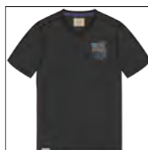
RF 15 black ID: 19953