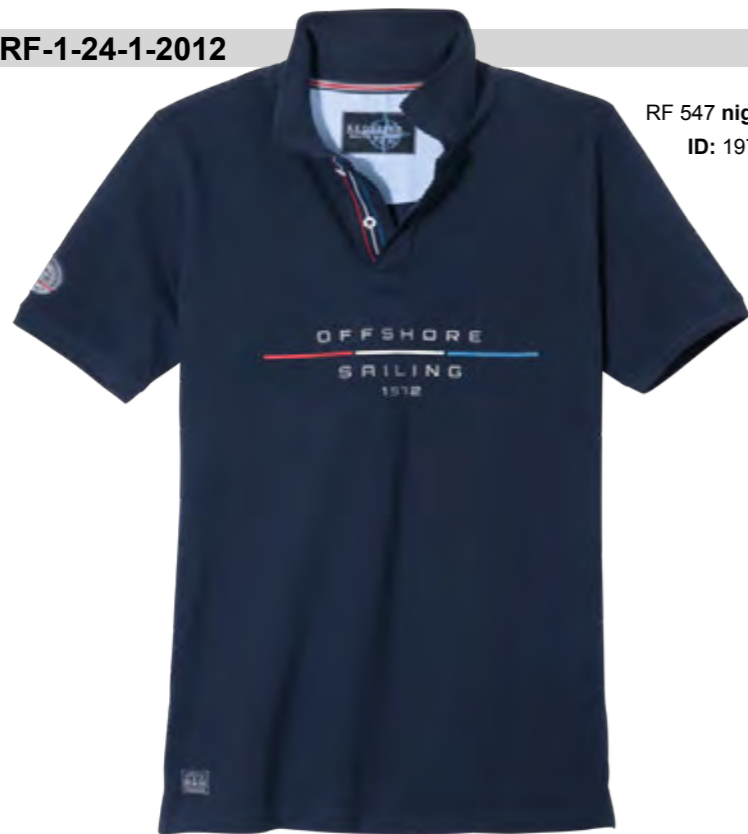
RF 547 night blue ID: 19761