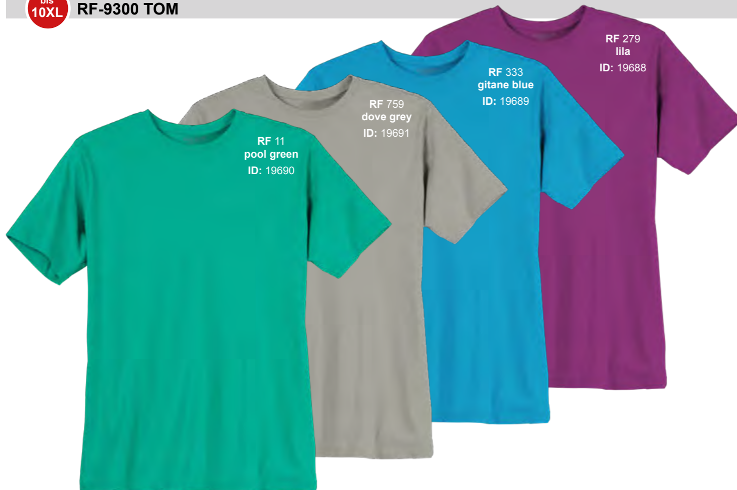
RF 11 pool green ID: 19690