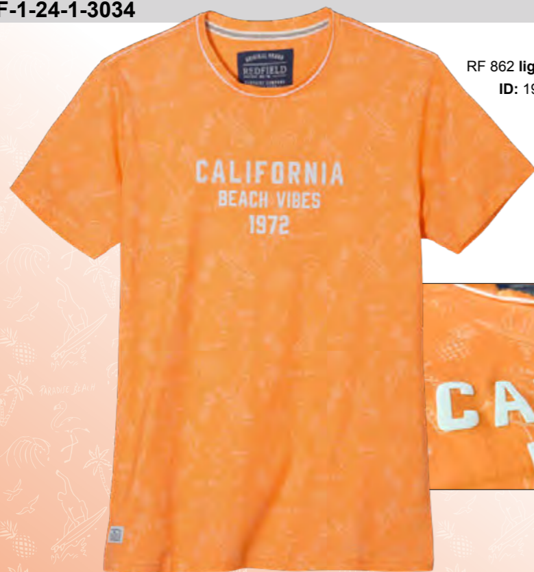
RF 862 light melba ID: 19897