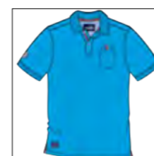
RF 333 gitane blue ID: 19756