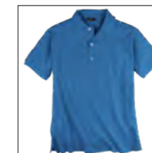
NOS RF 551 dark azur ID: 319