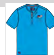
RF 333 gitane blue ID: 19784