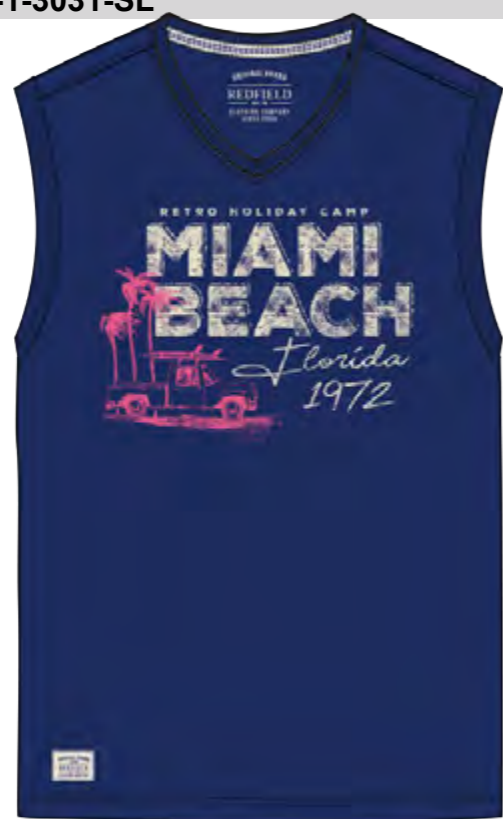
RF 189 dark denim ID: 19909