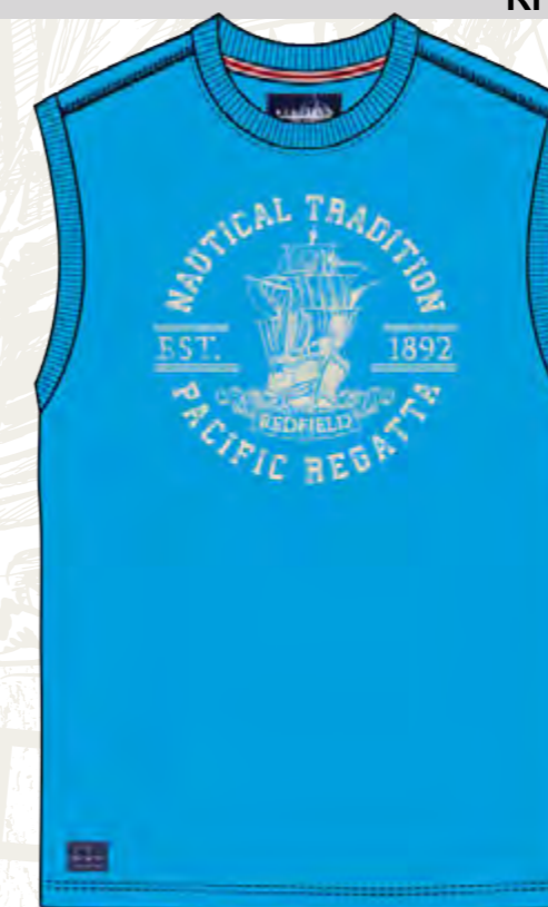
RF 333 gitane blue ID: 19799