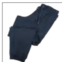
NOS RF 01 navy ID: 6940

Style description: Jogging Pants with ankle cuffs | Design: solid & melange Material: Felpa fabric, 70% Cotton 30% Polyester, anthra. mel. 80% Cotton 20% Polyester, grey mel. 85% Cotton 15% Viscose einteilbare Größen: M-8XL, 10XL