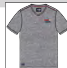
RF 89 grey mel. ID: 19781