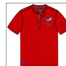
RF 631 paprika ID: 19785