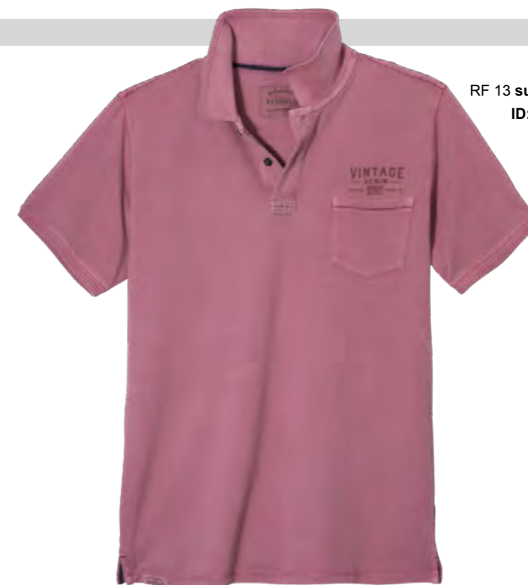
RF 13 summer grape ID: 19871

Style description: Polo Pique 1/2 sleeve with left chest pocket and single color print, collar and cuff ribs with 2 line jacquard-welt tipping Material: Pique, pigment garment dyed & garment washed, 100% Cotton einteilbare Größen: M-8XL