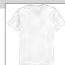
NOS RF 16 white ID: 2514