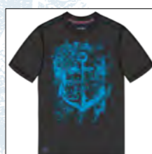
RF 15 black ID: 19792

Style description: T-Shirt 1/2 sleeve, O-Neck, single color big front print, flat lock seams allover Material: Single Jersey, 100% Cotton pigment garment dyed & garment washed einteilbare Größen: M-8XL