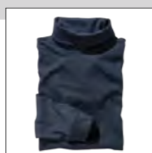
NOS RF 01 navy ID: 353