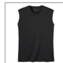
NOS RF 15 black ID: 2076