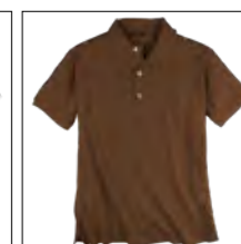
NOS RF 486 lavazza ID: 499