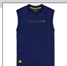
RF 547 night blue ID: 19853