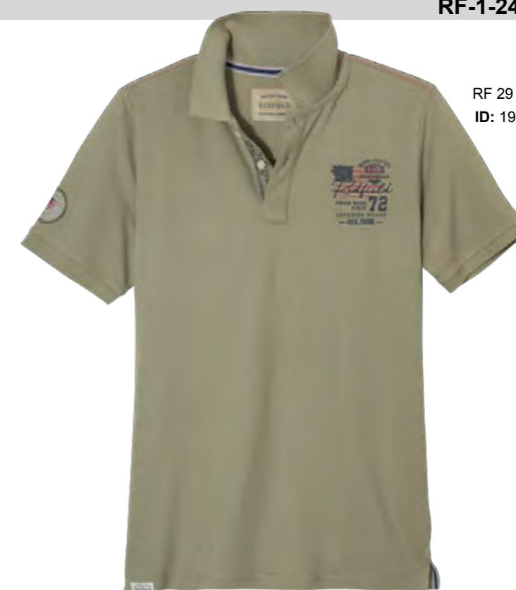
RF 29 oliv ID: 19875

Style description: Polo Pique 1/2 sleeve with left chest 2 color print and embro, right sleeve badge Material: Pique, 100% Cotton einteilbare Größen: M-8XL, 10XL