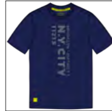
RF 547 night blue ID: 19834