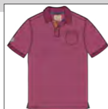
RF 13 summer grape ID: 19916