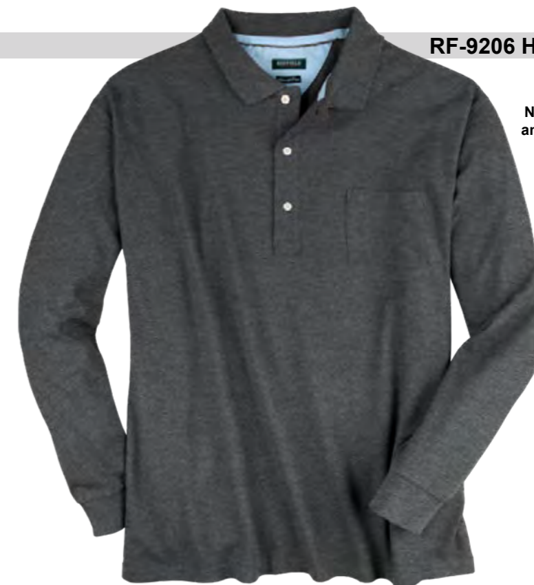
NOS RF 22 anthra. mel. ID: 2289

Style description: Polo Pique Longsleeve (chest pocket) Design: solid & melange | Material: Pique, 100% Cotton, anthra. mel. 80% Cotton 20% Polyester, grey mel. 85% Cotton 15% Viscose einteilbare Größen: M-8XL, 10XL