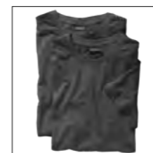
NOS RF 22 antra. mel. ID: 636