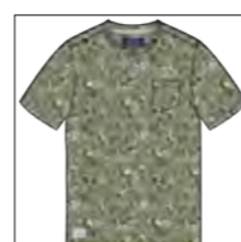
RF 29 oliv ID: 19888