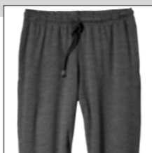
NOS RF 22 anthra. mel. ID: 3192