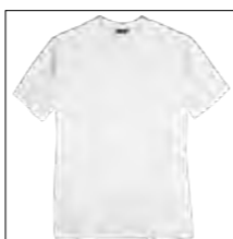
NOS RF 16 white ID: 2573