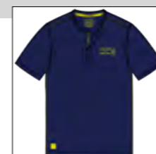
RF 547 night blue ID: 19748