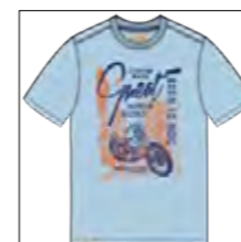
RF 273 ice blue ID: 19933