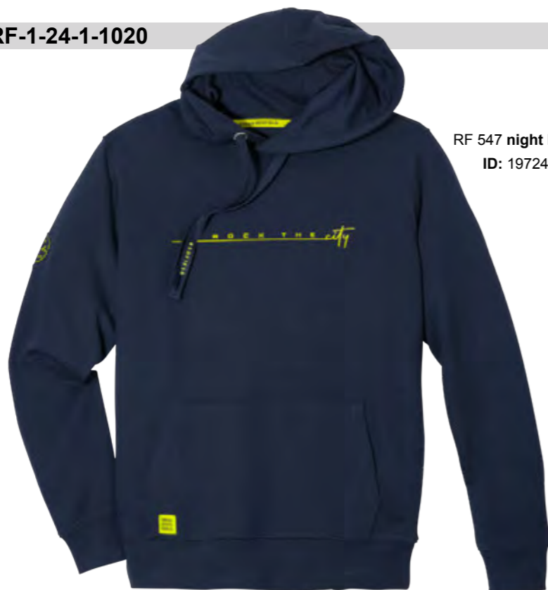
RF 547 night blue ID: 19724