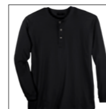
NOS RF 15 black ID: 8280