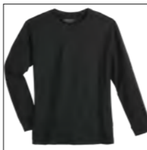
NOS RF 15 black ID: 4077