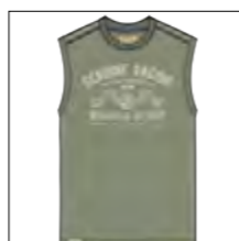
RF 29 oliv ID: 19922