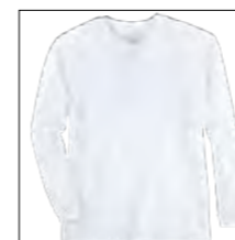
NOS RF 16 white ID: 8282