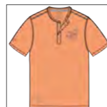
RF 862 light melba ID: 19893