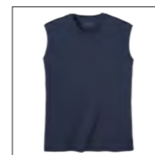
NOS RF 01 navy ID: 2072