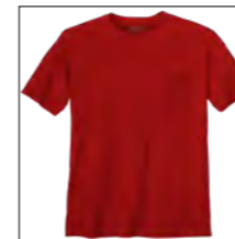
NOS RF 229 hibiskus ID: 10048