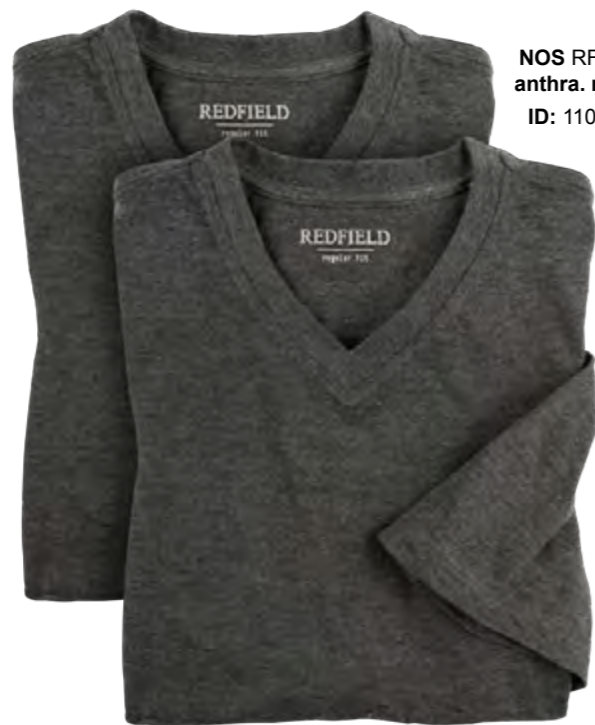
NOS RF 22 anthra. mel. ID: 11078