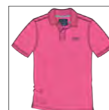
RF 337 bubble ID: 19835