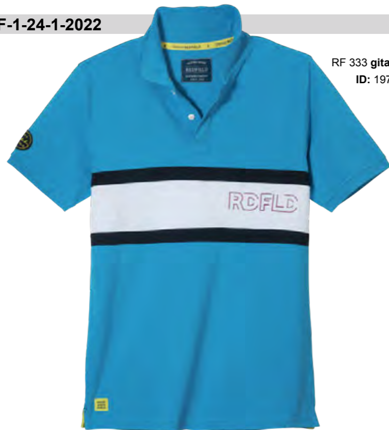
RF 333 gitane blue ID: 19737