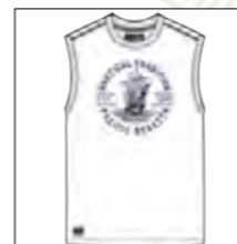
RF 16 white ID: 19798

Style description: T-Shirt sleeveless, O-Neck, center chest print