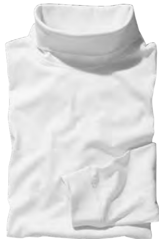
NOS RF 16 white ID: 3683