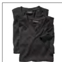
NOS RF 15 black ID: 4109