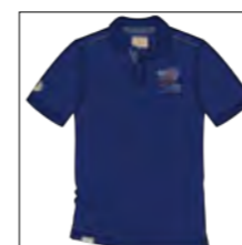
RF 189 dark denim ID: 19873