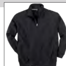
NOS RF 15 black ID: 2526