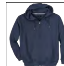
NOS RF 01 navy ID: 1423