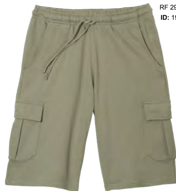
RF 29 oliv ID: 19925