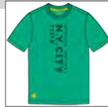
RF 11 pool green ID: 19832