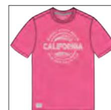
RF 337 bubble ID: 19901

Style description: T-Shirt 1/2 sleeve, O-Neck, center chest print