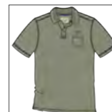
RF 29 oliv ID: 19870