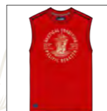
RF 631 paprika ID: 19797