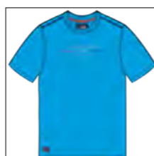
RF 333 gitane blue ID: 19790

Style description: T-Shirt 1/2 sleeve, O-Neck, 4 color center chest high density print Material: Single Jersey, 100% Cotton einteilbare Größen: M-8XL, 10XL