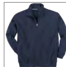
NOS RF 01 navy ID: 2525