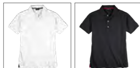
NOS RF 16 white ID: 10045