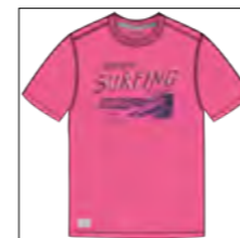
RF 337 bubble ID: 19907