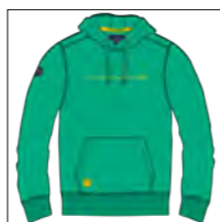
RF 11 pool green ID: 19723