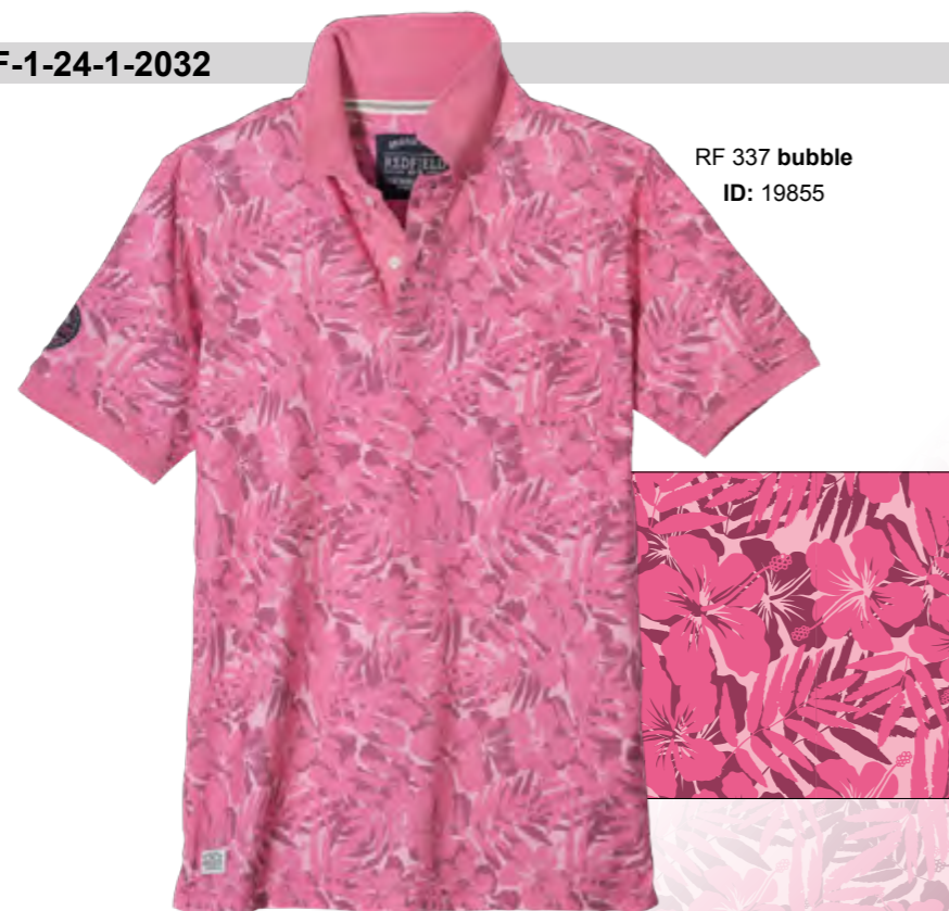
RF 337 bubble ID: 19855