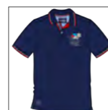
RF 547 night blue ID: 19758