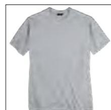
NOS RF 89 grey mel. ID: 4159