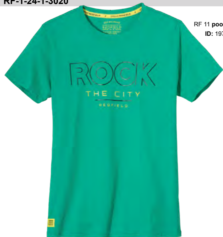
RF 11 pool green ID: 19739