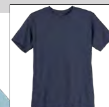
NOS RF 01 navy ID: 738