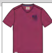
RF 13 summer grape ID: 19952

Style description: T-Shirt 1/2 sleeve, V-Neck collar, left chest print Material: Single Jersey, pigment garment dyed & garment washed, 100% Cotton einteilbare Größen: M-8XL