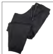
NOS RF 15 black ID: 6937