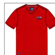
RF 631 paprika ID: 19780