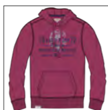
RF 13 summer grape ID: 19861