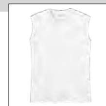
NOS RF 16 white ID: 2077