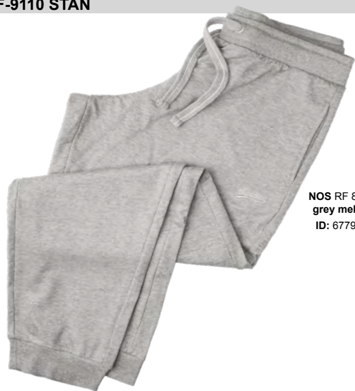
NOS RF 89 grey mel. ID: 6779