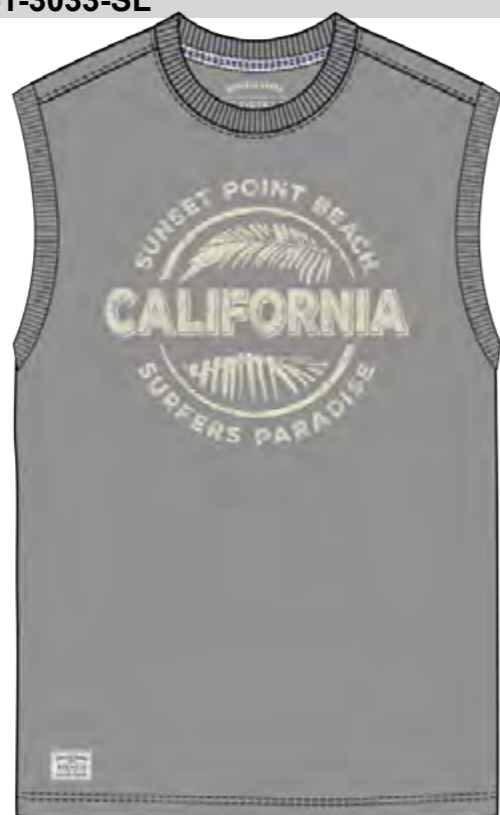
RF RF 759 dove grey ID: 19920