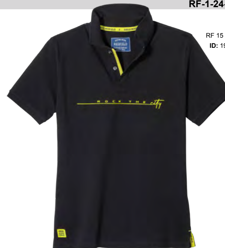
RF 15 black ID: 19727

Style description: Polo Pique 1/2 sleeve with center chest high density print