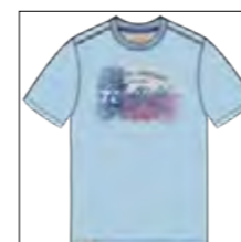
RF 273 ice blue ID: 19947