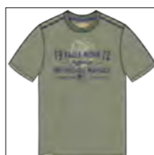
RF 29 oliv ID: 19931

Style description: T-Shirt 1/2 sleeve, O-Neck, 3 color front print Material: Single Jersey, 100% Cotton einteilbare Größen: M-8XL, 10XL