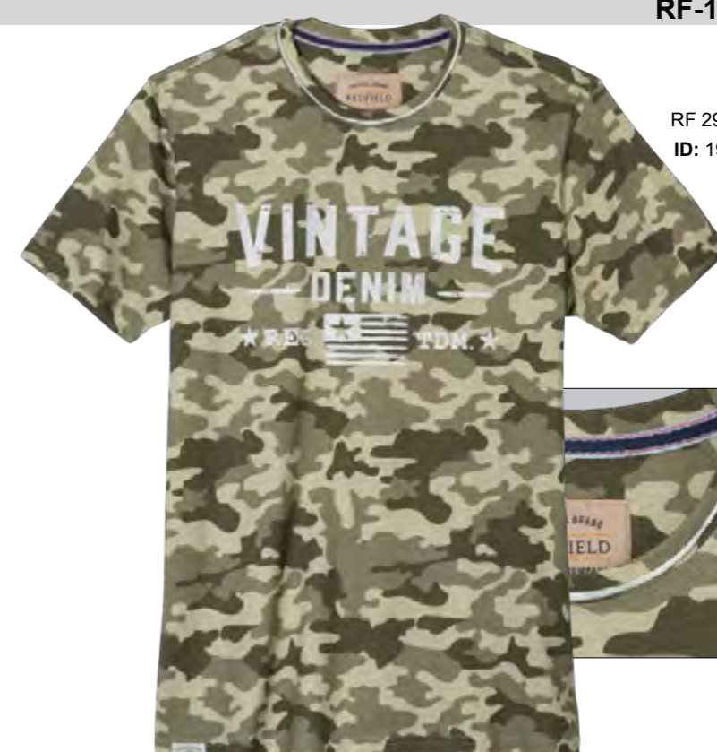
RF 29 oliv ID: 19959

Style description: T-Shirt 1/2 sleeve, O-Neck with rolling edges, center chest print and digital allover print Material: Single Jersey, 100% Cotton einteilbare Größen: M-8XL, 10XL