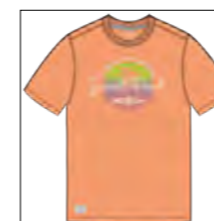
RF 862 light melba ID: 19882