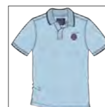
RF 273 ice blue ID: 19829