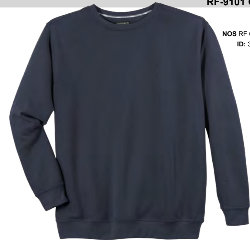
NOS RF 01 navy ID: 373

Style description: Sweatshirt | Design: solid & melange Material: Felpa fabric, 70% Cotton 30% Polyester, anthra. mel. 80% Cotton 20% Polyester, grey mel. 85% Cotton 15% Viscose einteilbare Größen: M-8XL, 10XL