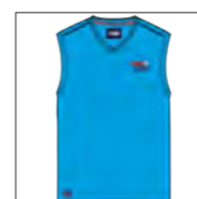
RF 333 gitane blue ID: 19800