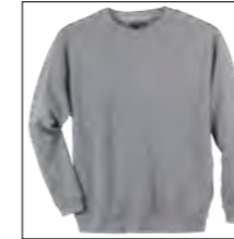
NOS RF 89 grey mel. ID: 3188