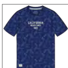
RF 189 dark denim ID: 19899

Style description: T-Shirt 1/2 sleeve, O-Neck, digital all-over print with center chest print