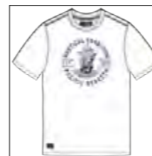
RF 16 white ID: 19769