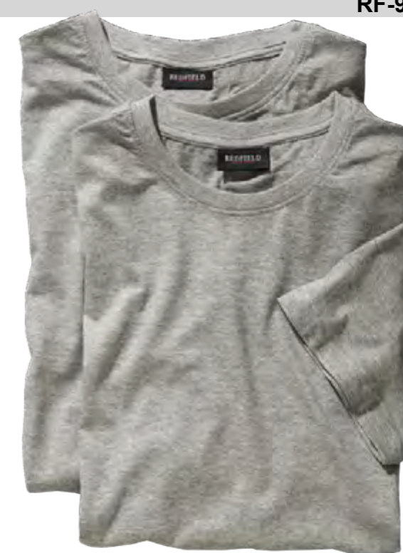
NOS RF 89 grey mel. ID: 574

Style description: T-Shirt, O-Neck (double pack) | Design: solid & melange Material: Jersey, 100% Cotton, antra. mel. 80% Cotton 20% Polyester, grey mel. 85% Cotton 15% Viscose einteilbare Größen: M-8XL, 10XL