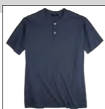
NOS RF 01 navy ID: 2574