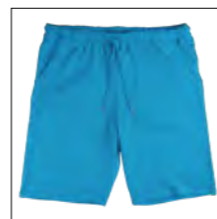
RF 333 gitane blue ID: 19677