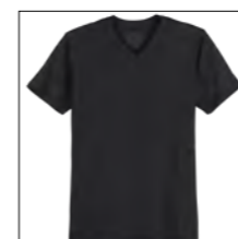
NOS RF 15 black ID: 2519