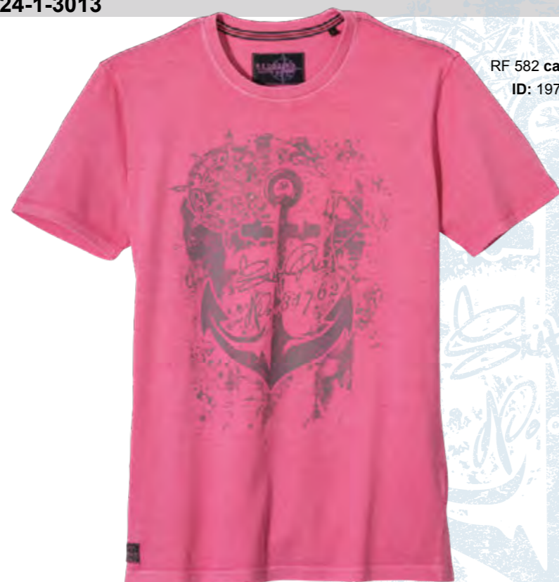
RF 582 calypso ID: 19793