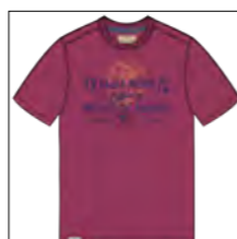
RF 13 summer grape ID: 19932