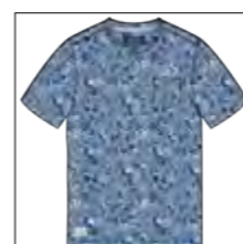
RF 189 dark denim ID: 19887