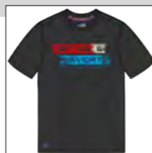
RF 15 black ID: 19775