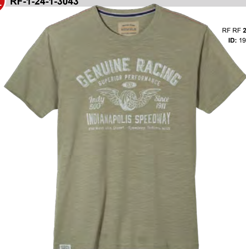
RF RF 29 oliv ID: 19941