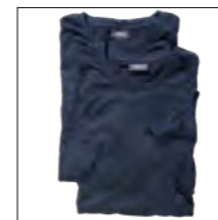
NOS RF 01 navy ID: 3744