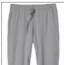
NOS RF 89 grey mel. ID: 753