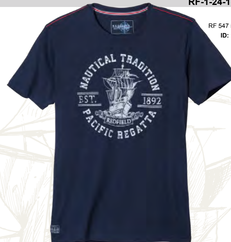
RF 547 night blue ID: 19720