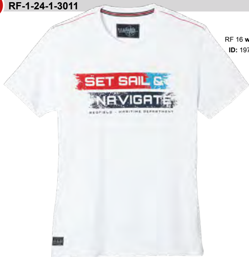
RF 16 white ID: 19773