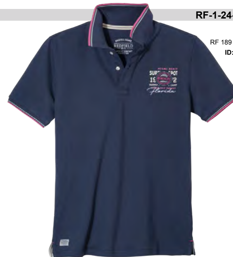
RF 189 dark denim ID: 19825

Style description: Polo Pique 1/2 sleeve with left chest badge and 2 color print with embro, collar and cuff ribs with two contrast tipping