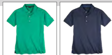
RF 11 pool green ID: 19685

Style description: Polo Pique 1/2 sleeve | Design: solid Material: Pique, 95% Cotton 5% Elasthan einteilbare Größen: M-8XL, 10XL