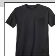
NOS RF 15 black ID: 10077

Style description: T-Shirt, O-Neck (chest pocket) | Design: solid Material: Jersey, 100% Cotton einteilbare Größen: M-8XL, 10XL