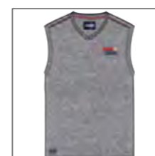
RF 89 grey mel. ID: 19801