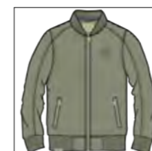
RF 29 oliv ID: 19867