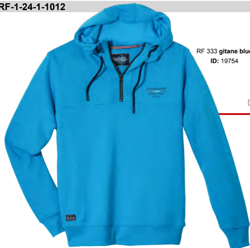
RF 333 gitane blue ID: 19754