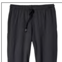
NOS RF 15 black ID: 751

Style description: Jogging Pants without ankle cuffs | Design: solid & melange