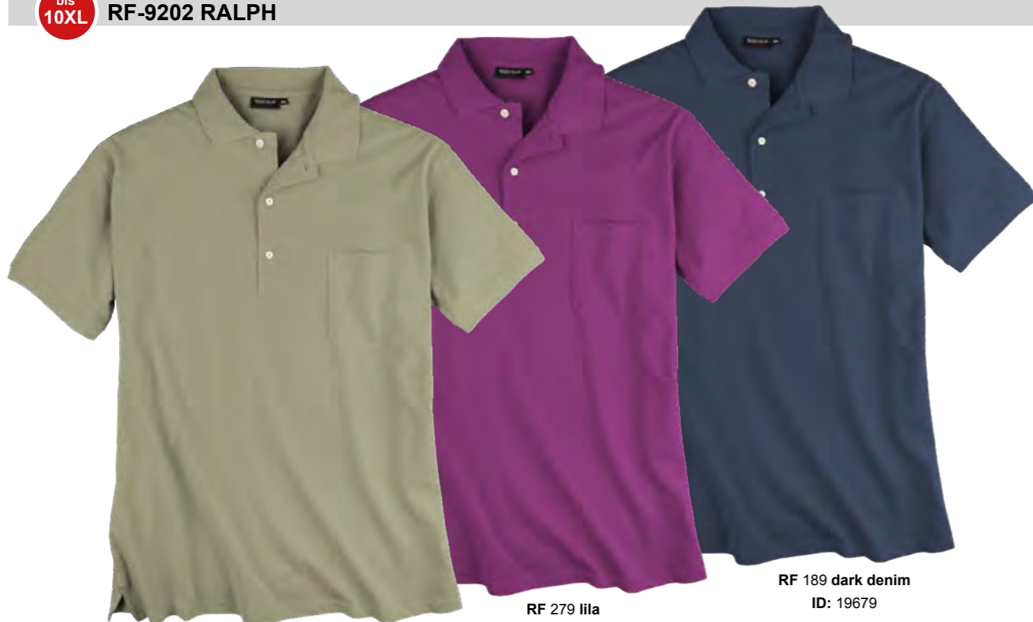
RF 29 oliv ID: 19682