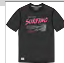
RF 15 black ID: 19908