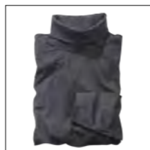
NOS RF 22 anthra. mel. ID: 3685

Style description: Turtleneck Longsleeve | Design: solid & melange Material: Heavy Jersey, 100% Cotton, anthra. mel. 80% Cotton 20% Polyester einteilbare Größen: M-8XL, 10XL