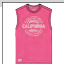
RF 337 bubble ID: 19918