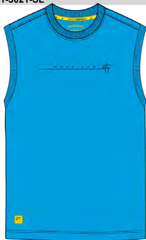
RF 333 gitane blue ID: 19854