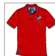
RF 631 paprika ID: 19760

Material: Pique, 100% Cotton einteilbare Größen: M-8XL, 10XL