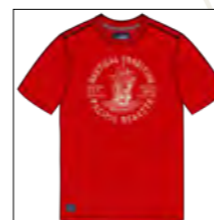
RF 631 paprika ID: 19767

Style description: T-Shirt 1/2 sleeve, O-Neck, center chest print