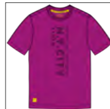
RF 279 lila ID: 19837

Style description: T-Shirt 1/2 sleeve, O-Neck, single color vertical center chest print