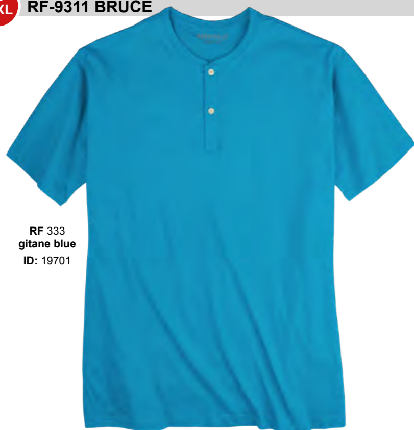
RF 333 gitane blue ID: 19701

Style description: Serafino T-Shirt | Design: solid Material: Jersey, 100% Cotton, grey mel. 85% Cotton 15% Viscose einteilbare Größen: M-8XL, 10XL