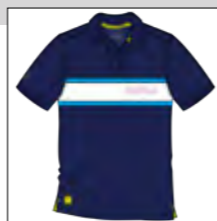
RF 547 night blue ID: 19736

Style description: Polo Pique 1/2 sleeve with 3 stripe chest inset and high density print on center stripe inset, right sleeve badge