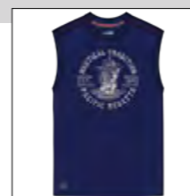
RF 547 night blue ID: 19721