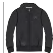
RF 15 black ID: 19824

Style description: Sweat Hoody Jacket with kangaroo pocket, left chest embro and print