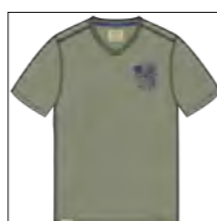
RF 29 oliv ID: 19950