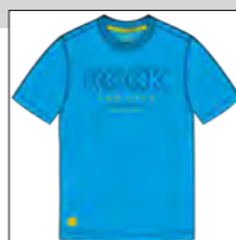
RF 333 gitane blue ID: 19740