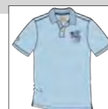
RF 273 ice blue ID: 19874