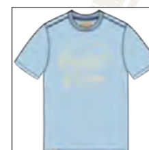
RF 273 ice blue ID: 19940