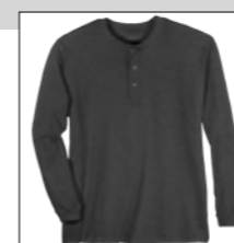
NOS RF 22 antra. mel. ID: 8283

Style description: Longsleeve Serafino T-Shirt | Design: solid & melange Material: Jersey, 100% Cotton, anthra. mel. 80% Cotton 20% Polyester einteilbare Größen: M-8XL, 10XL