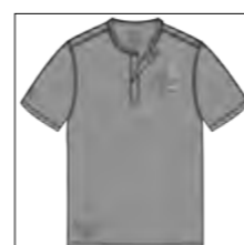
RF 759 dove grey ID: 19892