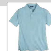
NOS RF 273 ice blue ID: 482

Style description: Polo Pique 1/2 sleeve | Design: solid Material: Pique, 100% Cotton | einteilbare Größen: M-8XL, 10XL