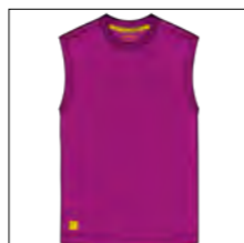
RF 279 lila ID: 19857