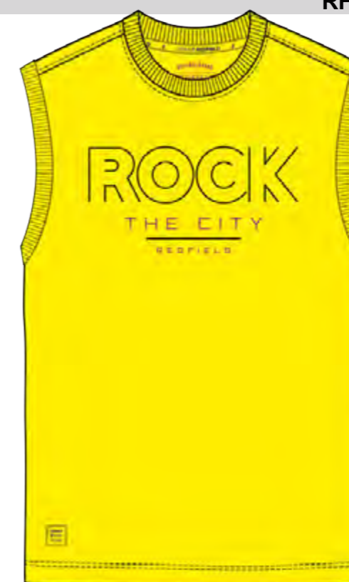
RF 595 sundance ID: 19850

Style description: T-Shirt sleeveless, O-Neck, two color center chest high density print