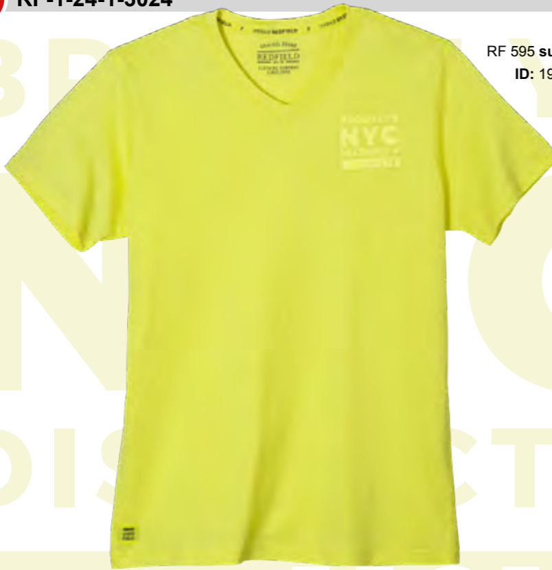
RF 595 sundance ID: 19841