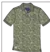
RF 29 oliv ID: 19852