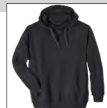
NOS RF 15 black ID: 6777