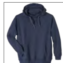
NOS RF 01 navy ID: 6774