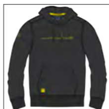
RF 15 black ID: 19722

Style description: Sweat Hoody with draw string and kangaroo pocket,