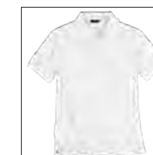
NOS RF 16 white ID: 553