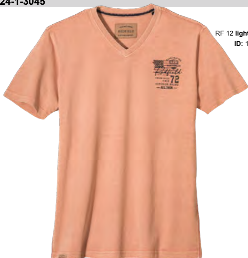
RF 12 light rosewood ID: 19951

Style description: T-Shirt 1/2 sleeve, V-Neck collar, left chest print Material: Single Jersey, pigment garment dyed & garment washed, 100% Cotton einteilbare Größen: M-8XL