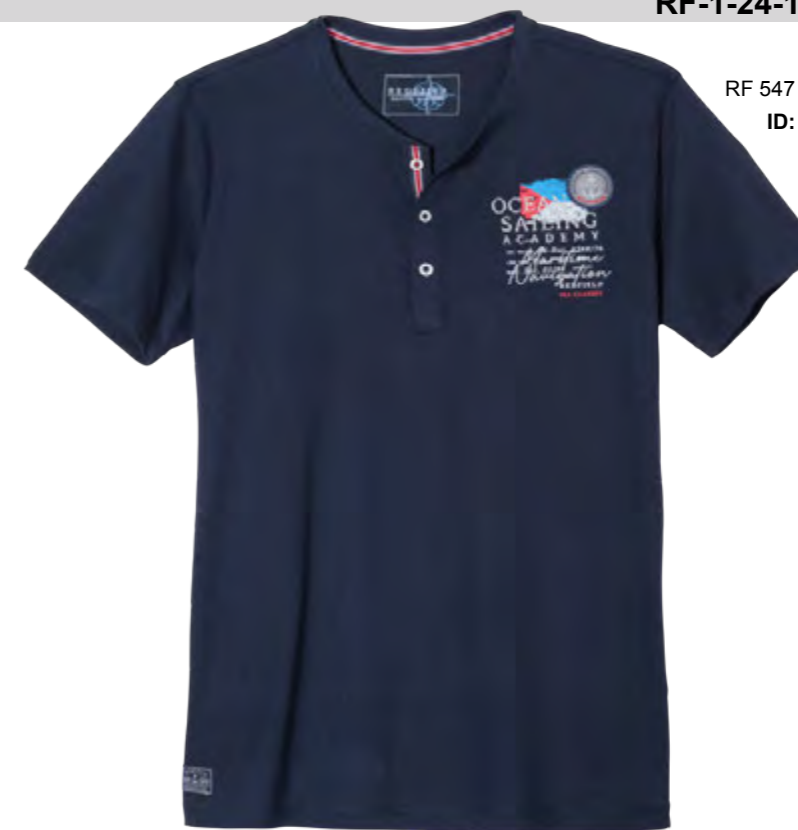
RF 547 night blue ID: 19787