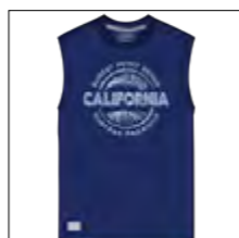
RF 189 dark denim ID: 19917