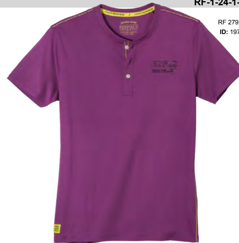
RF 279 lila ID: 19750