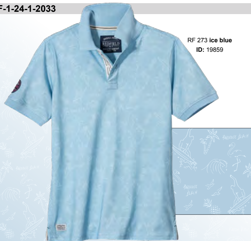
RF 273 ice blue ID: 19859