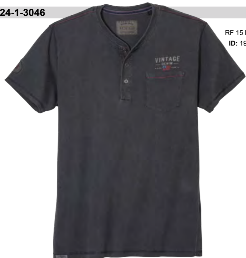
RF 15 black ID: 19957

Style description: T-Shirt 1/2 sleeve, serafino collar, left chest pocket and 3 color print with embro and right sleeve badge Material: Single Jersey, pigment garment dyed & garment washed, 100% Cotton einteilbare Größen: M-8XL