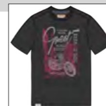
RF 15 black ID: 19936

Style description: Polo jersey with left chest embro and pocket, right sleeve badge Material: Jersey structure stripe, garment cold dyed & garment washed, 100% Cotton einteilbare Größen: M-8XL