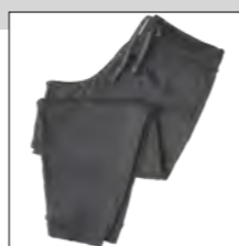
NOS RF 22 anthra. mel. ID: 6778