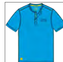
RF 333 gitane blue ID: 19749

Style description: T-Shirt 1/2 sleeve, serafino collar, left chest high density print