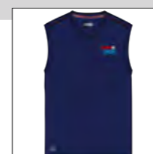
RF 547 night blue ID: 19804