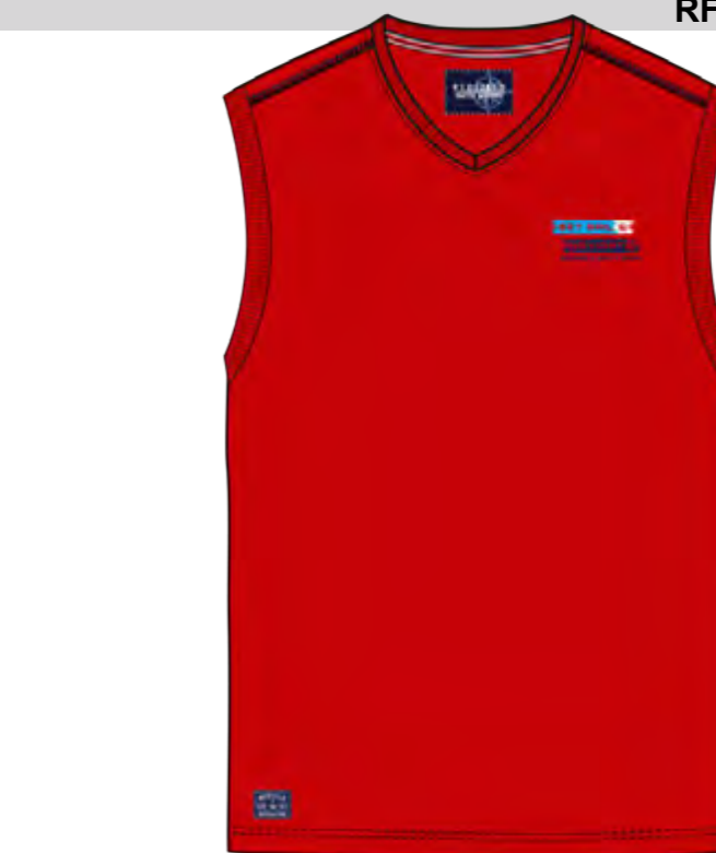
RF 631 paprika ID: 19803

Style description: T-Shirt sleeveless, V-Neck, 3 color left chest print