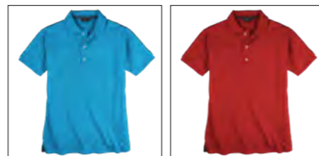
RF 333 gitane blue ID: 19683