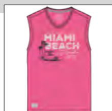
RF 337 bubble ID: 19911