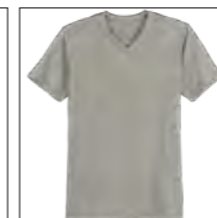
RF 759 dove grey ID: 19699