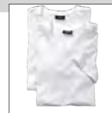
NOS RF 16 white ID: 572