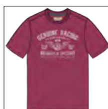
RF 13 summer grape ID: 19944

Style description: T-Shirt 1/2 sleeve, O-Neck, single color front print