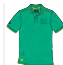
RF 11 pool green ID: 19734