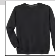
NOS RF 15 black ID: 377