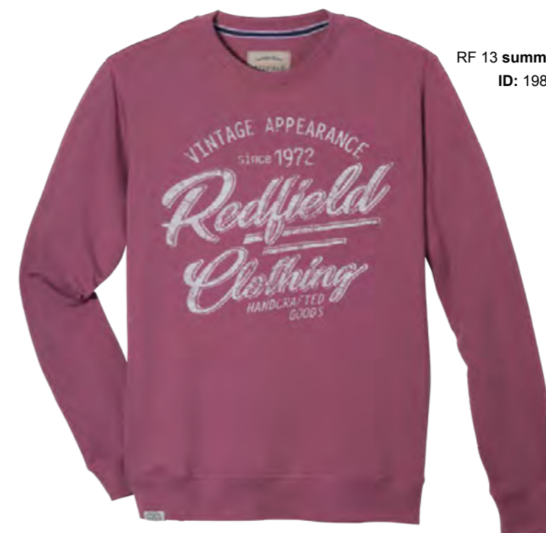
RF 13 summer grape ID: 19864

Style description: Sweat Shirt O-Neck with center chest print