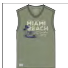
RF 29 oliv ID: 19910