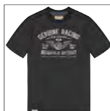
RF 15 black ID: 19945