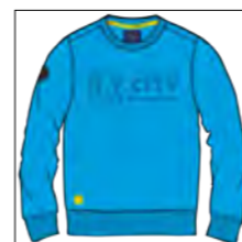
RF 333 gitane blue ID: 19726

Style description: Sweatshirt O-Neck with center chest print and sleeve badge