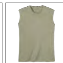
RF 29 oliv ID: 19694