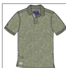
RF 29 oliv ID: 19858

Style description: Polo jersey with digital all-over print and right sleeve badge Material: Single Jersey, 100% Cotton einteilbare Größen: M-8XL, 10XL