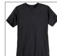
NOS RF 15 black ID: 739

Style description: T-Shirt | Design: solid & melange Material: Jersey, 100% Cotton, anthra. mel. 80% Cotton 20% Polyester einteilbare Größen: M-8XL, 10XL