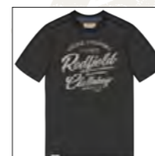
RF 15 black ID: 19937