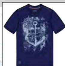
RF 547 night blue ID: 19796