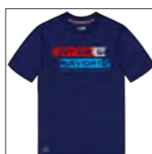
RF 547 night blue ID: 19777

Style description: T-Shirt 1/2 sleeve, O-Neck, 3 color center chest print