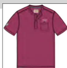
RF 13 summer grape ID: 19956

Style description: T-Shirt 1/2 sleeve, serafino collar, left chest pocket and 3 color print with embro and right sleeve badge Material: Single Jersey, pigment garment dyed & garment washed, 100% Cotton einteilbare Größen: M-8XL