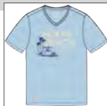
RF 273 ice blue ID: 19886