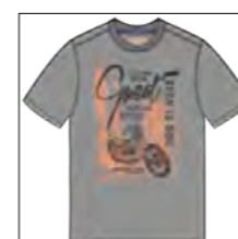
RF 759 dove grey ID: 19934