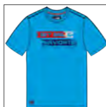
RF 333 gitane blue ID: 19776