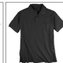
NOS RF 15 black ID: 311