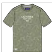
RF 29 oliv ID: 19898