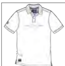
RF 16 white ID: 19763

Style description: Polo Pique 1/2 sleeve with center chest 4 color high density print, halfmoon in oxford fabric, right sleeve badge