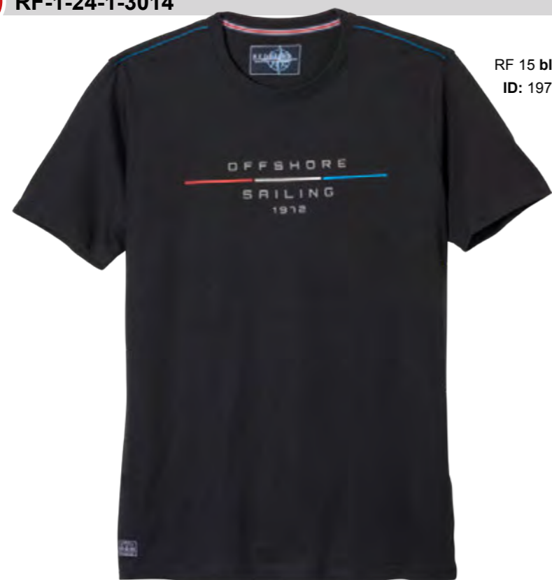
RF 15 black ID: 19791