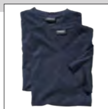
NOS RF 01 navy ID: 4108