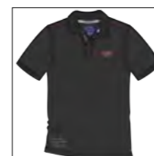
RF 15 black ID: 19836