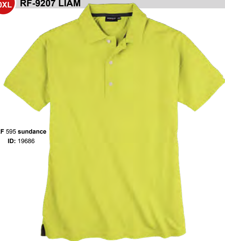
RF 595 sundance ID: 19686

Style description: Polo Pique 1/2 sleeve | Design: solid Material: Pique, 95% Cotton 5% Elasthan einteilbare Größen: M-8XL, 10XL