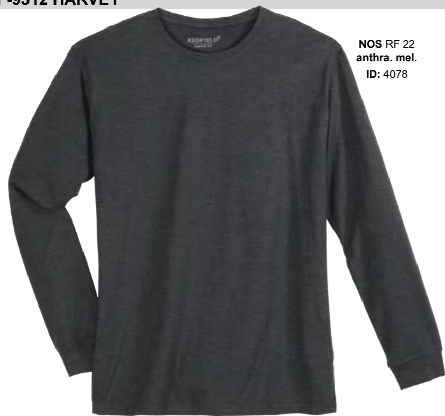
NOS RF 22 antra. mel. ID: 4078

Style description: Longsleeve T-Shirt | Design: solid & melange Material: Jersey, 100% Cotton, anthra. mel. 80% Cotton 20% Polyester einteilbare Größen: M-8XL, 10XL