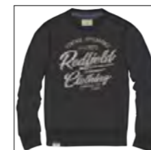
RF 15 black ID: 19865