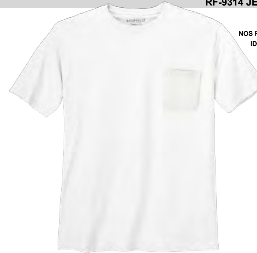
NOS RF 16 white ID: 10078

Style description: T-Shirt, O-Neck (chest pocket) | Design: solid Material: Jersey, 100% Cotton einteilbare Größen: M-8XL, 10XL