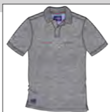
RF 89 grey mel. ID: 19764