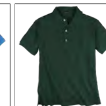
NOS RF 36 dusty green ID: 11415