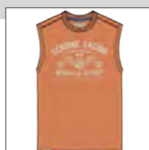
RF 12 light rosewood ID: 19923