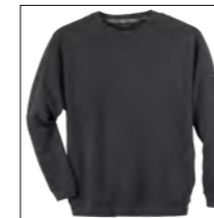
NOS RF 22 anthra. mel. ID: 374