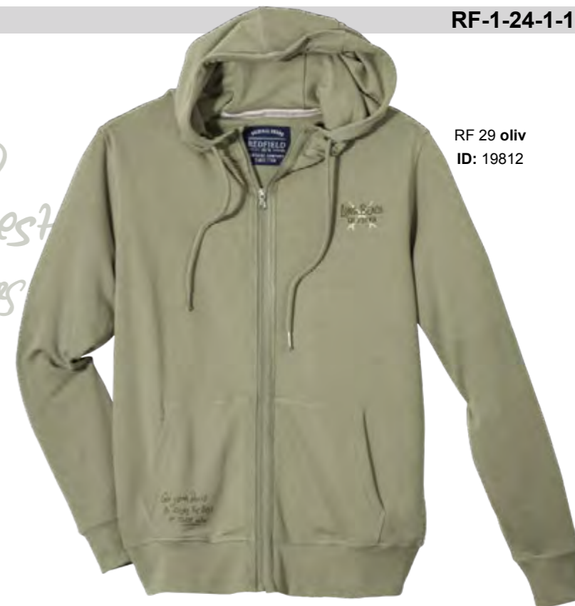
RF 29 oliv ID: 19812

Get your Board & Enjoy The Best of These Waters