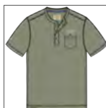
RF 29 oliv ID: 19954