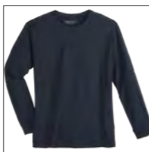
NOS RF 01 navy ID: 4079