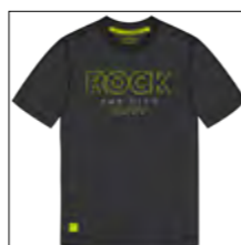
RF 15 black ID: 19738