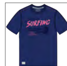
RF 189 dark denim ID: 19905

Style description: T-Shirt 1/2 sleeve, O-Neck, two color center chest print