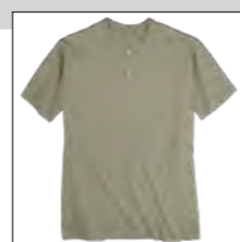
RF 29 oliv ID: 19702

Style description: Serafino T-Shirt | Design: solid Material: Jersey, 100% Cotton, grey mel. 85% Cotton 15% Viscose einteilbare Größen: M-8XL, 10XL