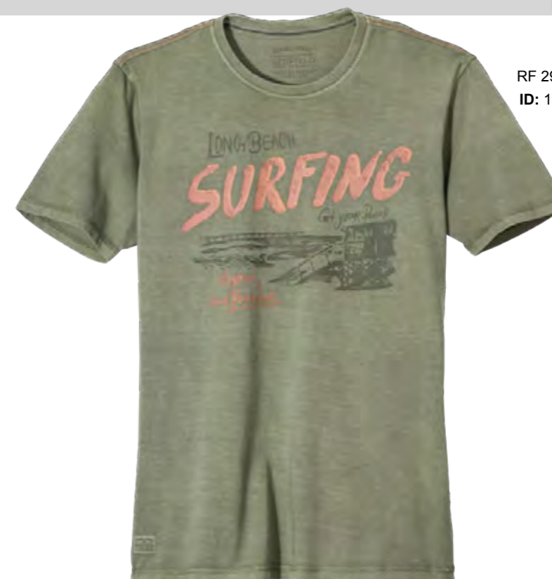
RF 29 oliv ID: 19906