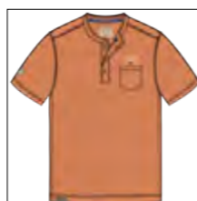
RF 12 light rosewood ID: 19955