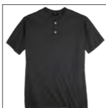
NOS RF 15 black ID: 2570