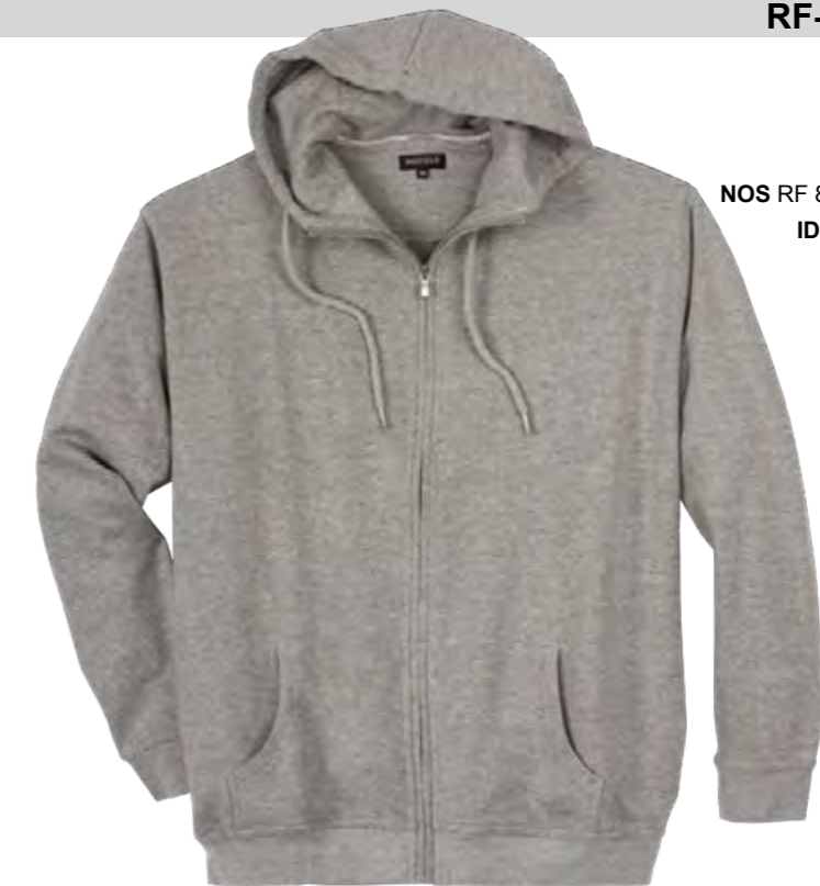
NOS RF 89 grey mel. ID: 709

Style description: Sweat Hoody Jacket | Design: solid & melange Material: Felpa fabric, 70% Cotton 30% Polyester, anthra. mel. 80% Cotton 20% Polyester, grey mel. 85% Cotton 15% Viscose einteilbare Größen: M-8XL, 10XL