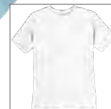
NOS RF 16 white ID: 740