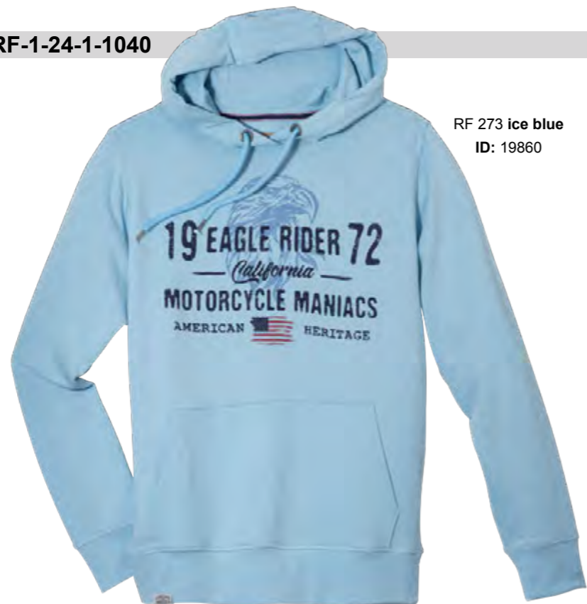
RF 273 ice blue ID: 19860