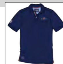
RF 547 night blue ID: 19719