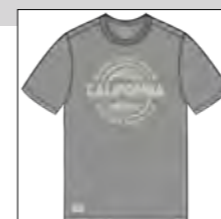
RF 759 dove grey ID: 19903