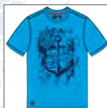
RF 333 gitane blue ID: 19795