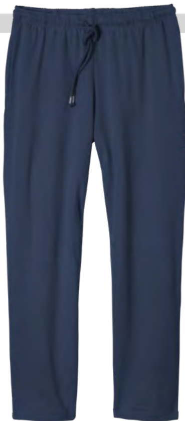
NOS RF 01 navy ID: 752