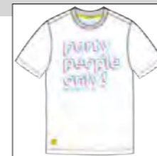
RF 16 white ID: 19844