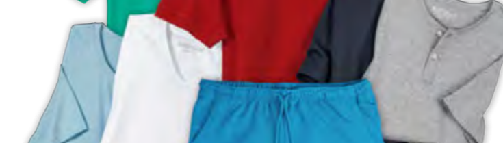
BASICS | Liefertermin Saisonfarben: Sweat 01/2024 | Polo- und T-Shirts 02/2024