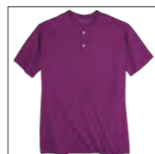
RF 279 lila ID: 19700