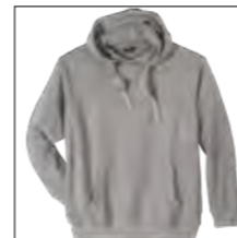
NOS RF 89 grey mel. ID: 6764

Style description: Sweat Hoody | Design: solid & melange