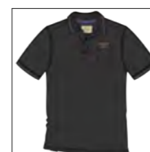
RF 15 black ID: 19872