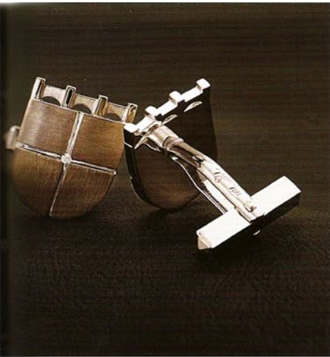
Eleganz aus dem Hause NIVREL: Auch diese edlen Manschettenknöpfe gehörten zum Hauptgewinn