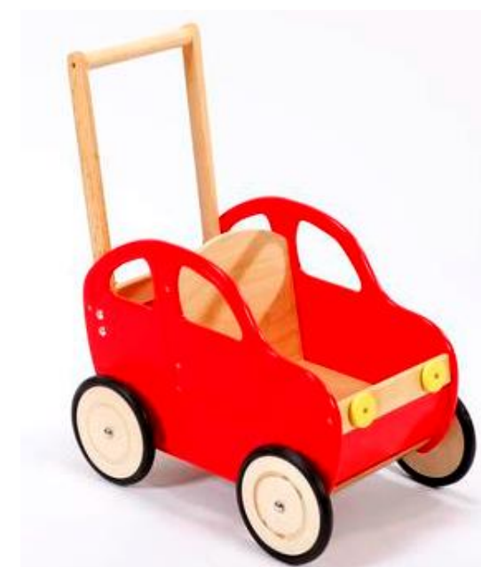
Wózek dla lalek „Auto” Puppenwagen „Auto” Doll’s pram “Auto”

Cieszymy się, że zdecydowali się Państwo na zakup artykułu naszej produkcji. Produkt ten wykonany jest częściowo z mocnego drewna liściastego. Ponieważ drewno jest produktem naturalnym, cechy takie jak nieregularna budowa i kolor są dla niego typowe. Dopilnowaliśmy, aby drewno to pochodziło wyłącznie z kontrolowanych, europejskich zasobów leśnych. Używane przez nas lakiery i kleje są ekologiczne i nieszkodliwe dla zdrowia. Spełniają one rygorystyczne europejskie normy.