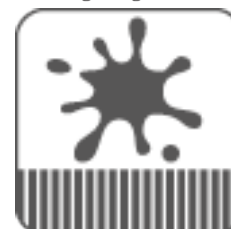
Flecken sofort entfernen