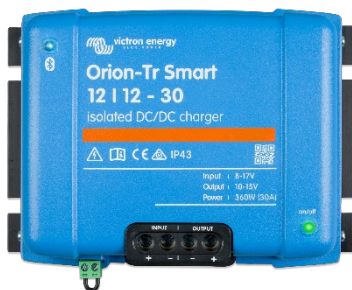
Orion-Tr Smart 12/12-30