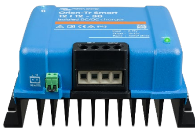
Orion-Tr Smart 12/12-30