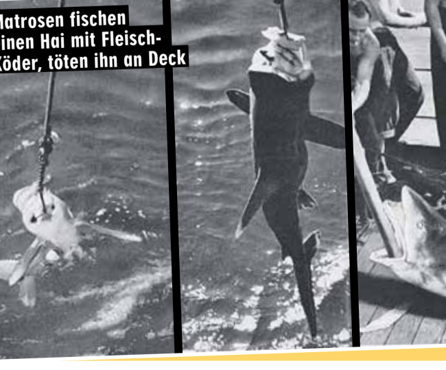
Matrosen fischen einen Hai mit Fleisch-Köder, töten ihn an Deck

Wer sich wehrte, musste noch brutale Martyrien ertragen. * „Peking. Wiederauferstehung einer Legende“. Delius Klasing, nur 1000 Exemplare, 198 Euro. Dazu gibt's ein Original-Deckstück als Souvenir.