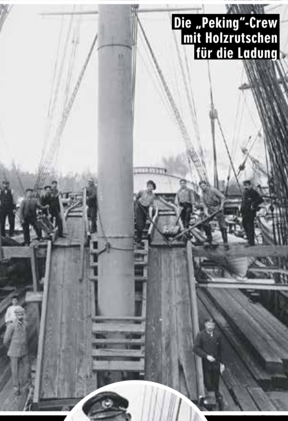
Die „Peking“-Crew mit Holzrutschen für die Ladung

Als der zwei Zentner schwere Kapitän 1945 starb, hatte er 66 Mal