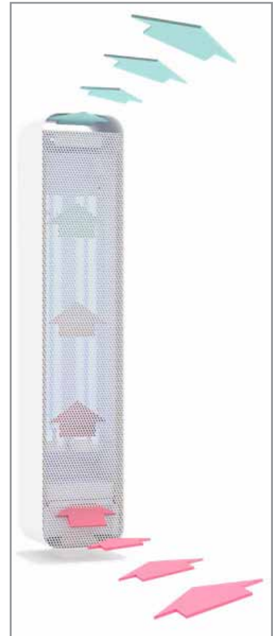
Luftführung durch das Geräteinnere