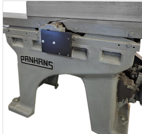
Adapterplatte erforderlich | Adapter plate required