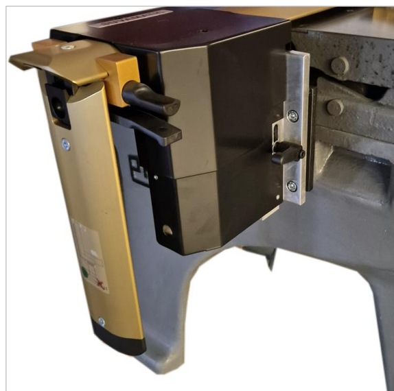
Über Adapterplatte montierter SUVAMATIC | SUVAMATIC mounted via adapter plate