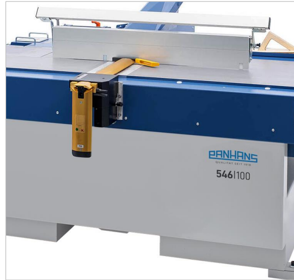
Keine Adapterplatte erforderlich | No adapter plate required