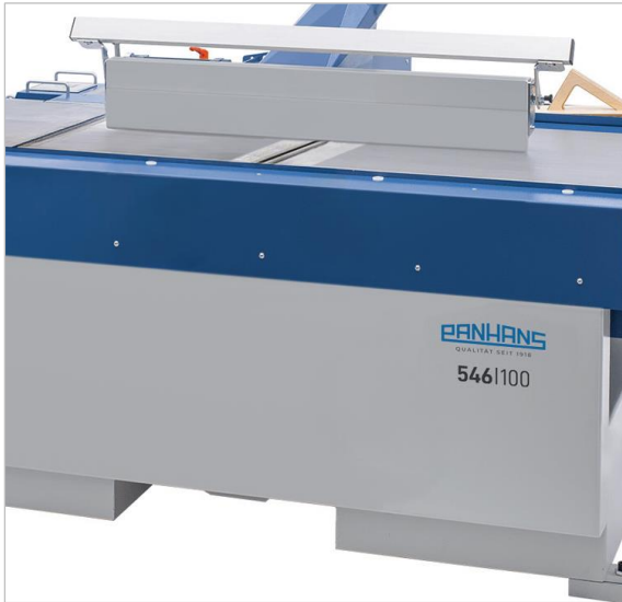
Maschine mit gerader Frontfläche | Machine with straight front surface