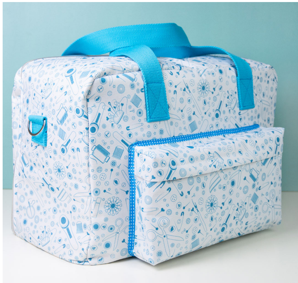
Bei der Nähmaschinentasche „Sarah“ (Freebies aus dem Snaply-Magazin) von Frau Fadenschein kommen gleich 3 Vliese bzw. Einlagen zum Einsatz: Die Einlage S 133 sorgt für einen stabilen Boden, Style Vil gibt einen schönen Stand, Vlieseline H 250 verstärkt u. a. die Futtertasche und die Reißverschlussfächer.