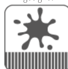
Flecken sofort entfernen