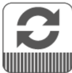
Teppichen von Zeit zu Zeit drehen