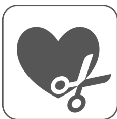
erhältlich im Wunschmaß