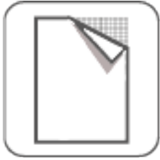
Vollflächige Teppich- unterlage empfohlen