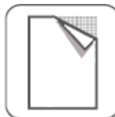
Vollflächige Teppich- unterlage empfohlen