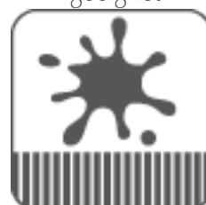
Flecken sofort entfernen