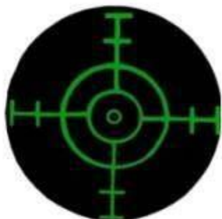
Durchmesser 8,5 cm

Sonst gilt die Summe aus Länge und Breite, geteilt durch 2, z.B. Länge 10 cm + Breite 7 cm ergibt eine Größenklasse bis 8,8 cm.